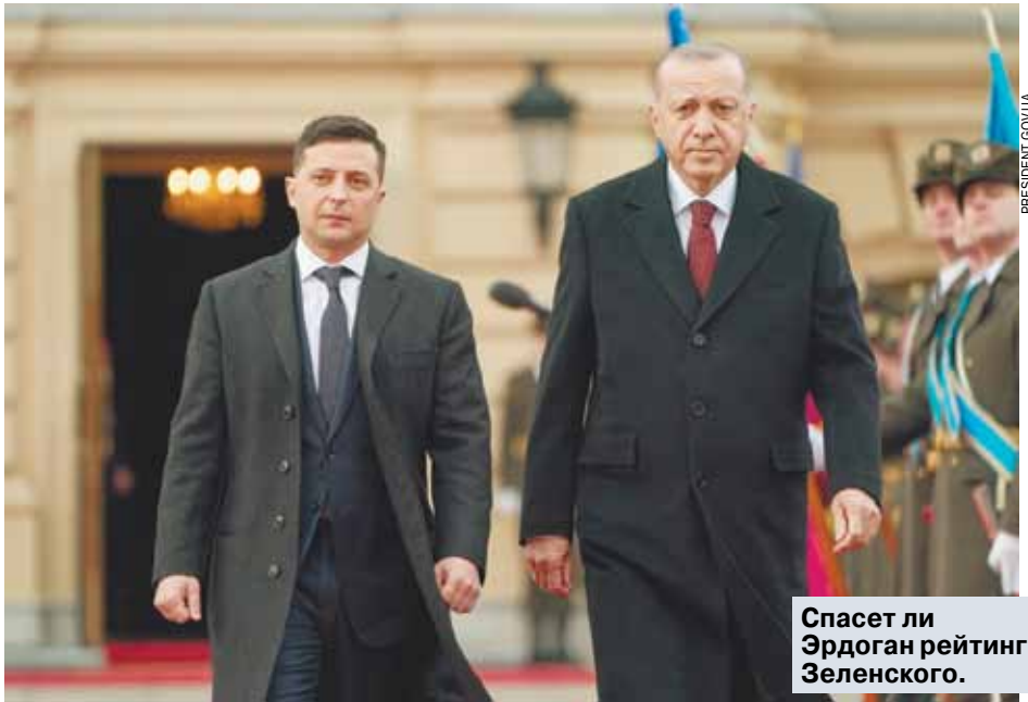
Спасет ли Эрдоган рейтинг Зеленского.

Затем странная выходка в Иерусалиме, непонятая не только израильскими еврейями, но и местными. А в Польше его как