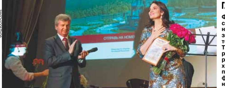
Выступление заслуженной артистки России Нины Шацкой в госпитале имени Н.Н.Бурденко.