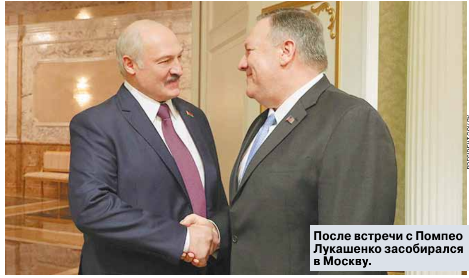
После встречи с Помпео Лукашенко засобирался в Москву.