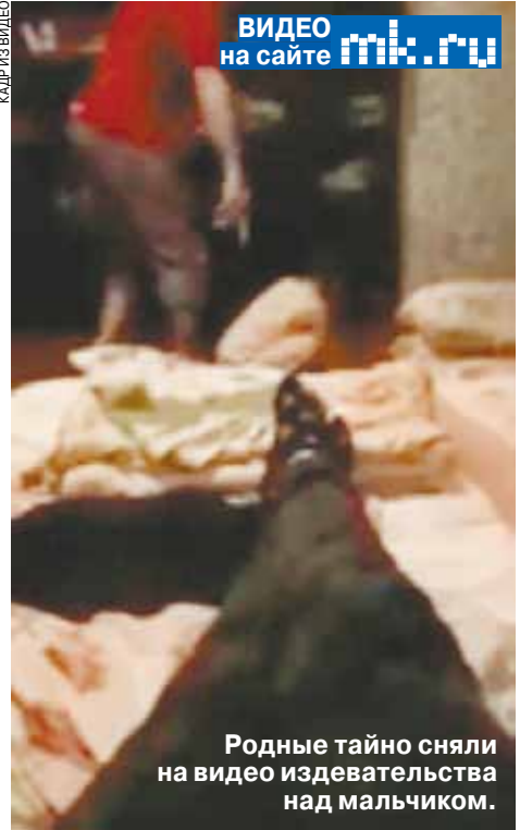
ВИДЕО на сайте mk.ru