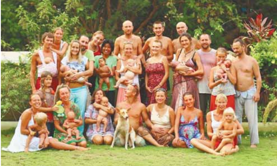
сердце поет! А ребеночек в животике, он же все чувствует, впитывает!

— Я общаюсь не только с беременной мамой, но и с «беременными» папой. И не только для того, чтобы передать им какие-то знания (сейчас все можно найти в Интернете), главное в подготовке к родам — это взаимоотношения в паре, взаимное доверие. Мы