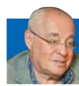
Марк РОЗОВСКИЙ, режиссер