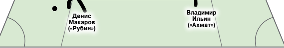
Символическая сборная 5-го тура. Версия «МК»

В центральном матче тура встретились неудачники предыдущего футбольного уик-энда. Несколькими днями ранее «быки» неожиданно уступили «Уралу», а армейцы про-