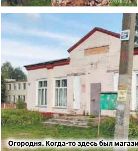
Огородня. Когда-то здесь был магазин.

был нарушен лишь после президентских выборов. Но шумел Мозырь недолго. Силовики быстро остудили пыл протестующих.