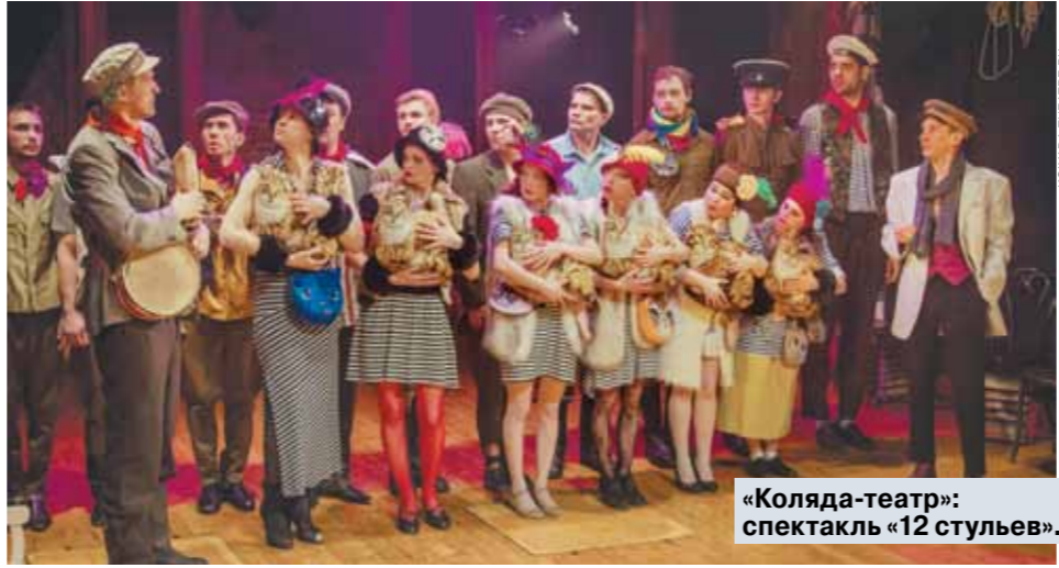
«Коляда-театр»: спектакль «12 стульев».

— Да все уже давно открылось и работает. Закрыты только театры и кинотеатры. Почему?