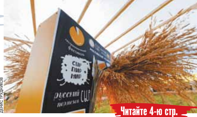
Читайте 4-ю стр.

В Истре открылся Всероссийский гастрономический фестиваль «Сыр. Пир. Мир»