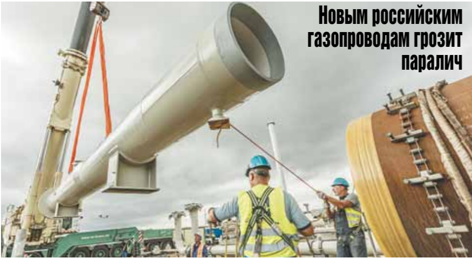
Новым российским газопроводам грозит паралич

Россия получила очередной удар в газовой войне, который она перманентно ведет с внешним миром. Только-только забрезжил свет в конце туннеля в отношении перспектив урегулирования спора о транзите газа в Европу через Украину, как подоспели грозные санкции Минфина США против газопроводов «Северный поток-2» и «Турецкий поток». Они вступают в силу немедленно: то есть западные компании, ведущие прокладку труб, должны прямо сейчас прекратить строительство. Это грозит парализовать амбициозные российские газовые проекты, которые как раз и призваны заменить украинский транзитный маршрут.