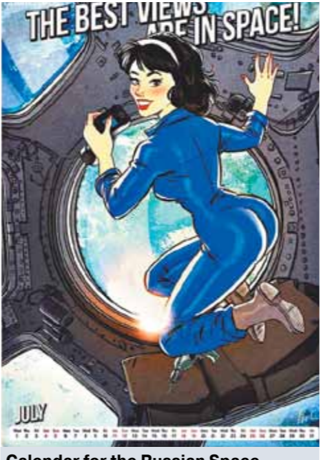
Calendar for the Russian Space Agency 2020! Space Pin-Up! (Календарь для Главкосмоса и Роскосмоса на 2020-й! Космический пин-ап!)

Знаем, что чиновники Роскосмоса спустились на тормозах самое громкое космическое преступление века на МКС