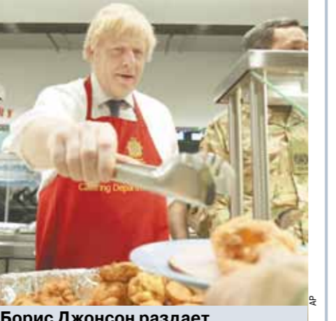
Борис Джонсон раздает рождественский обед британским военным, размещенным в Эстонии.

У лейбористов все гораздо менее радостно. На волне разгрома недельной давности они наконец решили занять четкую позицию по отношению к Брекзиту. Честно говоря, это уже выглядело как припарка для скелета, но зато данное решение предусматривало, что сохранение своих кресла депутаты-лейбористы в едином порыве проголосуют против предложения Джонсона. Однако реальность оказалась полна разочарований для оппозиции.