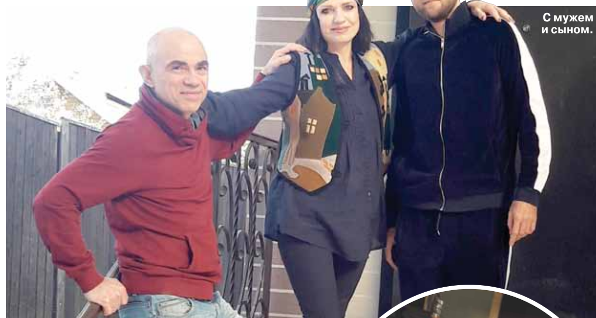
С мужем и сыном.