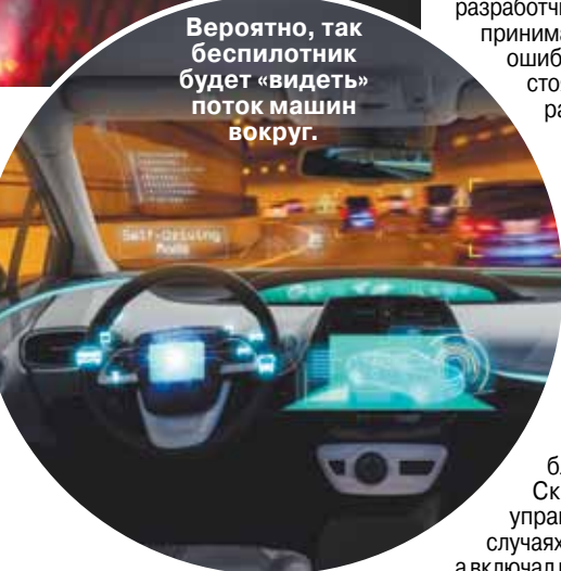
Вероятно, так беспилотник будет «видеть» поток машин вокруг.

Центральный компьютер проводит оценку возможности пересечения траекторий автомобиля и препятствия. В зависимости от выбранного сценария автомобиль производит либо корректировку маршрута для безопасного маневра, либо остановку, вплоть до