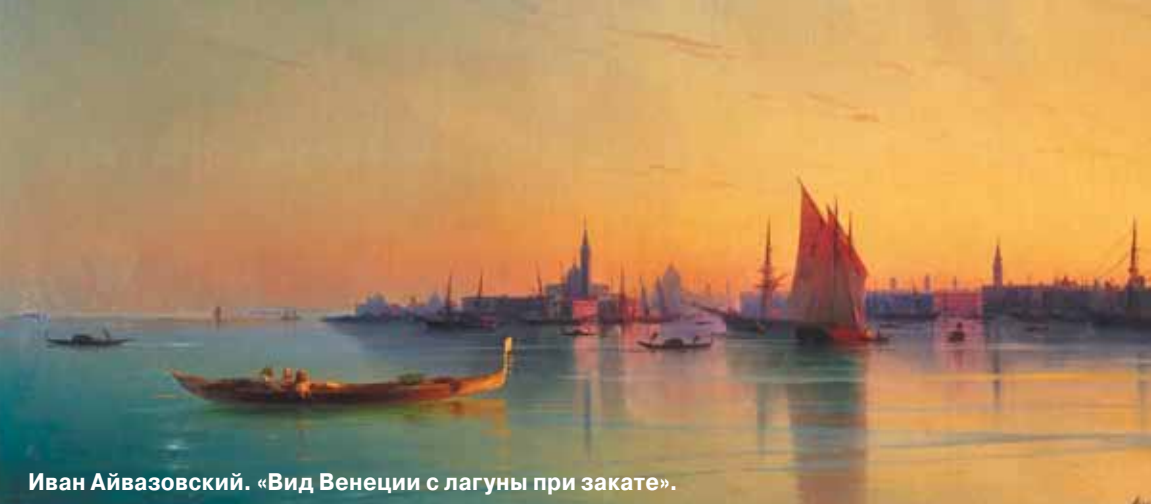
Иван Айвазовский. «Вид Венеции с лагуны при закате».

«МК» подводит итоги «русских торгов» в Великобритании