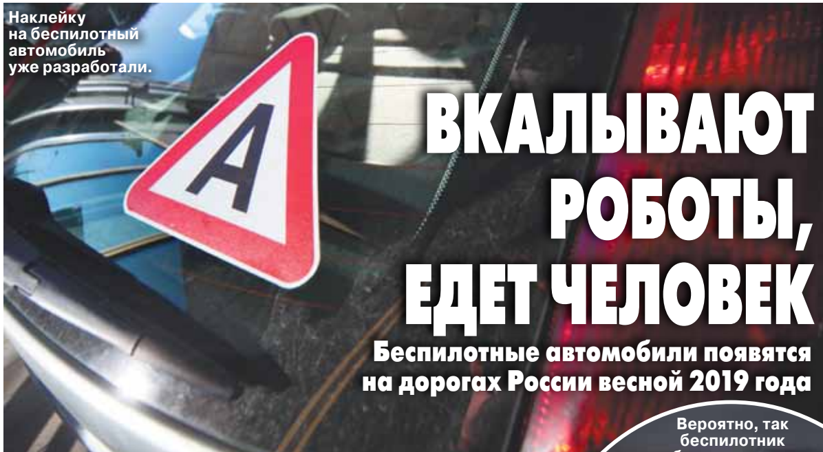
Наклейку на беспилотный автомобиль уже разработали.

Я боялся не упомянуть всего, о чем он говорил.