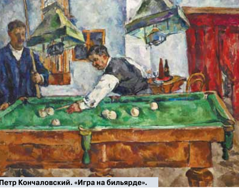
Петр Кончаловский. «Игра на бильярде».