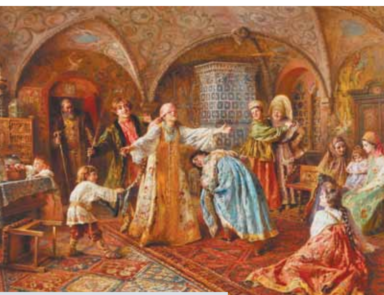
Константин Маковский. «Жмурки».

То же касается второй сенсации — рекорда на картину Нико Пирсомани «Грузинка в лекачки»: при оценке £500–700 тыс. она ушла за £2,2 млн. До этого самой дорогой картиной грузинского мастера была работа «Арсенальская гораночка», купленная на ионских «русских торгах» Christie's в 2015-м за £962,5 тыс. Былшим премьер-министром Грузии, миллиардером Бидзиной Иванишвили. «Пирсомани продан с трехкратным