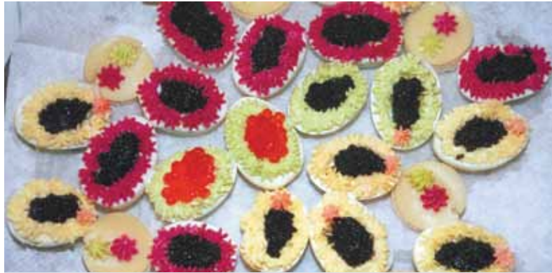
Жить стало лучше: икра лососевых стоила 3922,5 рубля за кг, а теперь ее можно приобрести аж на 11 рублей дешевле.

блюда выросла на 4%: с 312 рублей до 323 рублей. Из таблиц Росстата видно, что среди составляющих салата оливье сильнее всего выросла в цене вареная колбаса. В январе 2018-го она стоила 360 рублей за килограмм, а к концу года подорожала на 15 рублей. Тем, кто предпочитает «люксовый» вариант оливье — с говяжьей, тоже придется заплатить больше. Бескостная говядина подорожала с 463,4 рубля до 475,8 рубля за кило. Зато подешевел картофель. В начале года он стоил 24 рубля за кг, а сейчас его можно найти в среднем за 21 рубль. Вместе с тем для любителей селедки под шубой хорошие новости: на нее придется потратить всего лишь на 2% больше — 153 вместо 151 рубля.