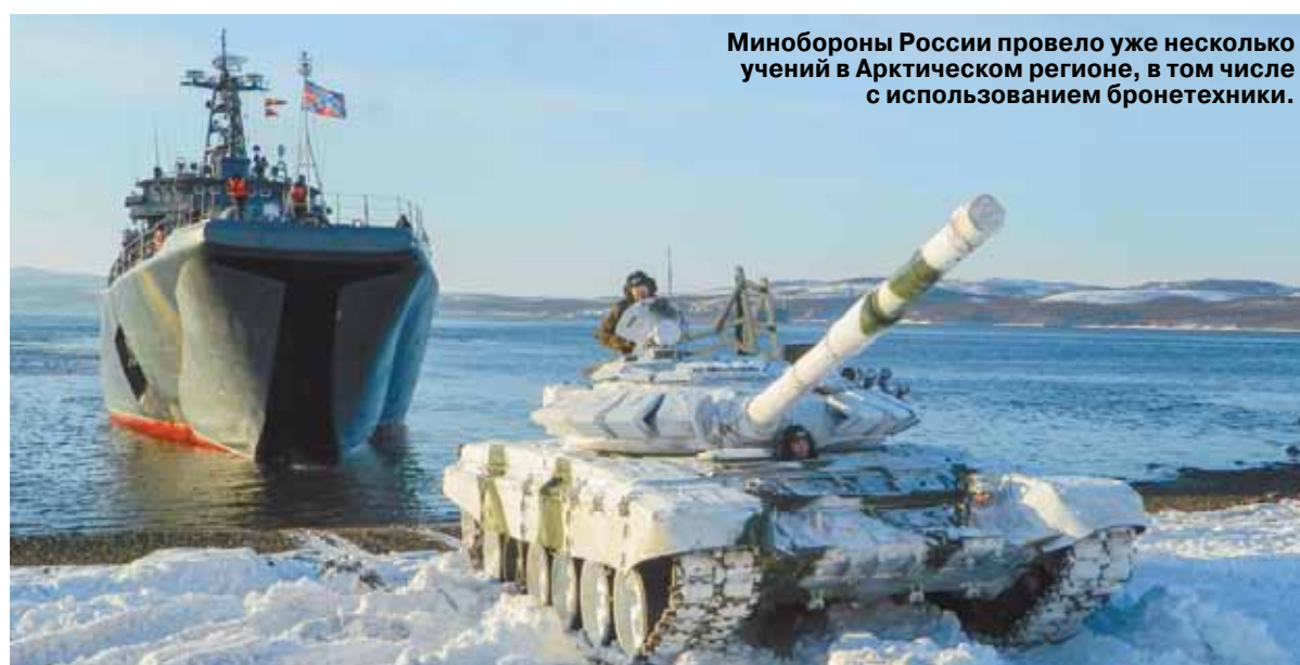
Минобороны России провело уже несколько учений в Арктическом регионе, в том числе с использованием бронетехники.

Такой подход во многом помог функционированию российских войск в Сирии. И не только. У России на северо-западе есть анклав — Калининградская область. Полет в этот регион воздушных судов из Санкт-Петербурга проходит над нейтральными водами, вблизи воздушных границ некоторых бывших союзных республик, которые до дружи бояться большого соседа. Чтобы страх было меньше, Минобороны совместно с