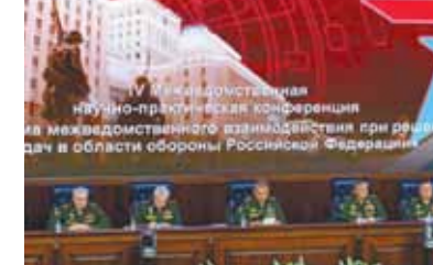
В главном зале Центра управления обороной страны.