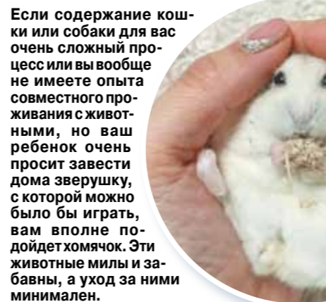
Если содержание кошки или собаки для вас очень сложный процесс или вы вообще не имеете опыта совместного проживания с животными, то ваш ребенок очень просит завести дома зверушку, с которой можно было бы играть, вам вполне подойдет хомячок.