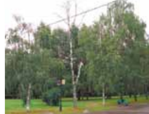
Дерево так и не спилили.