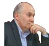
Матвей ГАНАПОЛЬСКИЙ, журналист, обозреватель «Эха Москвы»