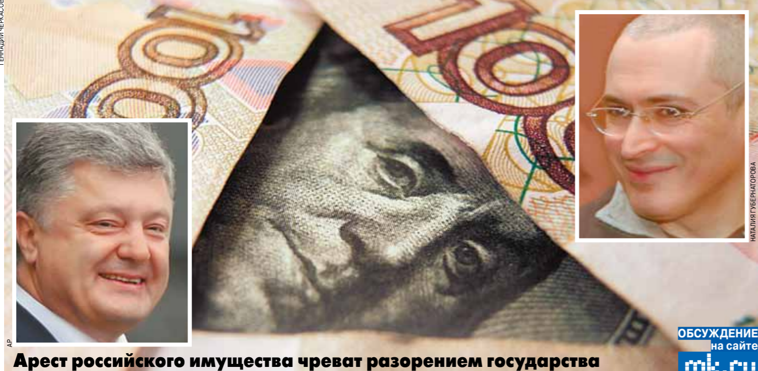
Арест российского имущества чреват разорением государства

Бывшие акционеры ЮКОСа обратились в Высший земельный суд Берлина с иском против нашей страны на сумму в $42 млрд. Речь идет о конфискации российского имущества в Германии, а также изъятия доходов наших энергокомпаний. Таким образом, бывшие владельцы ЮКОСа добиваются исполнения решения Гаагского третейского суда от 2014 года. Аналогичные иски уже приняты к исполнению