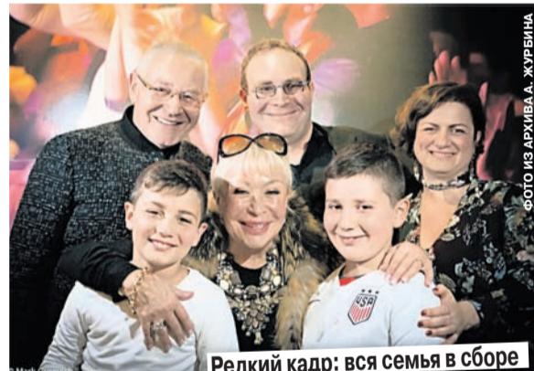
Редкий кадр: вся семья в сборе

Ширвани и кто-то еще третий, не помню кто, пошли в ближайшую закусочную. Я даже помню, где она находилась: на другой стороне Садового кольца, тогда его можно было спокойно перейти. И вот там была какая-то кафешка. Мы взяли пельмени и по сто грамм вод-