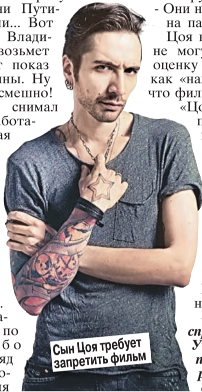
Сын Цоя требует запретить фильм

- Как это не спросили? Они с Учителем подписывали разрешительные документы.