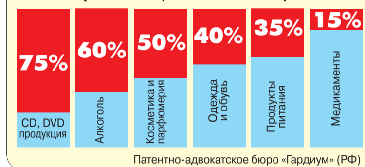
Доля контрафакта на потребительском рынке РФ (за 2018-2019 гг.):

товара от производителя или от границы до розничной торговли включительно. К 2022 году, по плану Минпромторга России, маркировкой будет охвачено свыше 80% всего ассортимента продукции массового спроса. Но такое оборудование предписано закупать самим производителям, что, например, по продукции легпрома, парфюмерии и бытовой хи-