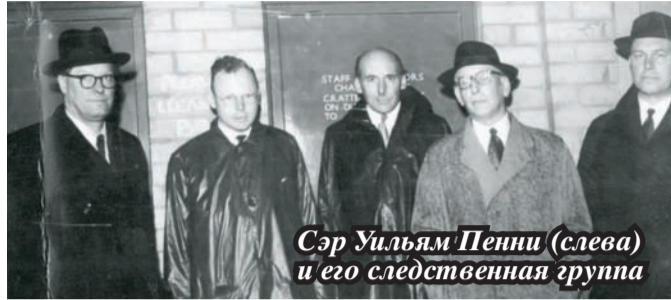
Сэр Уильям Пенни (слева) и его следственная группа

Именно Уильям Пенни, так называемый отец британской бомбы, определял, как нужно наносить атомные удары по окруженным холмами японским городам Хиросиме и Нагасаки. Это он указал американским во-