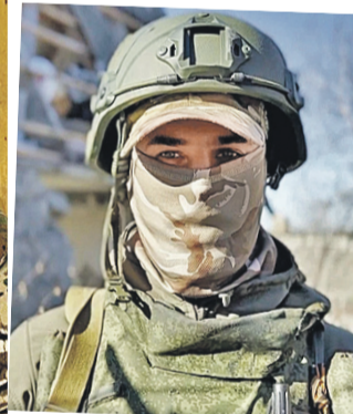
Командир расчета «Латыш» не смог жить в Киеве из-за бандеровщины.

Кременского. На счету батальона и ценные разведанные. Благодаря им было успешно нанесено огневое поражение по 126 единицам бронетехники на станции Запорожье-2. Это в 60 километрах отсюда, там техника стояла на железнодорожных платформах, и наша доблестная армия их уничтожила. Это подтверждается в радиоперехватах противника.