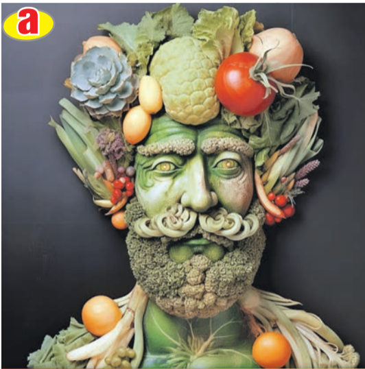
1. Джузеппе Арчимбольдо (1526 или 1527 - 1593)

Нейросети продолжают рисовать. Да так искусно, что порой трудно отличить от произведений человеческих. Собственно, это мы вам и предлагаем сделать.