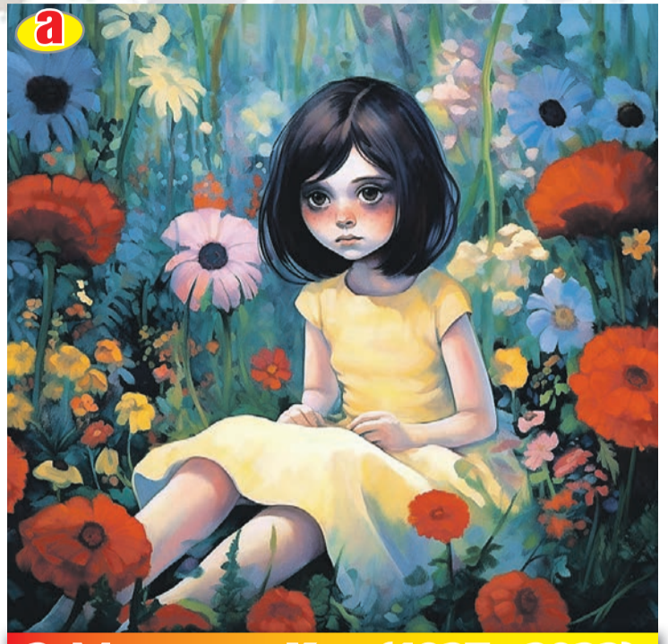
2. Маргарет Кин (1927 - 2022)

лизм. Однако портреты, составленные из фруктов, цветов и предметов, навсегда остались неповторимым стилем Арчимбольдо (хотя нейросеть-то повторила!).