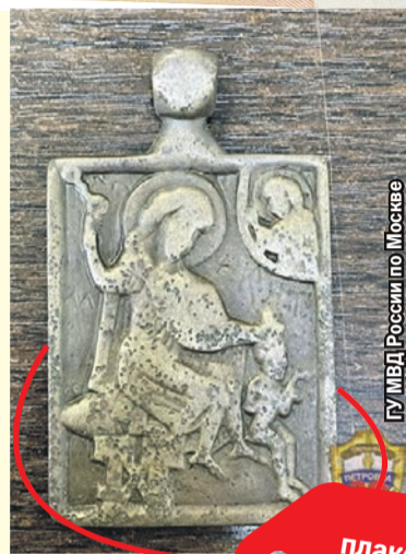
Чеканная плакетка «Господь Вседержитель» (XII век, Франция) - 4,2 млн рублей.