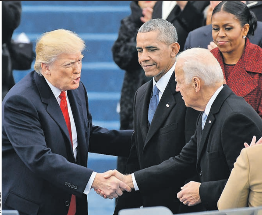
Выбирают хозяина Белого дома граждане Соединенных Штатов, а влияет это на весь мир. Это знают Дональд Трамп, Барак Обама и Джо Байден (на фото - слева направо).

- Китай, возможно, тоже не слишком заинтересован в военной эскалации?