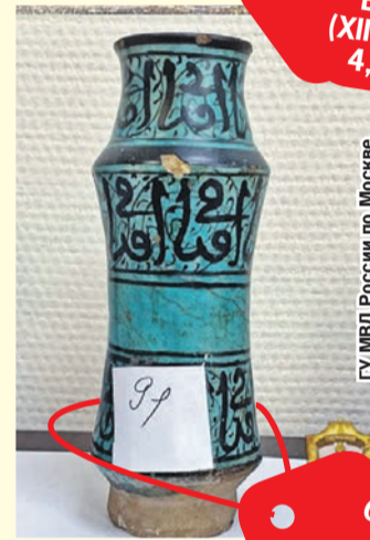
Сосуд с арабской вязью (XIII век, Золотая Орда) - 970 тысяч рублей.