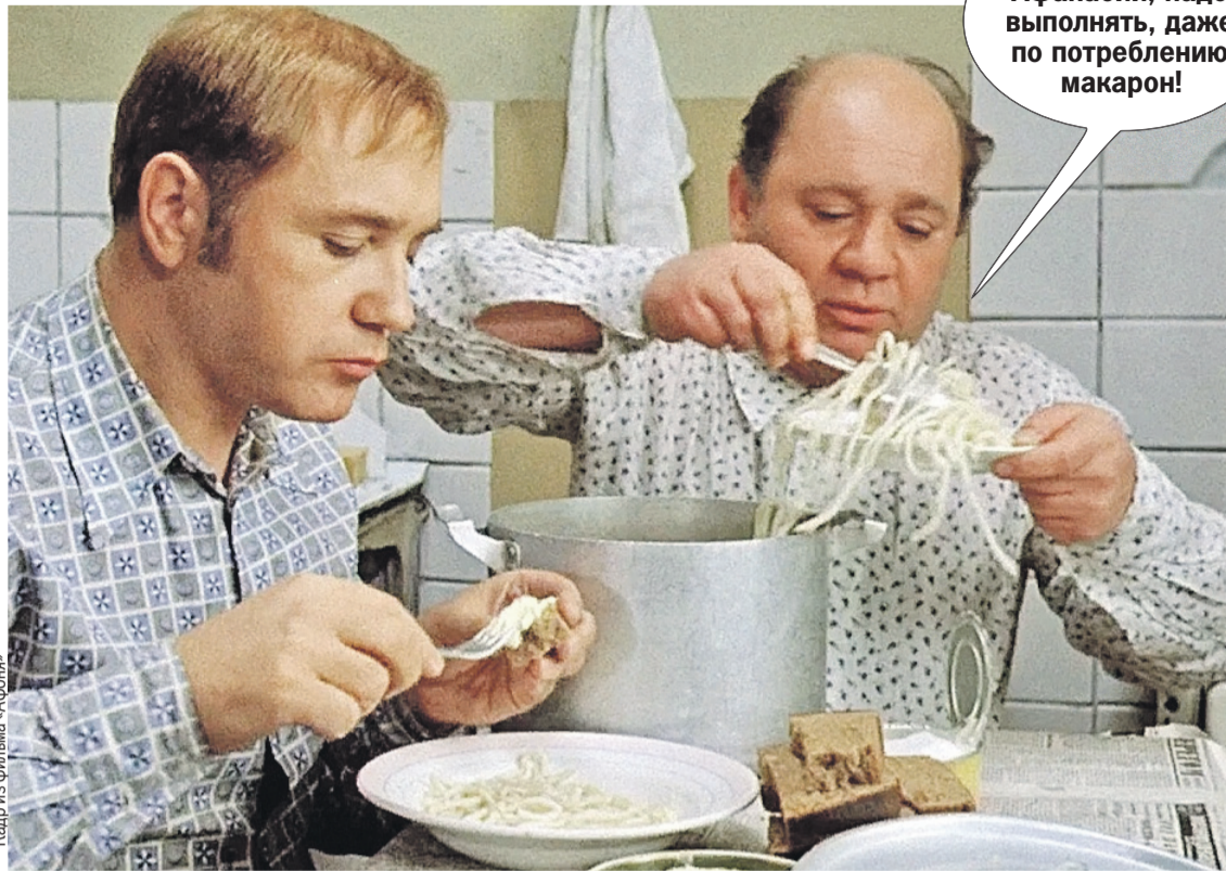
Кадр из фильма «Афоня»