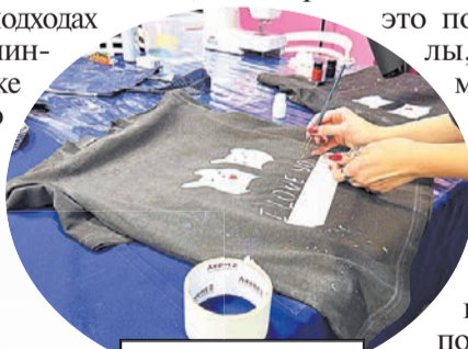
Вдохнуть вторую жизнь в вещи - при желании может каждый.