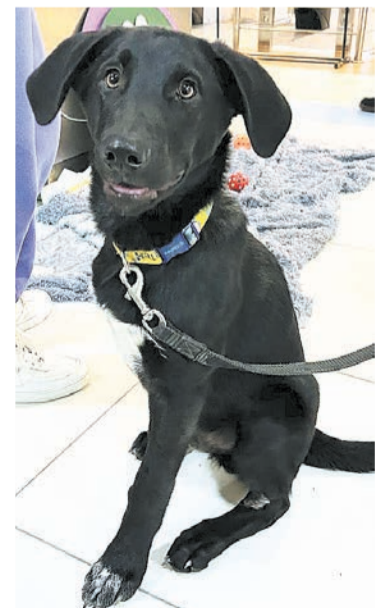
Очаровательному Гном Гномычу ищут любящих хозяев.