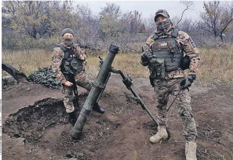
Наши минометчики на берегу Днепра установили свое орудие прямо в воронке. Ведь дважды в одно место не прилетает...

ние - что-то идет не так. Начинают приставать за внешний вид, за форму речи, начали продвигать бандеровщину... Мне это было мерзко. Уехал оттуда, жил в последние годы в Крыму. Я хочу, чтобы мои дети росли в нормальном мире. Поэтому я для себя так решил и поехал воевать.