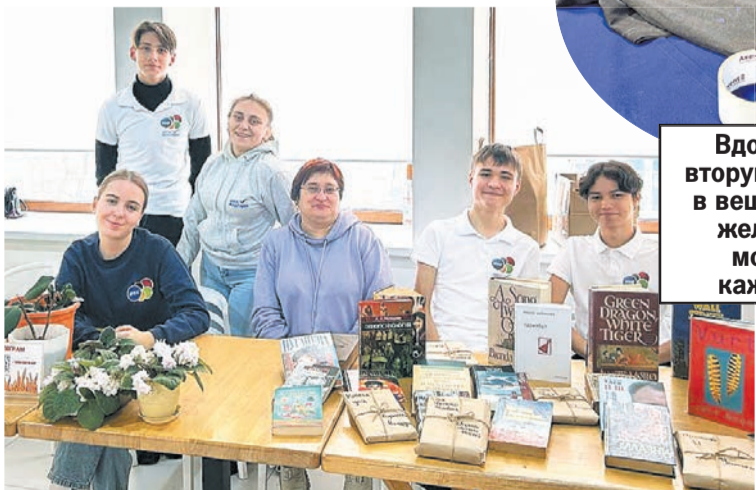
Букскрессинг от школьников.