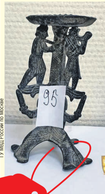
Подсвечник (XI век, Северная Европа) - 776 тысяч рублей.

*Стоимость по заключению комплексной искусствоведческой оценочной экспертизы от 1 ноября 2021 года.