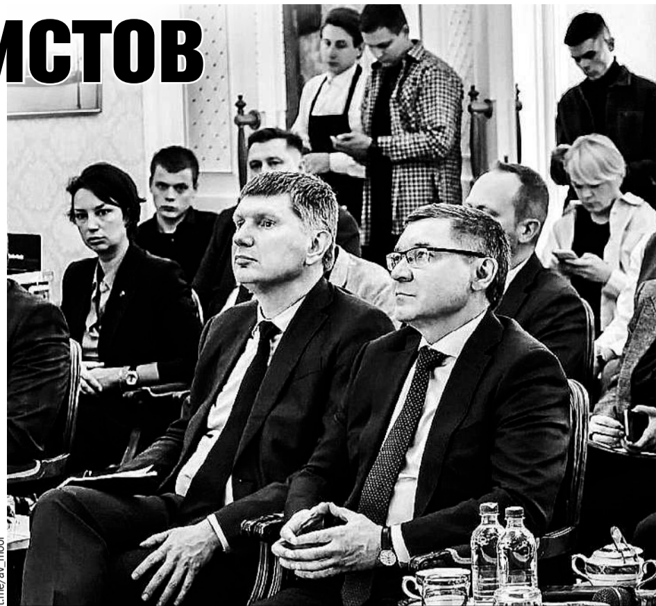
«Нужно помнить, что внутренний туризм - это не социальная сфера, а бизнес», - подчеркнул полпред президента в УрФО Владимир Якушев.

- Важно, что инвестиции растут и в опорные для округа отрасли. Бизнес вкладывается в увеличение добавочной стоимости добывающих производств,