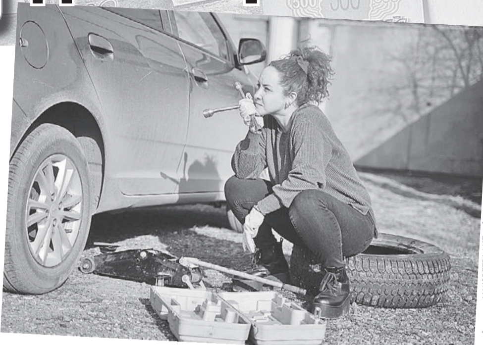
Светлана МАКОВЕВА/«КП» - Самара

- Немецкий премиум фактически хлопнул дверью. Поставка мелких деталей - ремней, прокладок - еще идет. А если речь о штучных вещах (двигатели, лобовые стекла, бамперы, решетки радиатора и т. д. - Ред.), то тут возникают сложности. Ремонт