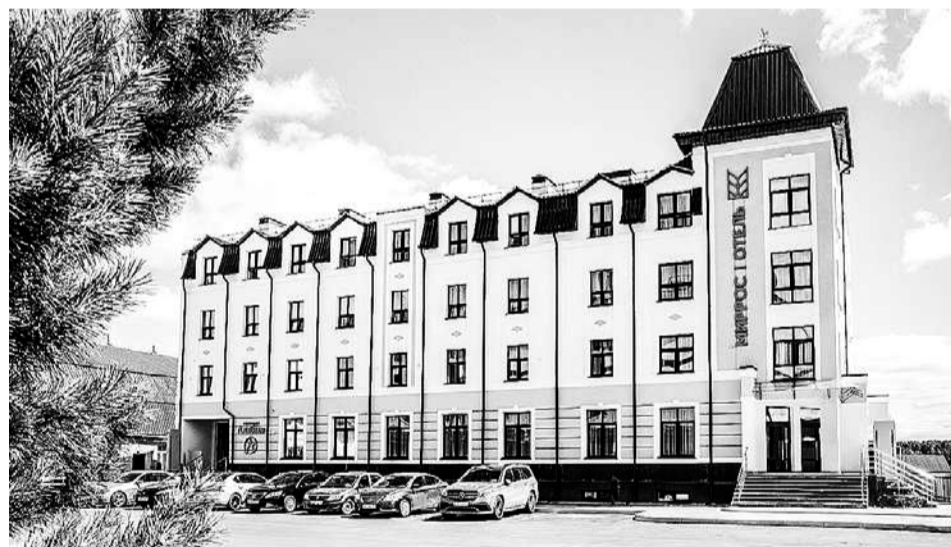
В августе будет запущен новый этап программы льготного кредитования по строительству отелей 3 - 5 звезд.

Отметим, что по итогам 2022 года в Тюменской области количество экспортеров выросло на четверть, а объем экспорта - в полтора раза.