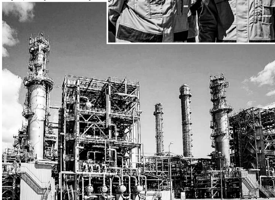
«ЗапСибНефтехим» интересен не только как крупный производственный объект, но и как точка развития промтуризма.