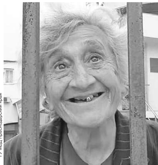
Баба Люся была готова отдать миллион за «заказ».

- 81-летней женщине грозит наказание по двум уголовным статьям - «угроза убийством»