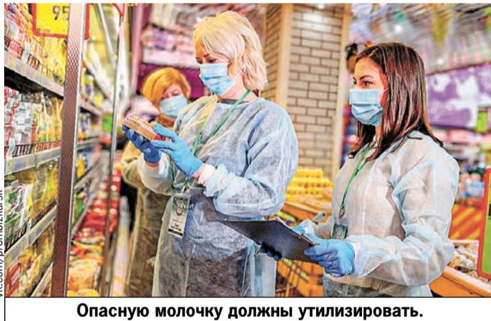
Опасную молочку должны утилизировать.

В Москве провели экспертизу сливочного масла, произведенного на тюменском заводе «Сибирский вкус». Продукция и товар предприятия были признаны некачественными и опасными для употребления. Согласно информации, размещенной на портале ФГИС «Единый реестр проверок» Генпрокуратуры РФ, на самом деле это низкосортный фальсификат с добавлением пальмового масла.