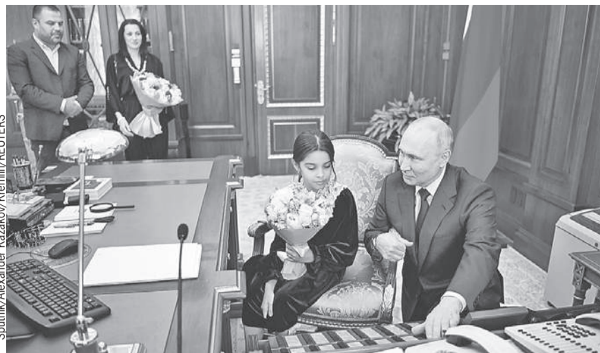
После разговора с премьером Мишустиним Раисат и Владимир Путин позвонили главе Минфина Антону Силуанову. Тот сначала подумал, что это розыгрыш, но потом рассказал, что Дагестану выделено дополнительно 5 миллиардов рублей. Плодотворная поездка вышла у Раисат.

- Мы не могли ее успокоить до глубокой ночи! - рассказал «Комсомолке» папа