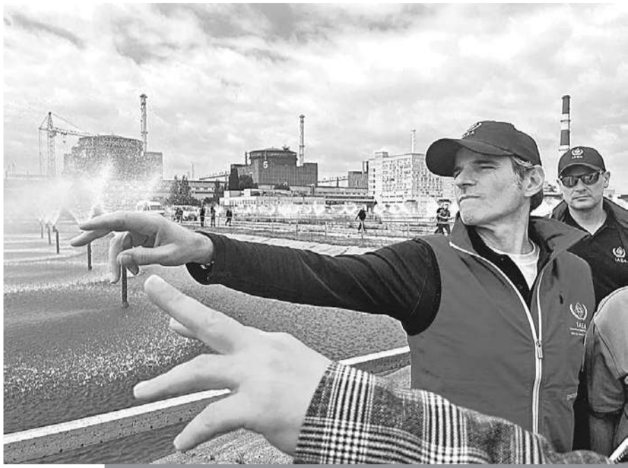
Глава МАГАТЭ Гросси держит постоянный контакт со своими наблюдателями на станции.

Но и у нас есть поддержка. Это глава МАГАТЭ Рафаэль Гросси . Дело в том, что на ЗАЭС постоянно находятся его наблюдатели. Они своими глазами видят, что там на самом деле. И главное,