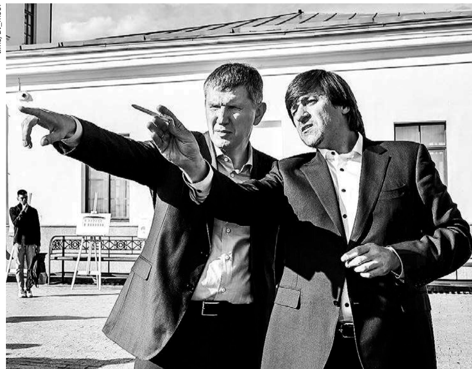
Тобольский архитектурный музей-заповедник увеличил посещаемость в 20 раз - с 39 тысяч человек в 2009 году до более чем 800 тысяч в 2022 году.

мышленности и торговли России Денис Мантуров на совещании по развитию речного судоходства отметил: «Российские верфи комплексно работают над задачей обновления флота для внутреннего судоходства. Сформированы планы строительства до 2035 года, они предполагают передачу эксплуатантам 525 речных судов и класса «река - море», что отвечает перспективной потребности Минтранса».