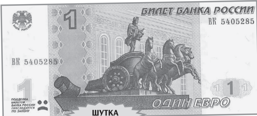
ШУТКА ИЗ ИНТЕРНЕТА

Сейчас все объясним. Но сначала напомним, что рубль потихоньку опускается с прошлой осени - тогда доллар был чуть выше 60 рублей. Однако в последние две-три недели падение ускорилось. Еще два месяца назад доллар стоил 76 рублей, а 6 июля он подскочил до 93. Евро за то же время вырос с 84 до 102 ру-