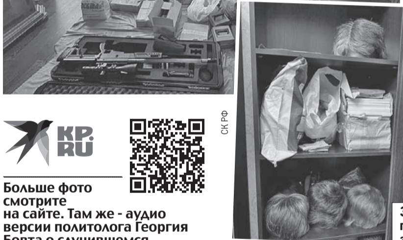
Зачем Пригожину столько париков? Видимо, затем же, зачем и куча паспортов.