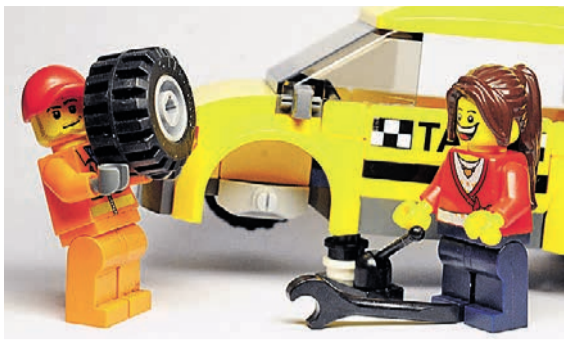
Иван МАКЕЕВ/«КП» - Москва