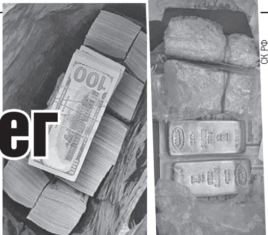
«Джентльменский набор» крупного бизнесмена - слитки золота и пачки денег. Золото, судя по клейму, русское. Купюры - американские. Но есть и рубли - их целый фургон.