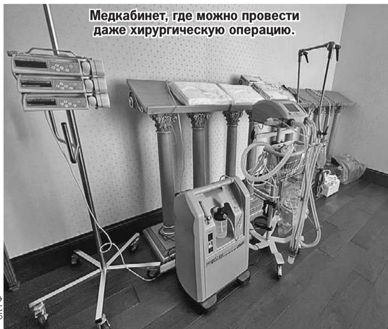
Медкабинет, где можно провести даже хирургическую операцию.