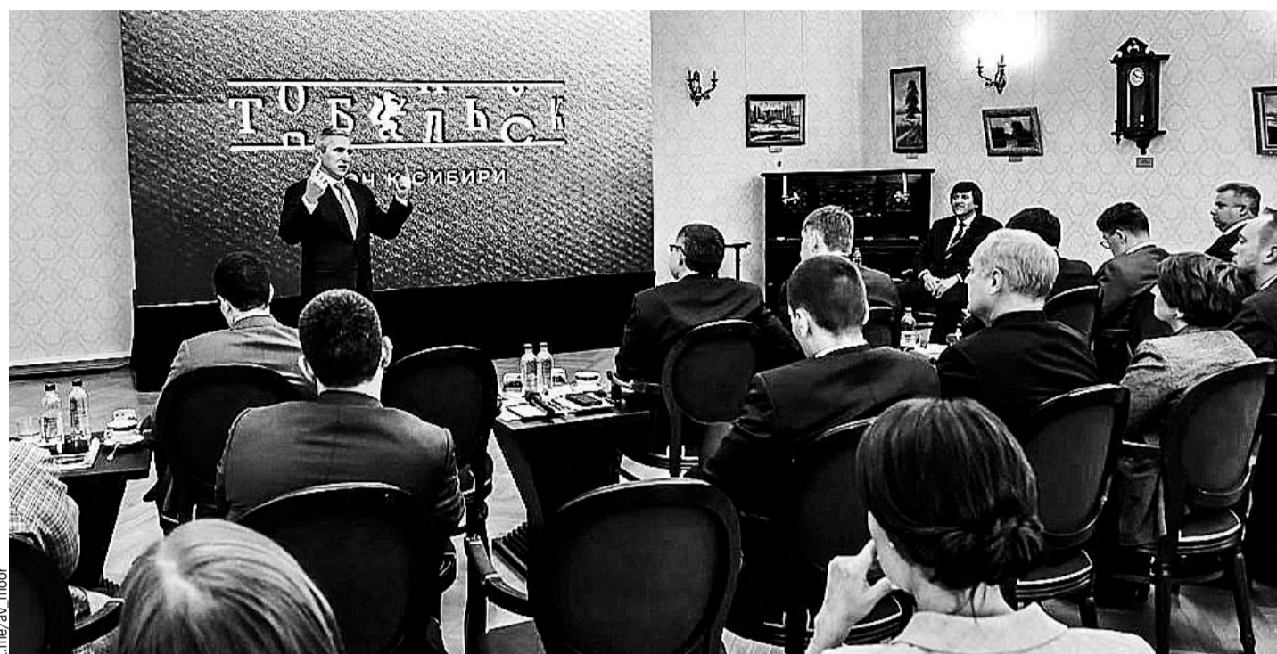
В восстановление инфраструктуры Тобольска и создание центра туризма и культуры Западной Сибири с 2003 года вложено около 20 млрд рублей.

ный зал, проложить рекреационные маршруты и экологические тропы в городских лесах и парке, реставрировать старинные здания в нижнем посаде и разместить там объекты общепита и сервиса.