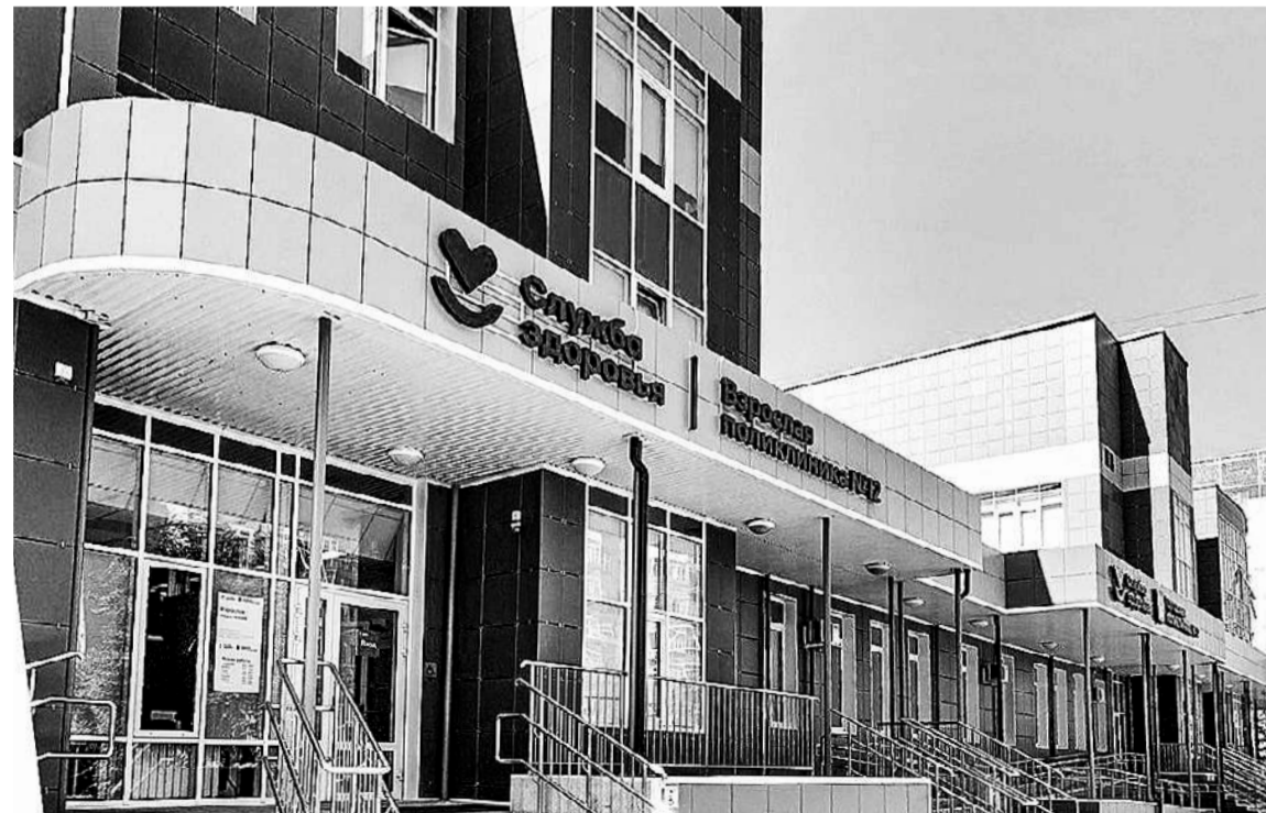
Здесь обслуживается население Восточного административного округа, проживающее в пределах улиц Федюнинского - Пермякова - Широтная - Раушана Абдулина.

- Мы заметили такую особенность у пациентов - низ-