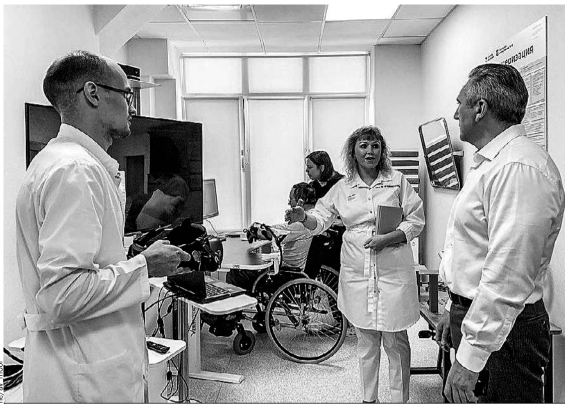
Александр Моор оценил результат капитальной реконструкции здания на улице Пермякова в Тюмени, где сейчас располагается корпус городской поликлиники № 12.

Одно из современных оборудований, которое используют медики поликлиники, - ЭКГ с телеметрией. В оборудовании отечественного производства реализован функционал, который ранее был только в