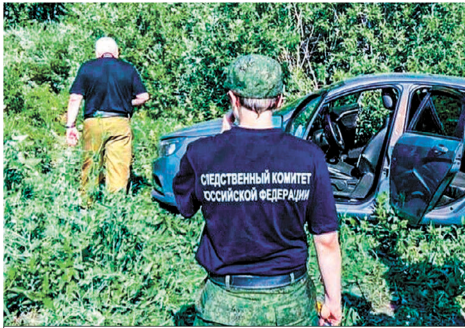
Следователи завели два уголовных дела.

Силовики застрелили мужчину возле объекта нефтегазовой компании.