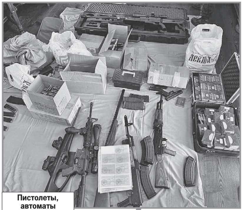
Пистолеты, автоматы Калашникова и штурмовые, снайперские винтовки... С таким арсеналом можно было держать оборону дома хоть год.