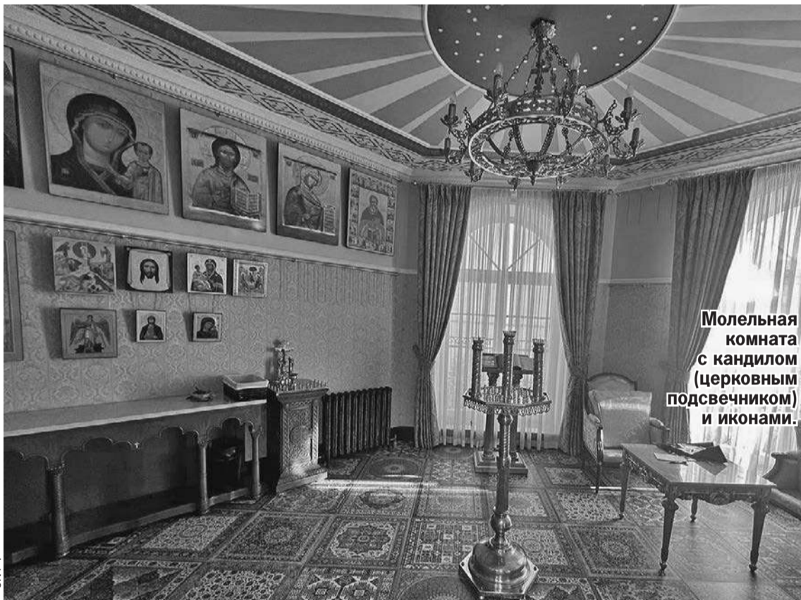
Молельная комната с кандилом (церковным подсвечником) и иконами.

Правоохранители нашли при обыске в доме Пригожина десятки коробок с валютой, рублями, золотыми слитками. А в гараже - целый автофургон, набитый пяти тысячными купюрами. Может, его частная армия просто приходила к нему домой за зарплатой?