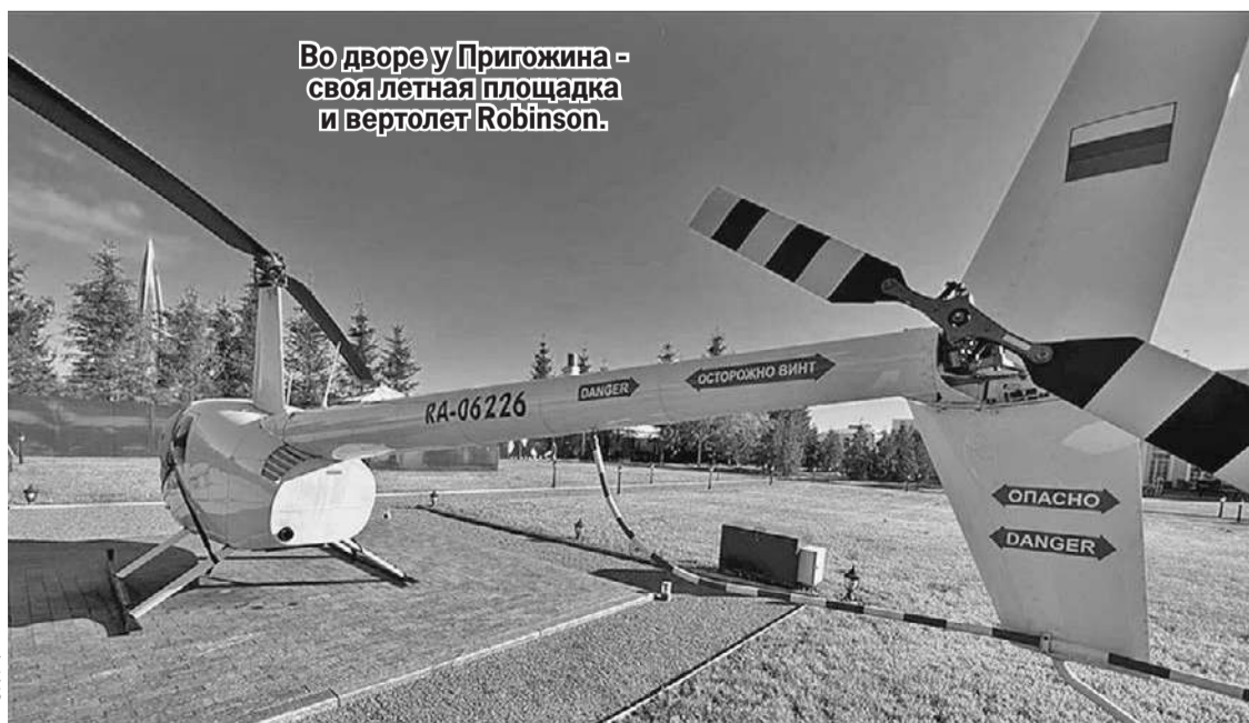
Во дворе у Пригожина - своя летная площадка и вертолет Robinson.