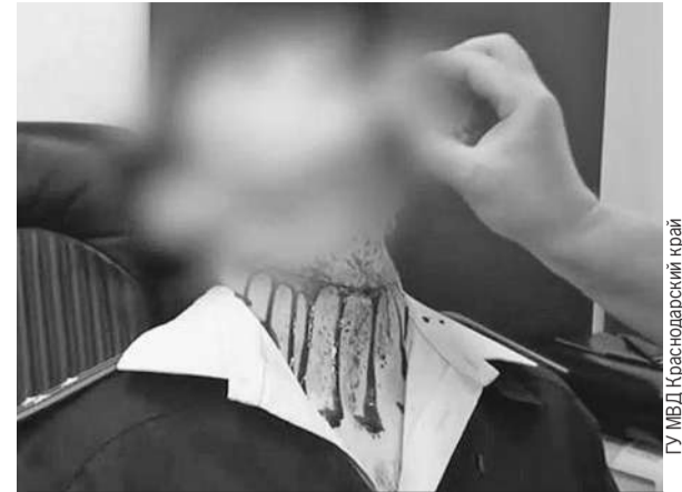
Работа гримеров: все выглядело очень натурально.