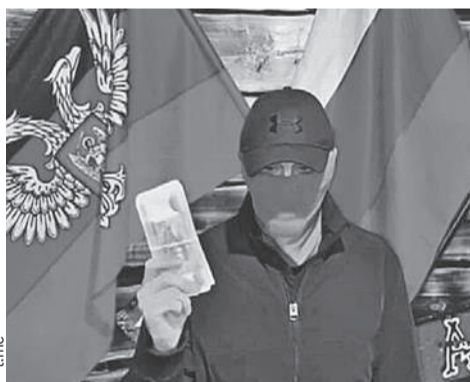
Пачка рублей и боец с позывным «Веном». Лепс из скромности в кадр вставать не стал.

Он сказал бойцу: «Поздравляю!» Но из-за личной скромности сам в кадре появляться не захотел.