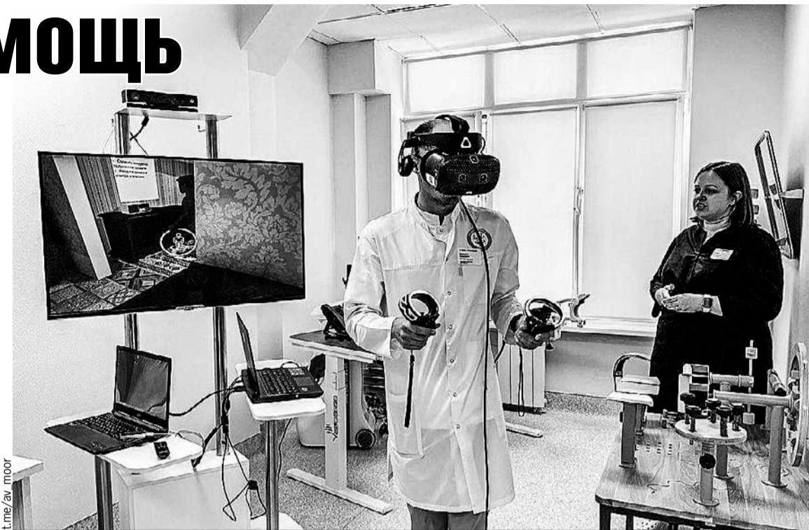
К поликлинике прикреплено порядка 27 000 человек, из них более 18 000 - дети.