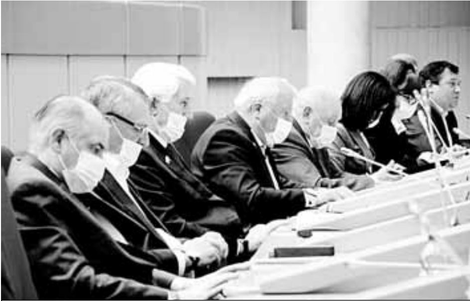
Сразу несколько народных избранников отправились на самоизоляцию из-за коронавируса.