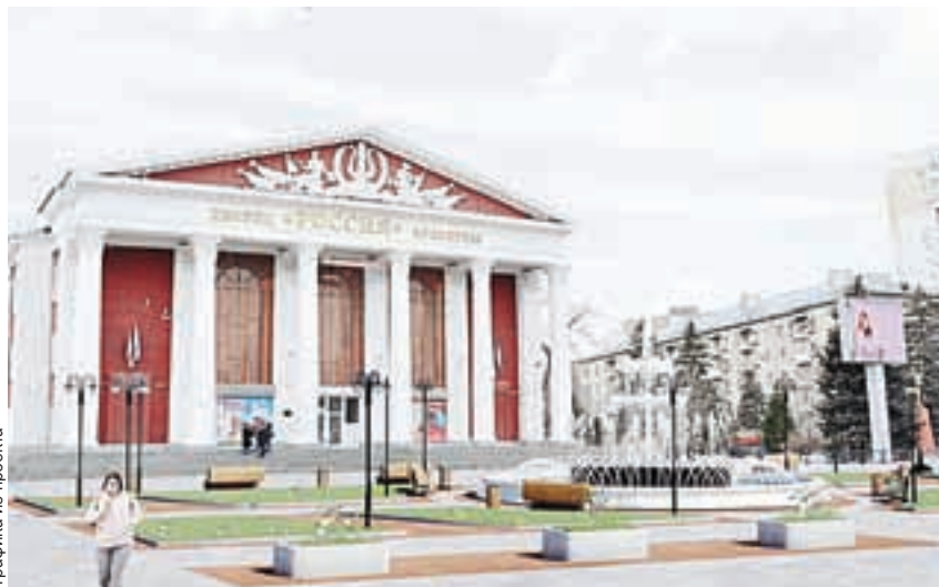
Саратовцы с нетерпением ждут открытия обновленной площади в центре Ленинского района.