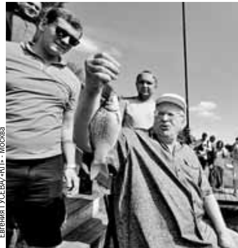
Евгения ГУСЕВА/«КП» - Москва