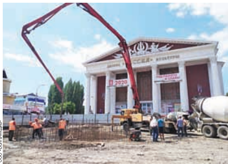
Работы проводятся в рамках национального проекта «Жилье и городская среда».

Замечательный подарок жителям района и города