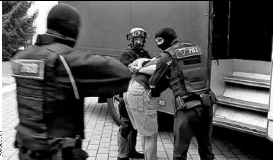
Три десятка российских граждан в санатории под Минском задерживали жестко - как потенциальных «боевиков», хотя они должны были охранять объекты за океаном.