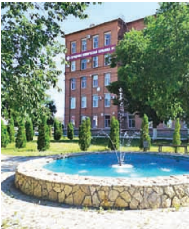
Врач и пациент объединены одной целью, напоминают в ЭГКБ № 1.

ваши помощники в процессе лечения, а не слуги и должники! В ГАУЗ «ЭГКБ № 1» всегда рады своим пациентам и готовы им помочь в скорейшем выздоровлении днем и ночью, в любое время года.