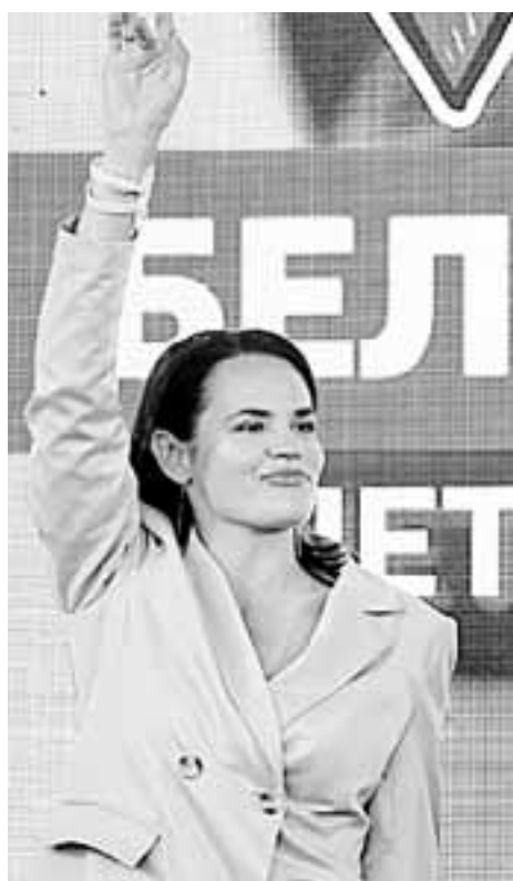
Светлана Тихановская уже собирает в Белоруссии многотысячные митинги, хотя никогда раньше политикой не занималась и в президенты идти не думала.

37-летняя домохозяйка, родившаяся под Брестом, жена арестованного блогера Сергея Тихановского, желавшего участвовать в выборах президента Белоруссии, сегодня Светлана Тихановская - сама претендент на главный пост в стране и собирает многотысячные митинги. Она окончила школу с золотой медалью, в совершенстве владеет английским и немецким, занимается благотворительностью (помощь чернобыльцам).