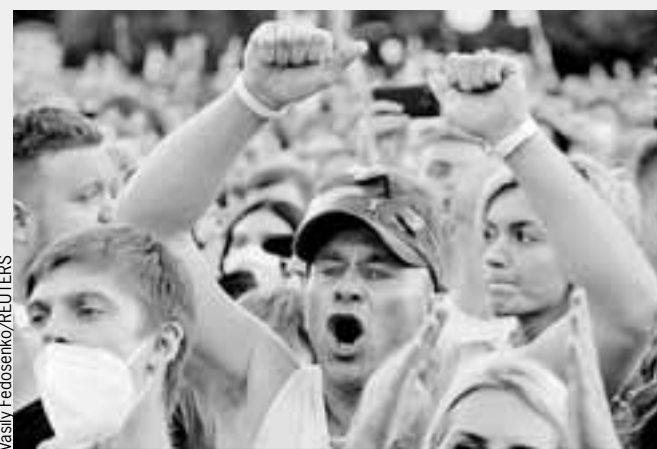
В Минске тысячи людей пришли поддержать кандидатов, оппозиционных действующему президенту страны.