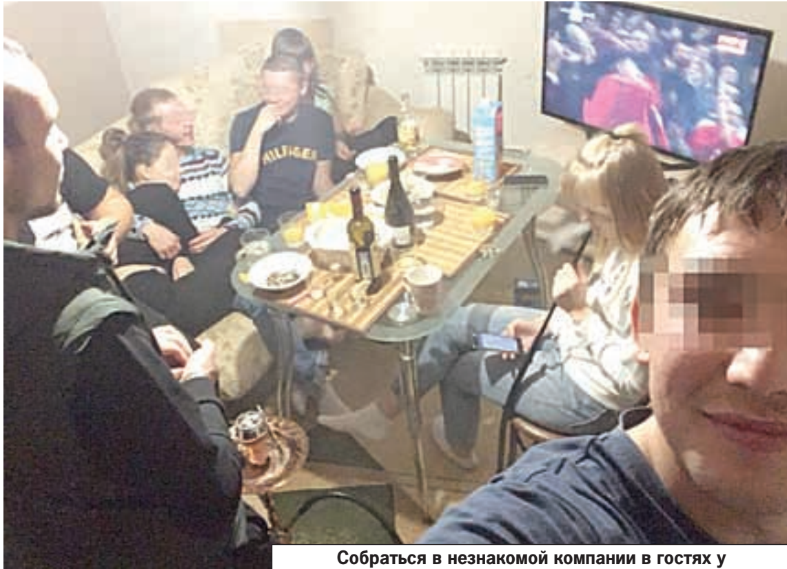
Собораться в незнакомой компании в гостях у неизвестного хозяина - зачастую плохая идея.

чений обычно подыскиваются в Интернете. Социальные сети пестрят тематическими группами. Паблики ранжированы по городам: в Москве и Санкт-Петербурге число вступивших превышает отметку в 150 тысяч человек, а в отдаленных местностях любителей экстремальных встреч собирается едва до 10 тысяч.