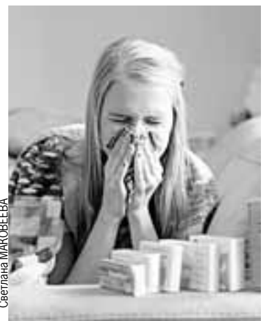
В случае заболевания лучше обратиться к врачу.

Достаточный запас необходимых препаратов сейчас имеется. Об этом заявила начальник комитета организации медицинской помощи взрослому населению Асят Выкова.