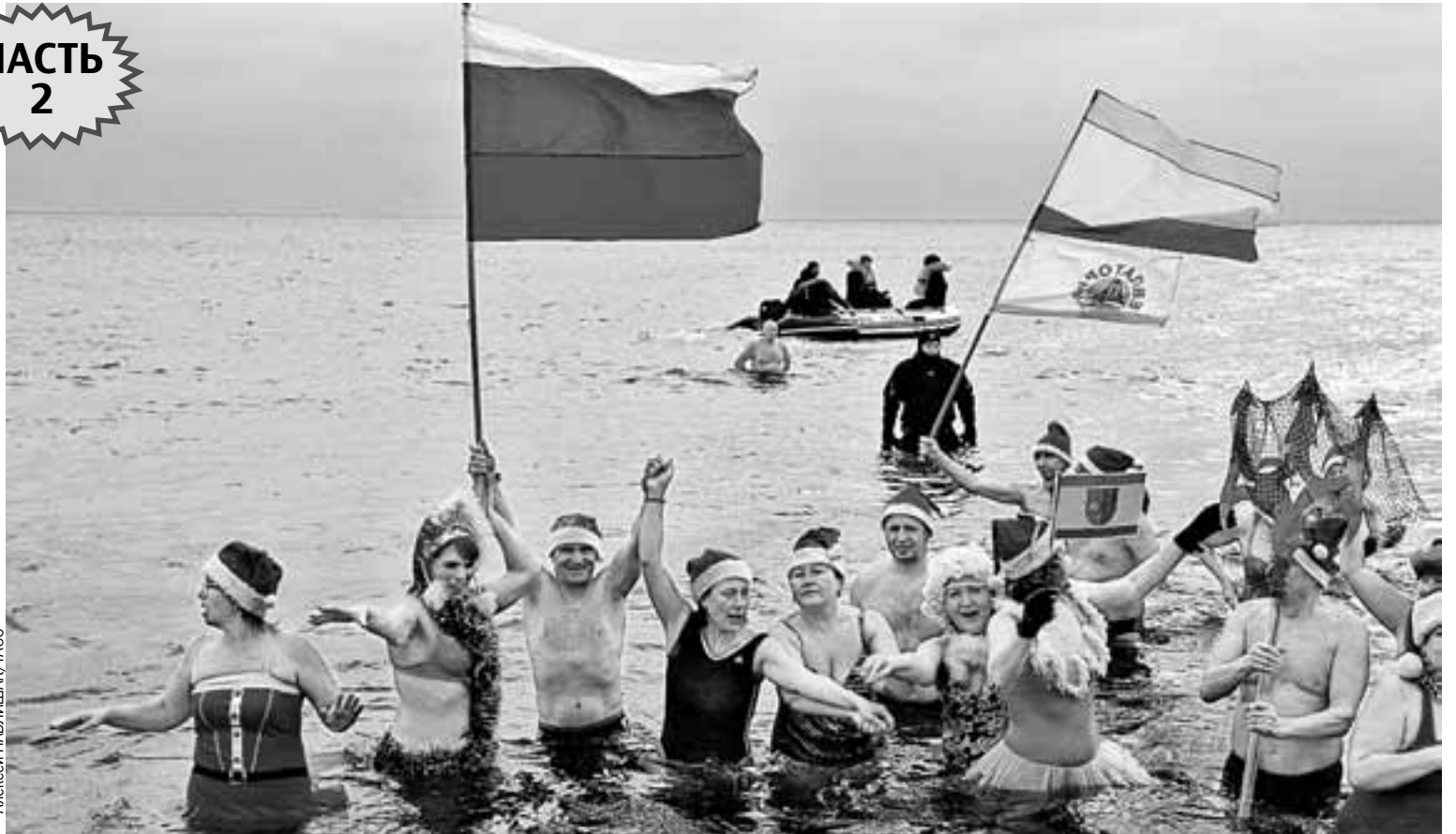
Даже зимний Крым - это прежде всего море! И Россия. Попробуйте переубедить в этом хотя бы вот таких моржей, устроивших новогоднее купание в Крыму с флагами России и Евпатории.

Насладившись этой ЧКХ, я двинулся дальше - под Ялту, где живет еще один патриотиче - русский парень из Петербурга. По зову родины на третий день «крымской