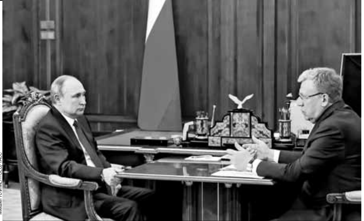
Владимир Путин поручил главе Счетной палаты Алексею Кудрину заняться контролем не только расходов бюджета, но и денег, отпущенных на нацпроекты.

- Это омертвление ресурсов, - заявил он. - Сейчас с правительством дорабатываем предложения по исправлению ситуации. Она уже стала меняться. То есть не просто