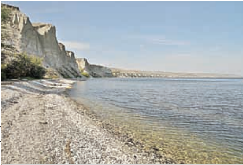
Утес Степана Разина.

На девятом месте Парк Победы в Саратове. Вось-