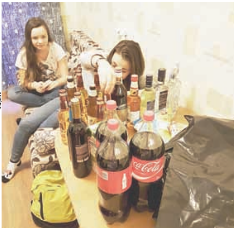
Алкоголь - неизменный атрибут большинства «вписок».

тичная девушка, ищет с кем можно сегодня сходить на движ? Пишите парни 20+-30+, ответу, найду только по комментариям. Желательно Заводской район. Интим и шалости не предлагать.».