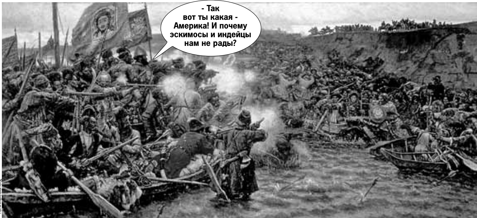
Картина Василия Сурикова «Покорение Сибири Ермаком Тимофеевичем» примерно так выглядит глазами многих школьников.

рассказывают: фараон устремился за ними, и тут море наступило... Точно так же они передают содержание фильма.