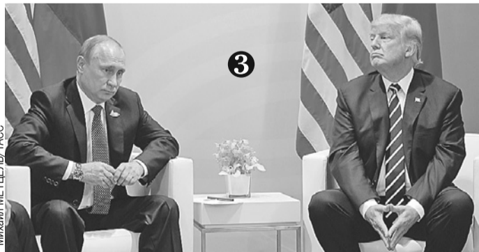
В Гамбурге Трамп сидел точно так же, как и через год в Хельсинки, - скрестив ладони. А вот Путин во время первой встречи еще только оценивал Трампа. В Хельсинки ему было уже все понятно.