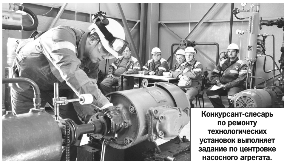
Конкурсант-слесарь по ремонту технологических установок выполняет задание по центровке насосного агрегата.

Работники АО «РНПК», в том числе и сегодняшние победители, неоднократно становились призерами финального этапа корпоративного конкурса «Лучший по профессии». В прошедшем, 2017 году, двое работников привезли 2-е место в номинации «Лаборант химического анализа» и 3-е место в номинации «Приборист контрольно-измерительных приборов и автоматики».