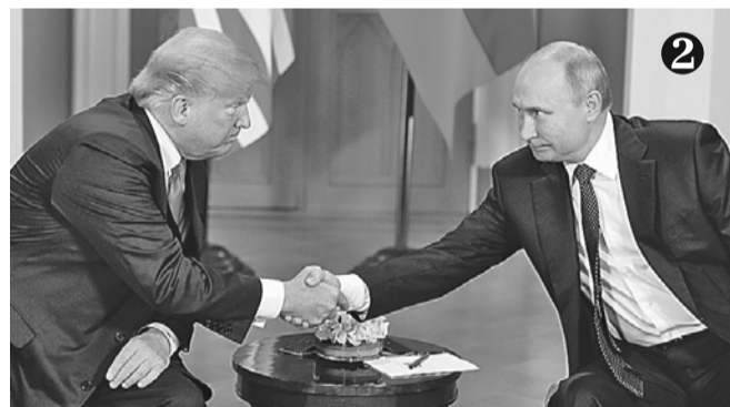
При рукопожатии два президента посмотрели друг другу в глаза. И Трамп подмигнул Путину.