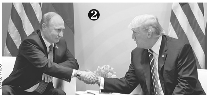
После того как собеседник положит руку в открытую ладонь Трампа, президент США пытается перетянуть ее на себя. Но с Путиным этот трюк не прошел.