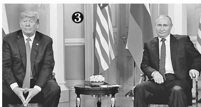
Трамп сидит, скрестив ладони. Но это говорит скорее не о закрытости лидера США, а о готовности быстро «вступить в игру».