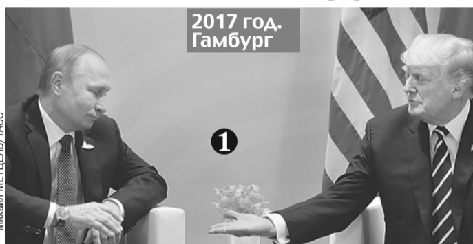
Трамп протягивает Путину руку ладонью вверх, будто говоря: я открыт. Но Путин разгадал этот «фокус».