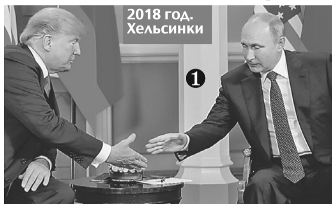
Во время второй встречи Трамп подавал Путину руку уже без открытой ладони. Он учел уроки.

- Судя по всему, они нашли общий язык, - объяснил нам эксперт. - При этом американец все равно общается слегка фамильярно: мол, обсудим по-свойски, но и я свою выгоду упускать не намерен.