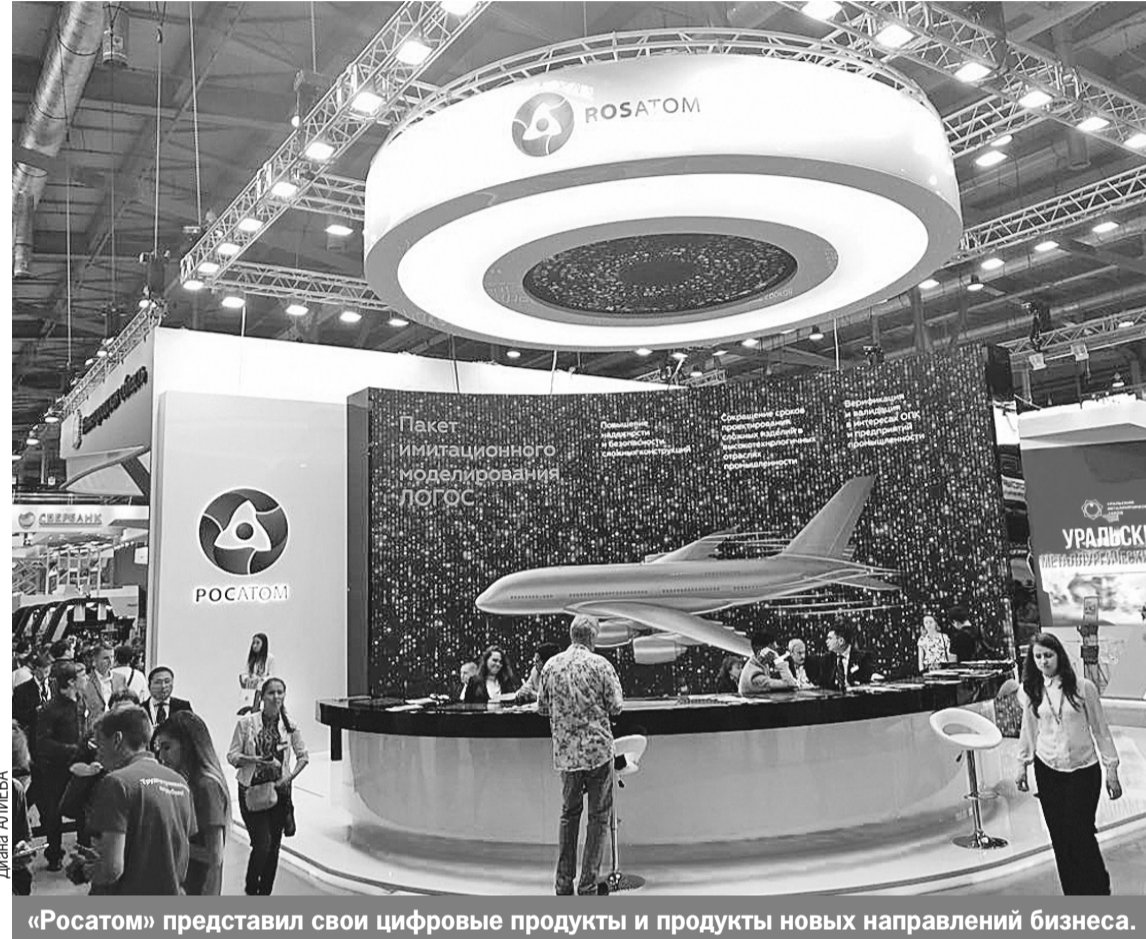
«Росатом» представил свои цифровые продукты и продукты новых направлений бизнеса.

ная для работы с продукцией и документами, имеющими ограничения доступа по типу информации. Система Multi-D - это комплексная цифровая платформа поддержки объектов капитального строительства на полном жизненном цикле, начиная от проектирования и заканчивая сдачей в эксплуатацию.