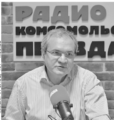
Окончание. Начало на < стр. 1.