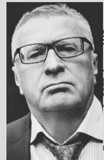
Пресс-служба ЛДПР, Андриис МАТ

Без Москвы эти страны обречены на исчезновение с политической карты мира, а затем растворятся среди соседей их народы.