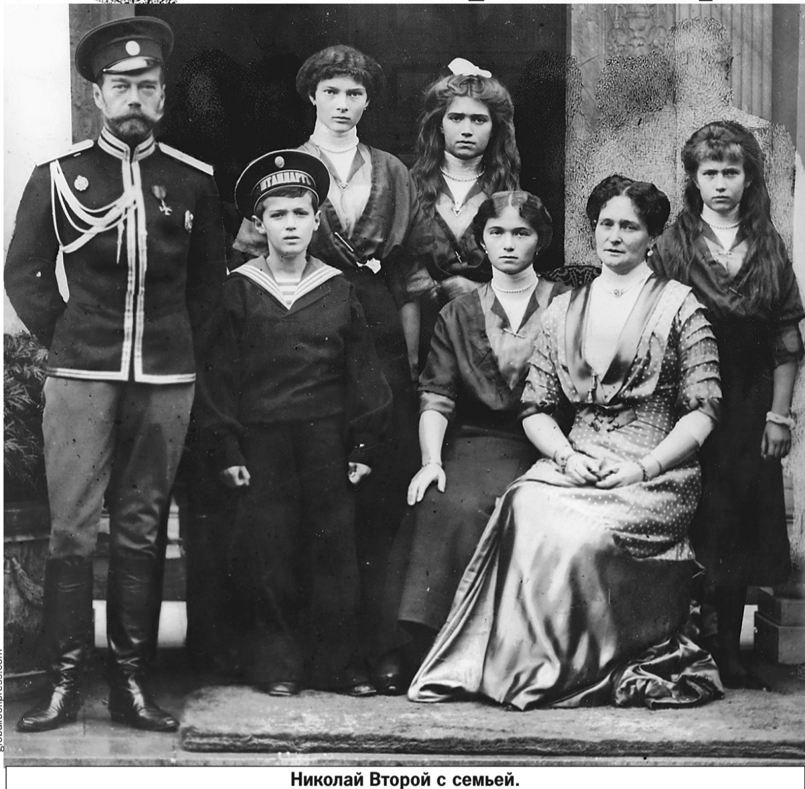
Николай Второй с семьей.