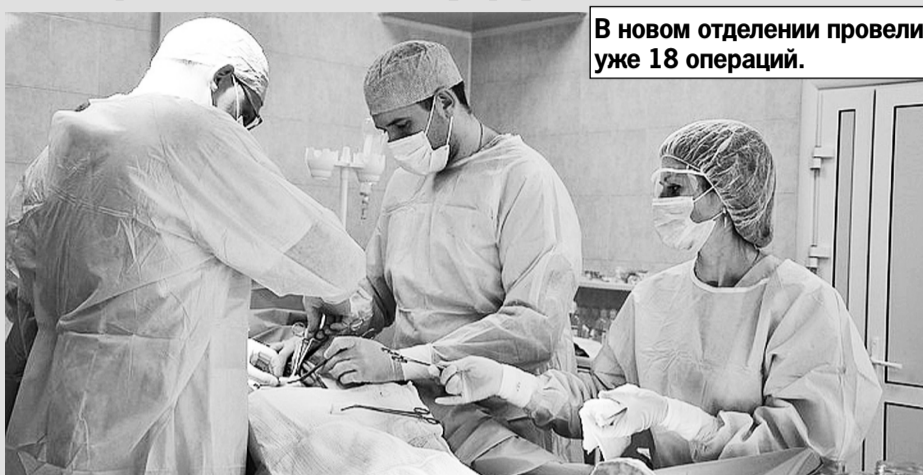
В новом отделении провели уже 18 операций.