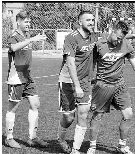
«Азарт групп» празднует победу над «РЖД» и выход в полуфинал.