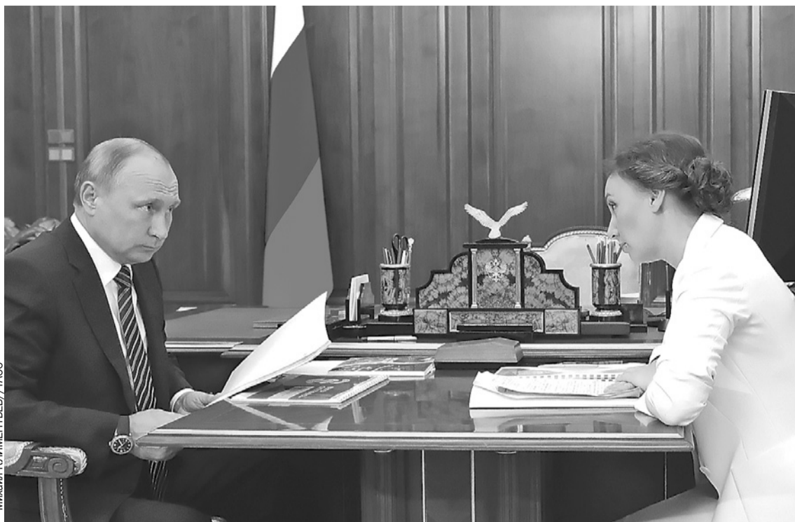
Детский омбудсмен Анна Кузнецова пожаловалась президенту на регионы, где не спешат давать квартиры сиротам, как положено по закону.

- Конечно, мы активно пресекаем эти практики, но система нуждается в серьезном и внимательном изучении. Мы предлагаем переместить зону ответственности за жилищные программы для детей-сирот из системы образования в профильное ведомство, например, Минстрой. Потому что, к сожалению, сейчас нет программ,