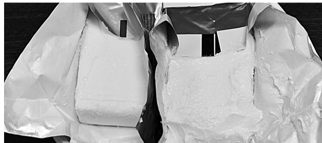
Под брендом завода в продаже поступило масло неизвестного происхождения.