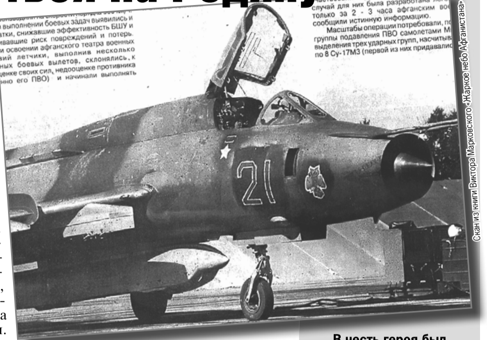
В честь героя был назван этот самолет.