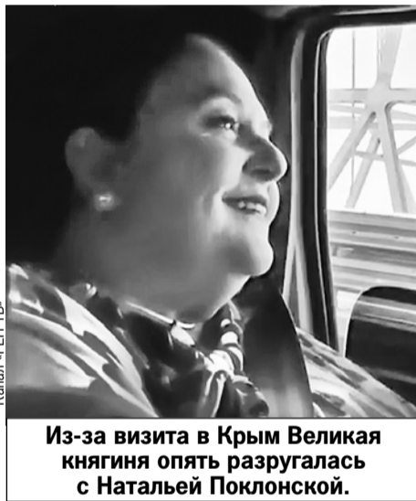
Канал «РЕН ТВ»

Путешествие им явно понравилось. А вот кое-кому нет. Депутат Госдумы и экс-прокурор Крыма На-