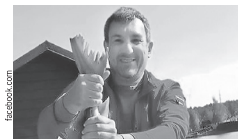
И. о. губернатора Амурской области Василий Орлов еще и рыбак.