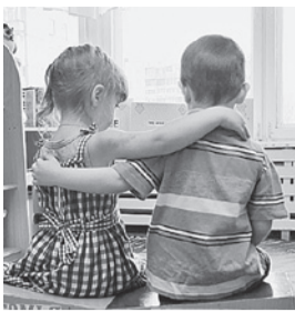
Олег УКОЛОВ/«КП» - Барнаул

Правда ли, что органы опеки забирают детей из нормальных семей, чтобы их продать Читайте на > стр. 12 - 13.