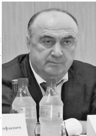
Главное бюро медико-социальной экспертизы Дагестана

В маленьком горном селе Гиндиб в четверг было необыкновеннолюдно. Почти все 300 жителей высыпали из домов поглазеть на кортеж из автомобилей с мигалками. ФСБ, полиция, Следственный комитет - на единственной сельской улице припарковалось аж два десятка машин. Люди в камуфляже с автоматами наперевес, как выяснилось - погоня за большим чиновником, уроженцем Гиндиба Магомедом Махачевым. Этот депутат и одновременно глава республиканского бюро медико-социальной экспертизы (организация, выдающая справки об инвалидности) сбежал от силовиков не зря. Ему вменяют сразу несколько тяжких уголовных статей: «создание преступного сообщества с использованием служебного положения», «мошенничество в особо крупном размере», «служебный подлог», «участие в преступном сообществе», «получение взятки организованной группой». А на деле под этими казенными формулировками скрывается тщательно продуманный и о-о-очень прибыльный бизнес.