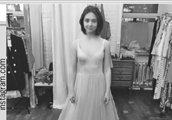
ФОТО «Пуговка выросла»: звезда «Папиных дочек» похвасталась платьем на выпускной

ТЕЛЕВИЗОР Читатели «КП» выбирают главный телевизионный скандал года