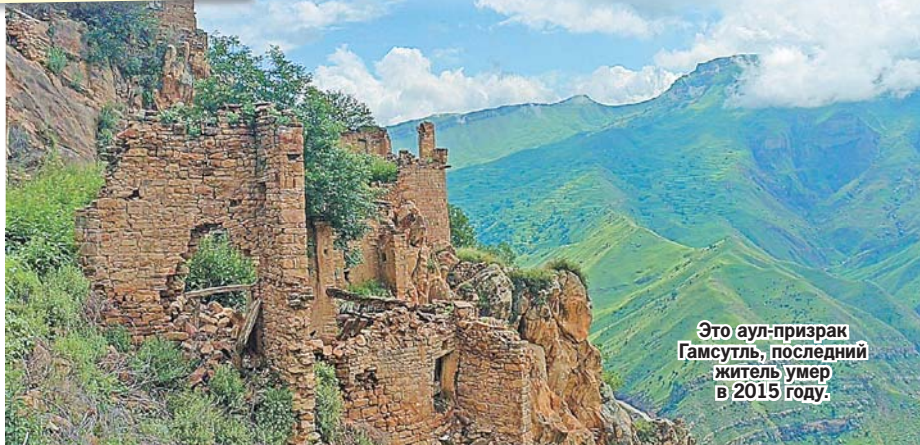
Это аул-призрак Гамсутль, последний житель умер в 2015 году.

Обязательно посетите самую известную достопримечательность Дербента - вековую крепость Нарын-Кала. Мы объединились с тремя туристами и прямо у входа купили услуги гида - 2500 за всех.