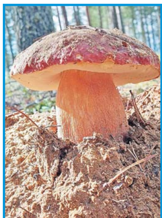
Такой гриб весом в килограмм нашел житель Нижнего.

И из знаменитого Тагайского леса ульяновцы повезли корзинки с белыми. В паре десятков километров от Тагая, неподалеку от Прислонихи грибники начали собирать кроме боровиков лисички, польские грибы, маслята, моховики, дубовики. За лисичками грибники едут также и в Базарносызганский район.