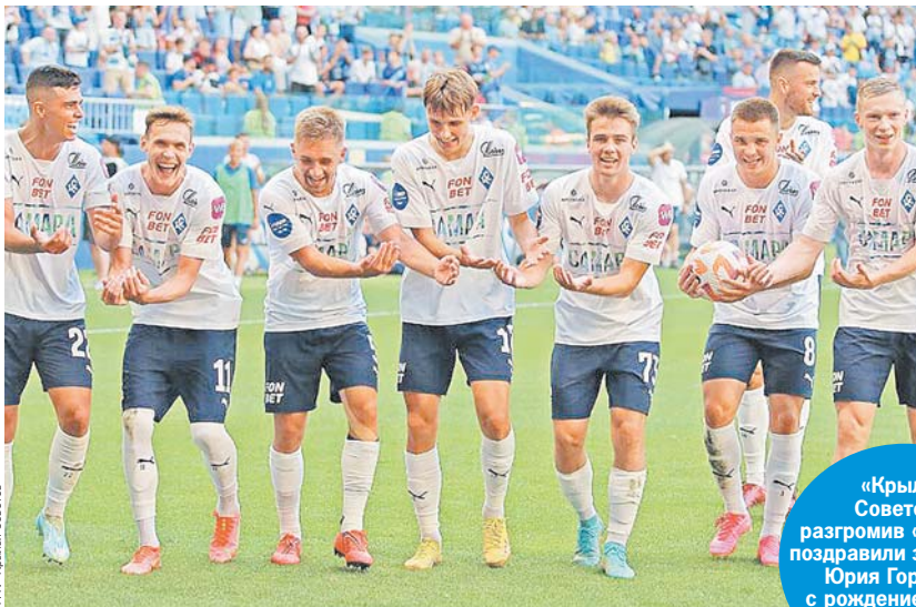
ФК «Крылья Советов»

Голкипер ростовчан Песьяков, в свою очередь, выпустил мяч из рук во втором тайме после прострела Бейла. Это позволило открыть счет своим