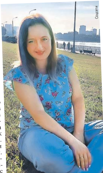
Такая учительница и автобус «на скаку» остановит!

Вдохновленные героизмом учительницы ребята в красках расписали ее подвиг родным и обратились к губернатору Алексею Дюмину с просьбой наградить молодую женщину. Глава Тульской области сообщил, что вручит ей медаль «Честь и мужество».