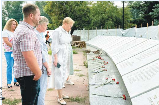
Реконструкция и обновление объектов находятся на контроле администрации Самары.