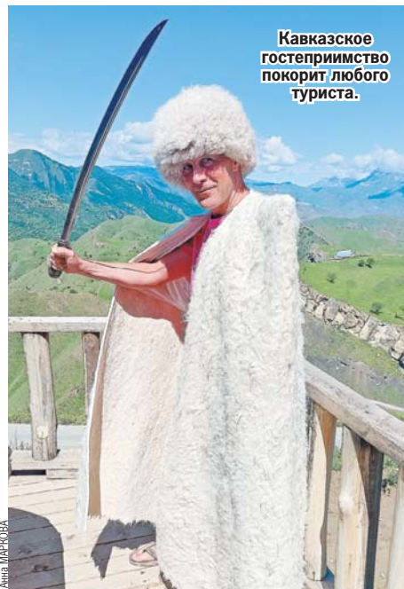
Кавказское гостеприимство покорило любого туриста.

Не забудьте перед отъездом сходить на местный базар и купить с собой орехи, сухофрукты, сыры, вяленые колбасы, сборы горных трав, вкуснейшие урбечи, соленую рыбу.