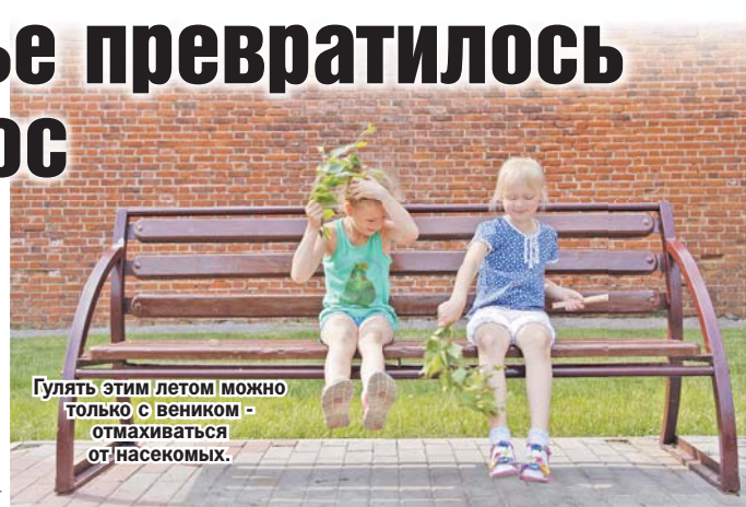
Гулять этим летом можно только с веником - отмахиваться от насекомых.