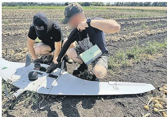
Беспилотный летательный аппарат «Суперкам» передает картинку за десятки километров.

- Это такая штука, от которой не убежишь и не спрячешься - ни в окопе, ни в блиндаже. По технике артиллерия с первого раза не попадет, а здесь - гарантированное поражение. Машину догнать даже на высокой скорости - нет проблем. У противника тоже такие дроны хорошо развиты. Одно время мы от них серьезно отстава-