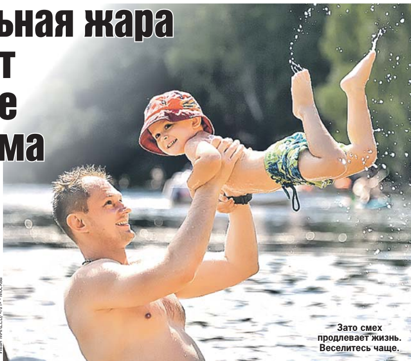
Зато смех продлевает жизнь. Веселитесь чаще.

- Денатурированные белки свиваются в нерастворимые агрегаты, снижая жизнеспособность клеток, - рассказывает профессор Москалев. - Подобные процессы, только медленно, развиваются у лю-