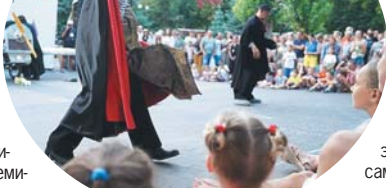
Фестиваль собрал сотни зрителей.