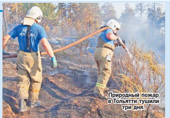
Природный пожар в Тольятти тушили три дня.

А после обеда очевидцы сообщили о новом пожаре - на Поволжском шоссе в Комсомольском районе. Горела сухая трава, дым затянул железнодорожное полот-