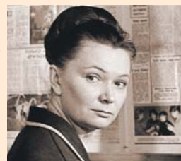
Кадр из фильма

В карьере Нины Евгеньевны было множество ярких работ - Вера из «Девчат», Нина из «Битвы в пути», но, пожалуй, самой известной ролью народной артистки РСФСР стала завуч Светлана Михайловна из «Доживем до понедельника». Сложный образ немолодой строгой дамы, зажатой в тиски ею самой установленных правил и терзаемой любовью к герою Тихонова, стал одним из самых точных и ярких в фильме. И это неудивительно, ведь Нина Евгеньевна была женой Станислава Ростоцкого и отлично понимала, чего от нее хочет режиссер, с которым она прожила много лет и воспитала сына Андрея, известного актера и режиссера, увы, трагически погибшего в 45 лет. Сама Нина Евгеньевна ушла на 80-м году жизни, но зрители, конечно же, продолжают помнить прекрасную артистку.