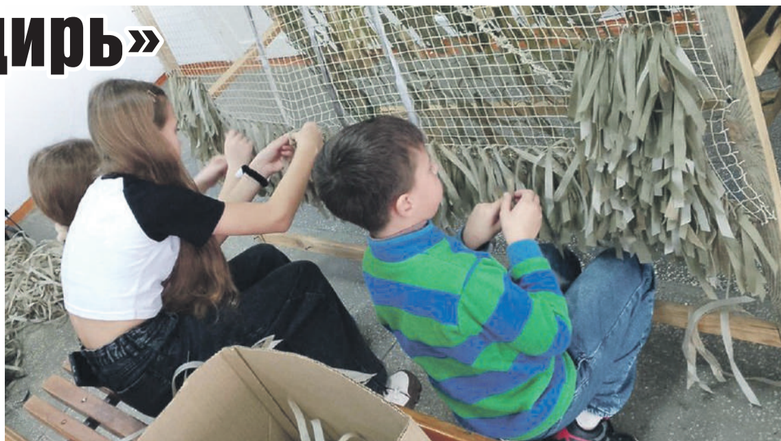
«Все для Победы»

- Мы работаем на базе школы, в свободных помещениях, которые удобно использовать для размещения материалов, в том числе для выкройки изделий и сетей. Многие наши единомышленники работают на дому, выполняют нарезку ткани и материалов, плетут, вяжут,