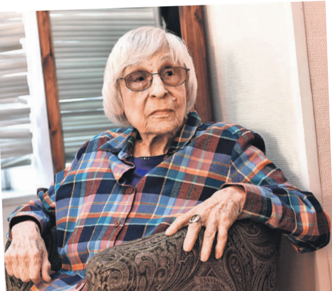
Юнна Мориц всегда поддерживала наших воинов и словом, и делом.

Бойцы поблагодарили Юнну Мориц за дрон и передали ей поэтический привет. Воин с позывным «Турист» (на фото - справа) прочитал ей свой стих.