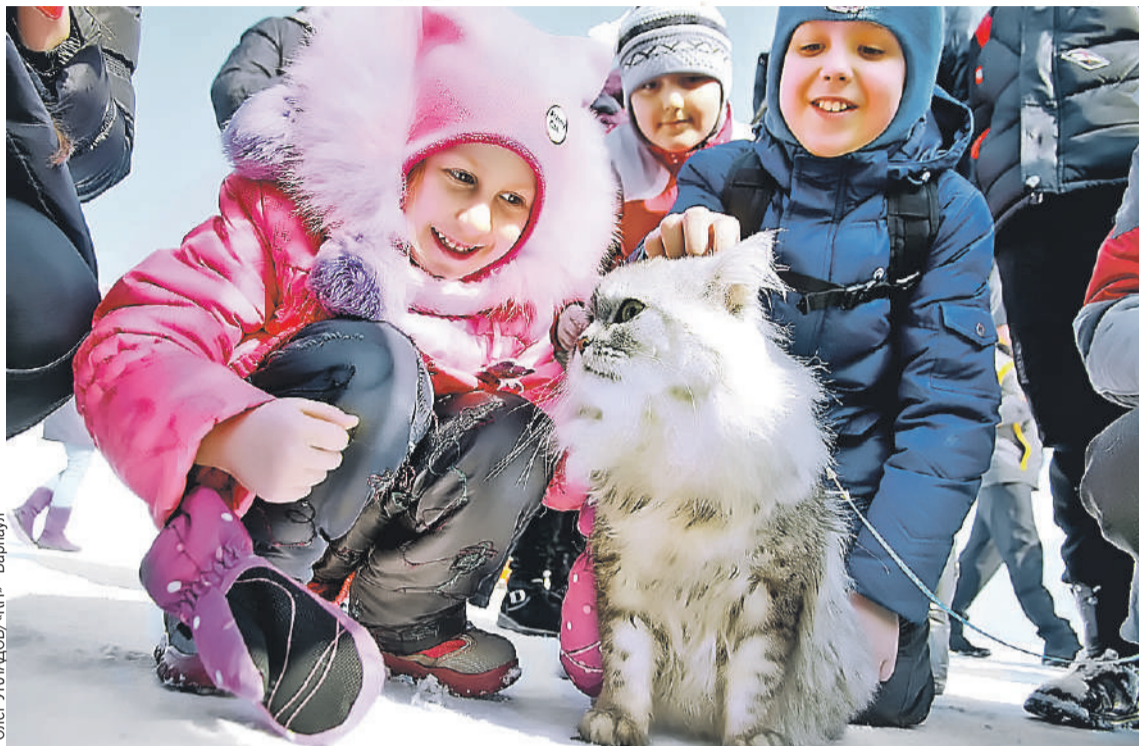
Домашние животные - отличная профилактика аллергии с пеленок!