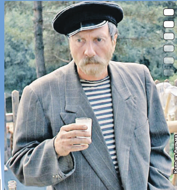
И, конечно, дед Митяй в народной комедии «Любовь и голуби» (1984).