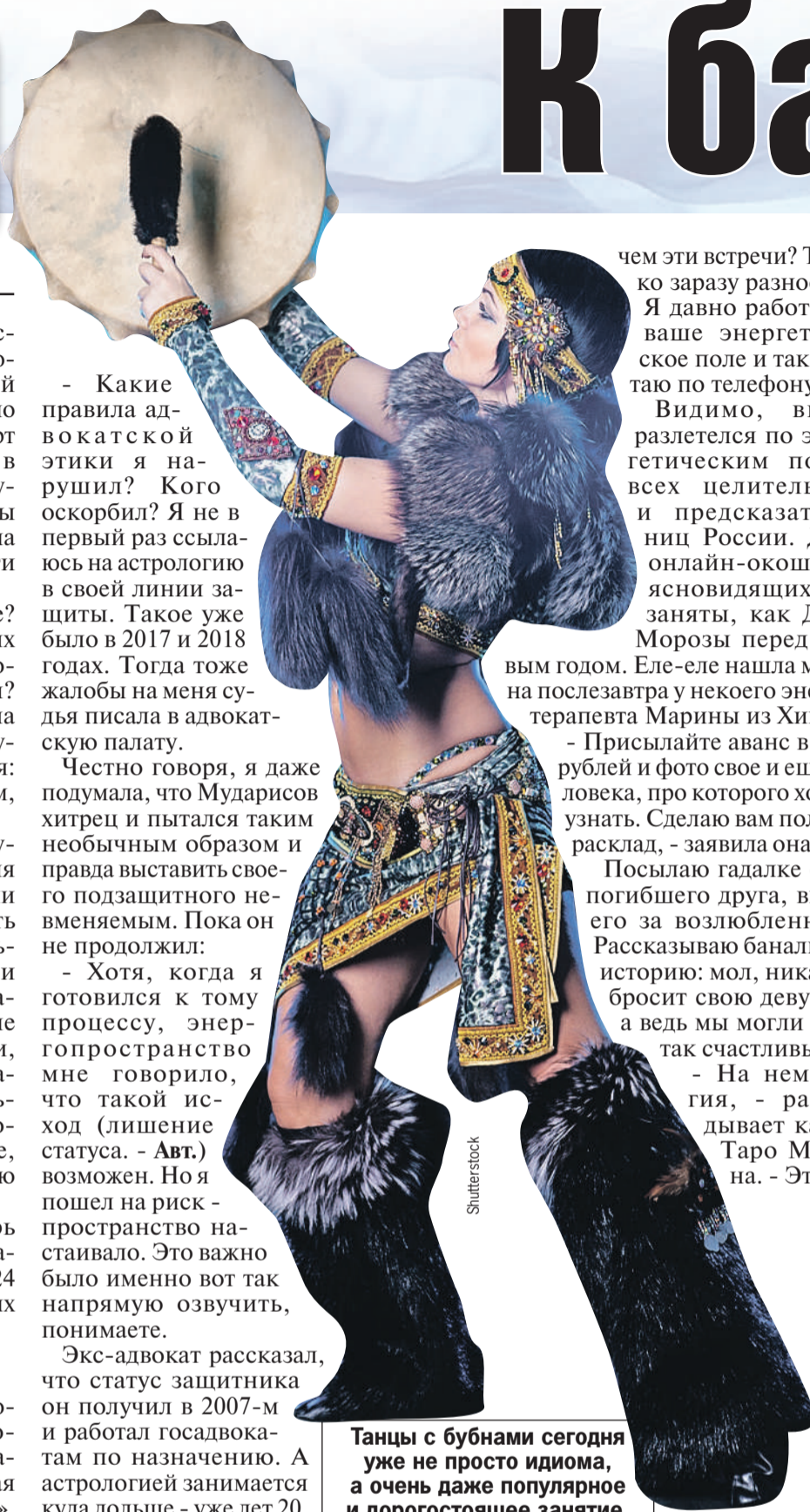
Танцы с бубнами сегодня уже не просто идиома, а очень даже популярное и дорогостоящее занятие.

чем эти встречи? Только сразу разносить. Я давно работаю и ваше энергетическое поле и так считую по телефону».