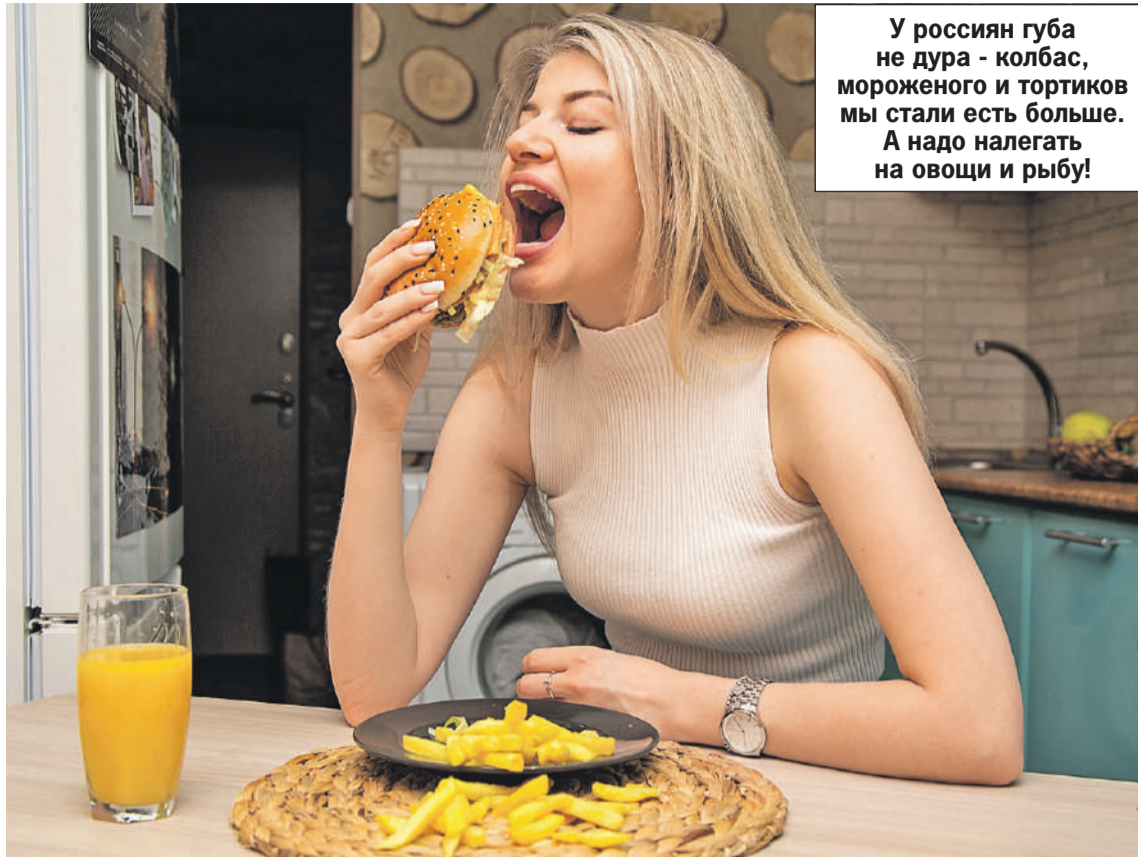
Оксана ЗУЙКО/«КП» - Москва

В целом, как говорят эксперты, это можно считать признаком роста благосостояния. Или как минимум стабильности. В кризисные годы люди выбирают более доступные продукты - крупы, хлеб и т. д., сокращая расходы на питание. А в стабильные растет спрос на мясо, рыбу, овощи и фрукты.