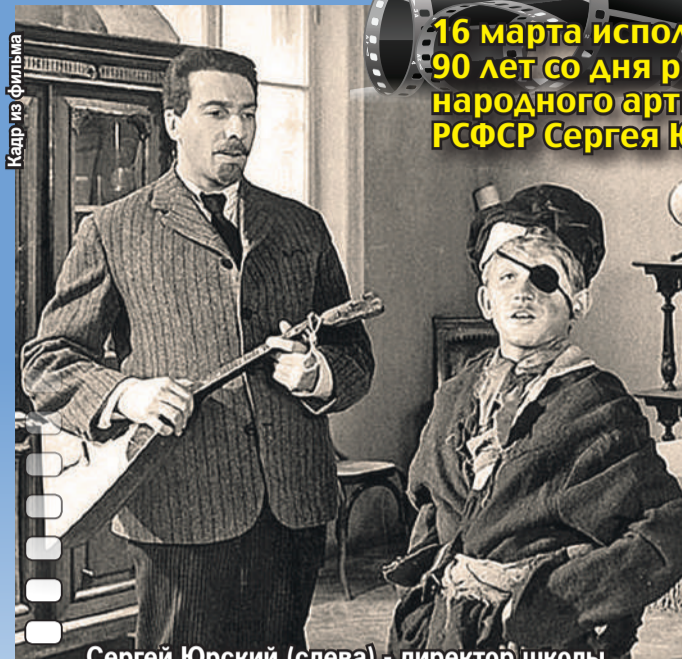
Сергей Юрский (слева) - директор школы для беспризорников в «Республике ШКИД» (1966).

16 марта исполнилось 90 лет со дня рождения народного артиста РСФСР Сергея Юрского.