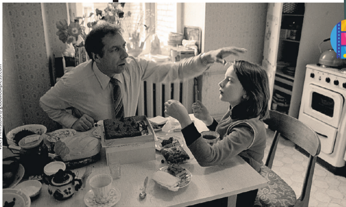
Сергей Юрьевич с дочкой Дашей. Сейчас Дарья Юрская - актриса МХТ им. Чехова, заслуженная артистка России.