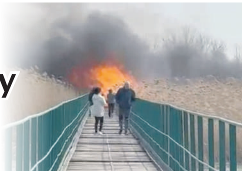
Архив Ирины Лысенко