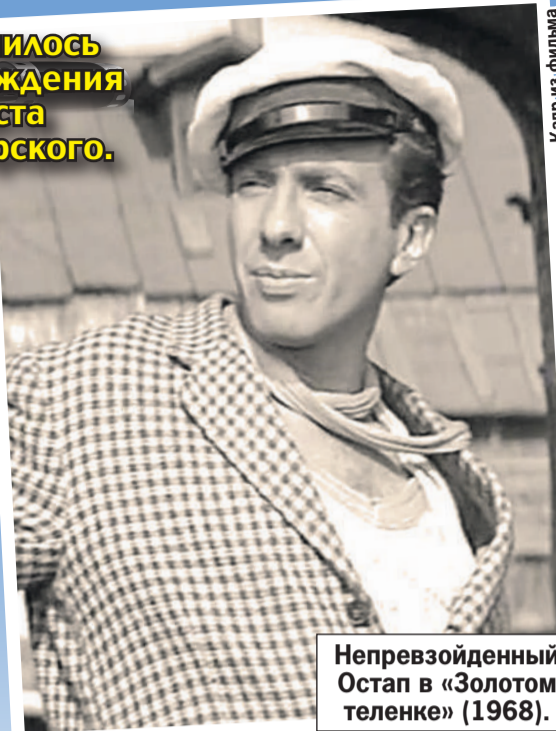
Непревзойденный Остап в «Золотом теленке» (1968).

16 марта исполнилось 90 лет со дня рождения народного артиста РСФСР Сергея Юрского.