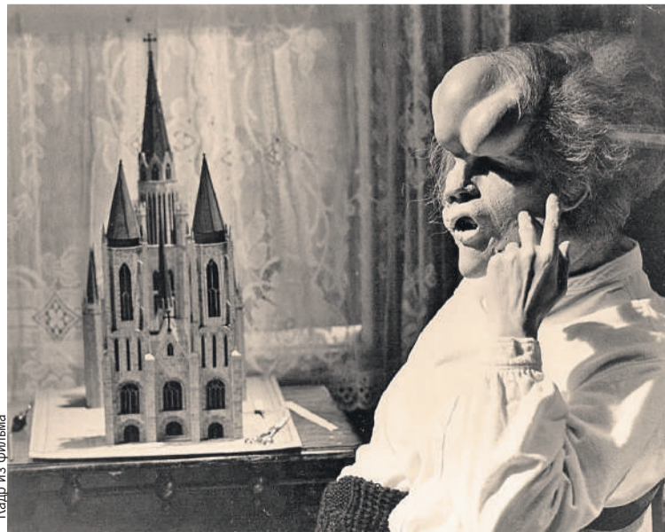
Линч не только выступил режиссером, но и участвовал в написании сценария фильма «Человек-слон» (1980).

«Человек-слон», вполне традиционная и глубоко трагическая история, стал большим хитом и получил 8 номинаций на «Оскар». Для Линча открылась дорога в Голливуд. Джордж Лукас уговаривал его поставить «Возвращение джедая»,