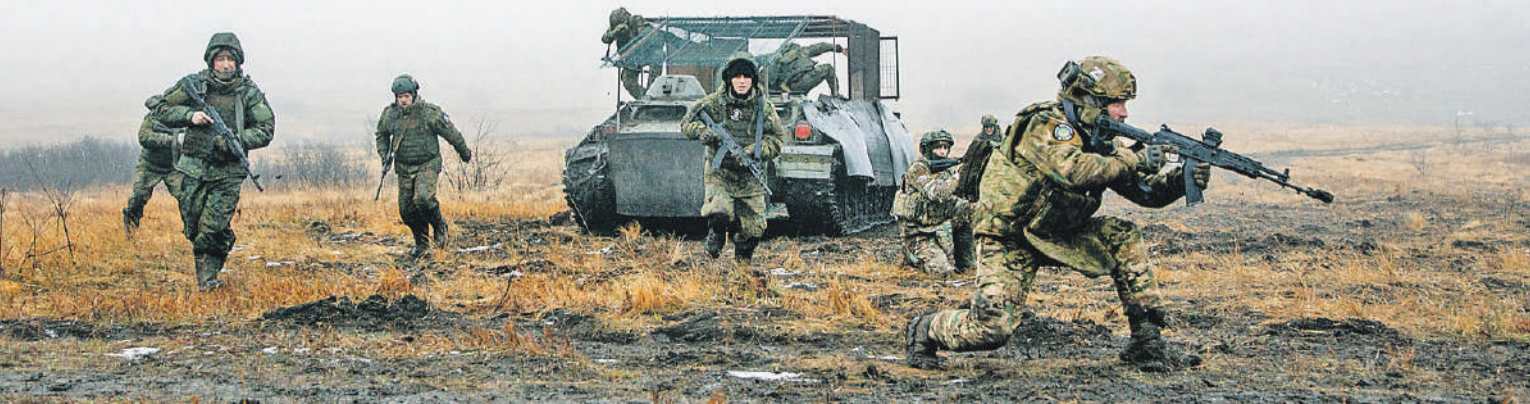
Высаживаться с брони тоже надо уметь - здесь каждый элемент отрабатывают до автоматизма. Если надо, и по 50 раз.

А на медплощадке мне наматывают жгуты бойцы с позывными «Свят» и «Демон». Случайно или нет, но у «Свята» жгут белый, а у «Демона» темно-красный.