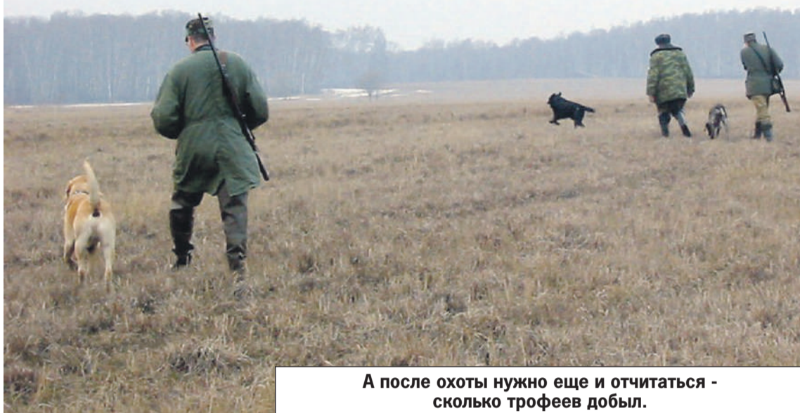
А после охоты нужно еще и отчитаться - сколько трофеев добыл.

Однако охотиться круглый год на дичь нельзя. Например, на перепелок и куропаток можно ходить с августа по январь. На волков и шакалов можно охотиться всего два месяца. И чтобы выйти с ружьем в лес, нужно заплатить (см. таблицу цен).