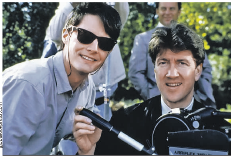
Для актера Кайла Маклахлена (слева) постановщик стал человеком, открывшим его миру кино.

менела и родила дочь, жила молодая семья в бедности. Но именно там Линч увлекся кино, купил первую камеру и начал снимать короткие фильмы.