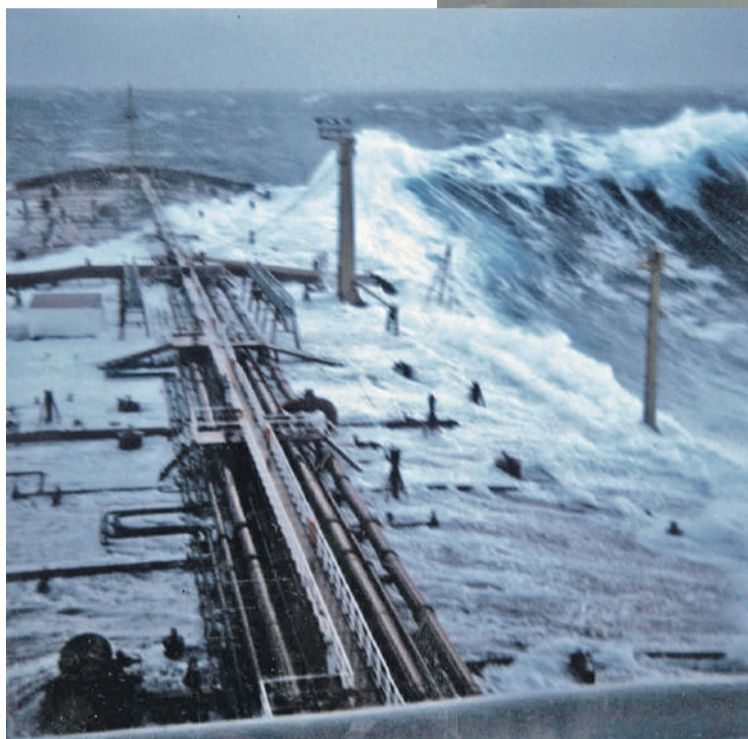
Ученые ищут объяснение феномену, почему некоторые волны вырастают в два, три раза выше соседних. Ведь формировались в одних условиях!

Блуждающие аномально высокие волны возникают не только в океанах.