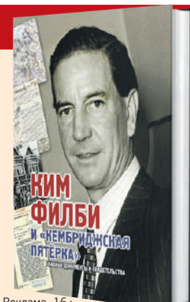
Реклама, 16+ АО «ИД «Комсомольская правда», Москва, ОГРН 1027739295781