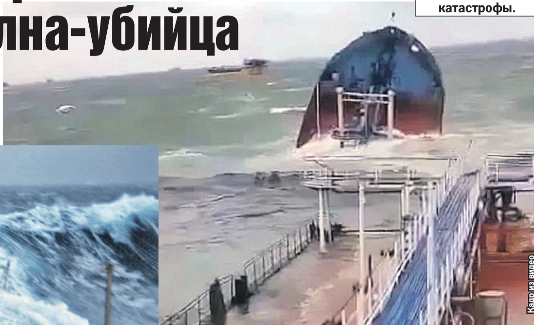
Кадр из видео

у берегов Норвегии. Максимальная высота окружающих волн составляла тогда 12 метров. То есть они были примерно в 2 раза ниже.