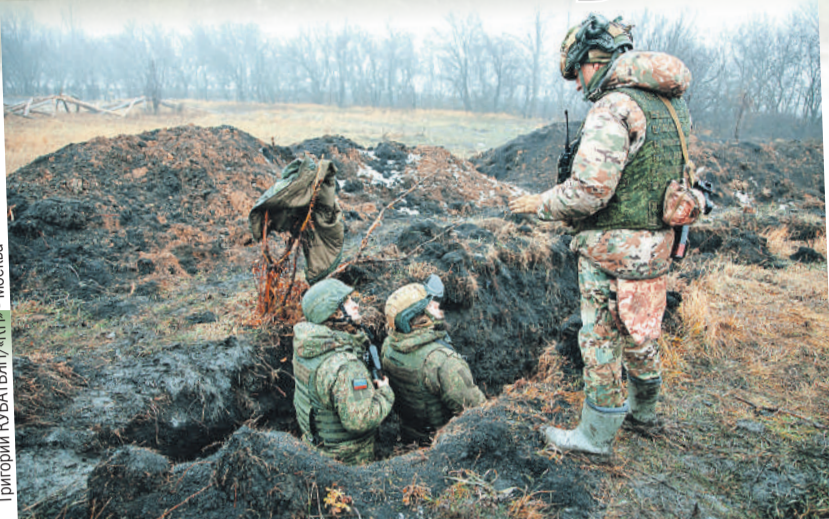
«Штурмуют» окопы парни с боевыми патронами, но инструктор все равно рядом, чтобы подсказывать на ходу.

дажи, оказывать помощь. И так три недели, пока каждое действие не будет отточено до автоматизма.