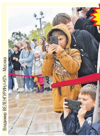
Владимир ВЕЛЕНГУРИН/«КТ» - Москва

Москва Санкт-Петербург Екатеринбург Новосибирск Казань Нижний Новгород Волгоград Омск Ростов-на-Дону Самара Челябинск Уфа Воронеж Краснодар Красноярск Пермь