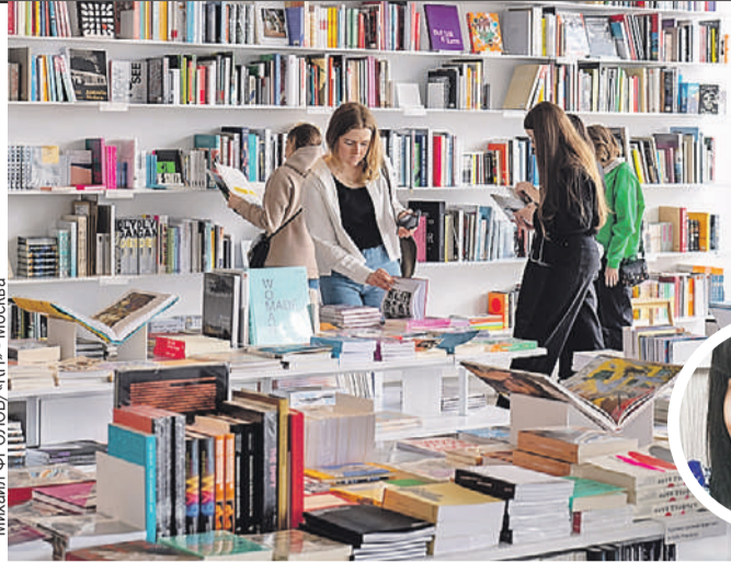
Михаил Фролов/«КП» - Москва

Издатели отмечают, что сегодня молодежная аудитория обеспечивает рост всего сегмента художественной литературы.