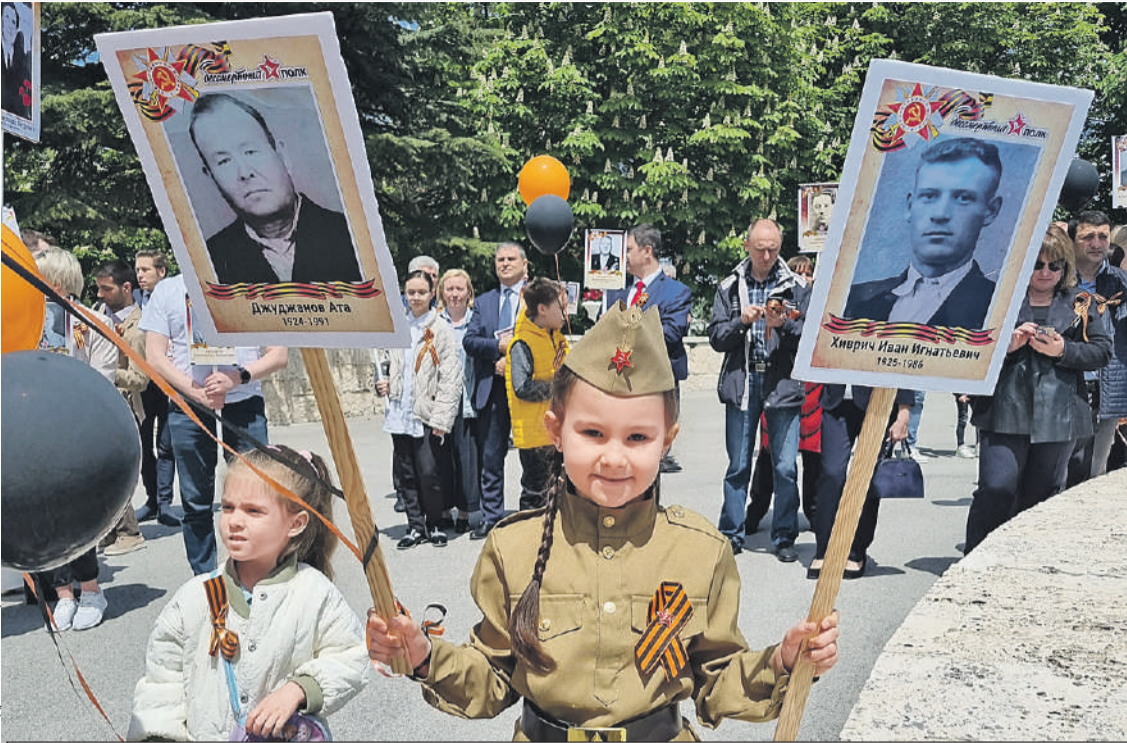
Несмотря ни на что, в Анкаре в этом году прошел «Бессмертный полк».

гий. - Они трудяги. Видишь бледного чудака, бредущего с пляжа, - он! Под зонтом программировал. Вот кого много - так это праздных балбесов. Деток от армии прячут. Напокупали в свое время недвижимости, теперь вспомнили, приехали. Сынкам по 17 - 18 лет, а с ними бабушка или тетюшка для контроля. Вот и живут на квартирах, домах, виллах. Пережидают. А прав батюшка.