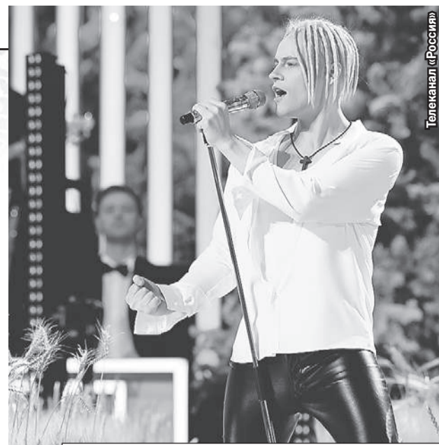
Песня «Я - русский» не раз прозвучит в праздничную ночь.