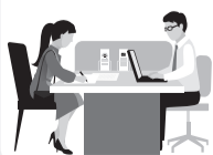
По данным ЦБ.

* Точных сроков введения этих мер пока нет. Реформа ЦБ продлится с 2025 по 2027 год.