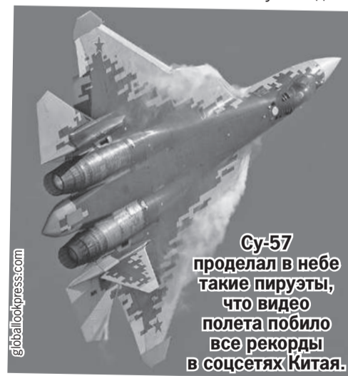
Су-57 проделал в небе такие пируэты, что видео полета побilo все рекорды в соцсетях Китая.

на приобретение Су-57, вызвав массу пересудов, какое же государство совершило громкую покупку. Но просят пока не называть покупателя: «Американцы звереют от ревности и грозят суровыми санкциями». Типичное поведение проигрывающих конкурентов.