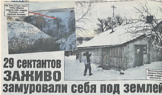
29 сектантов ЗАЖИВО замуровали себя под землей

Несколько месяцев назад на двери молельного дома в Погановке появилась надпись: «Простите, у нас обет молчания». Как рассказывают местные