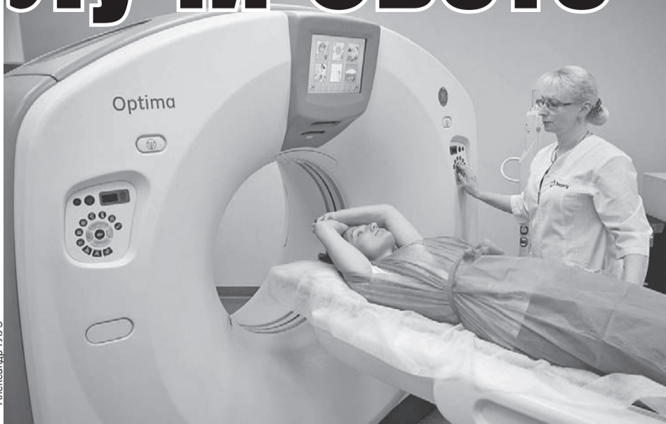
Аппарат МРТ - мощный магнит, поэтому надо снять кольца и пирсинг. И проверить, совместимы ли с ним зубные импланты.