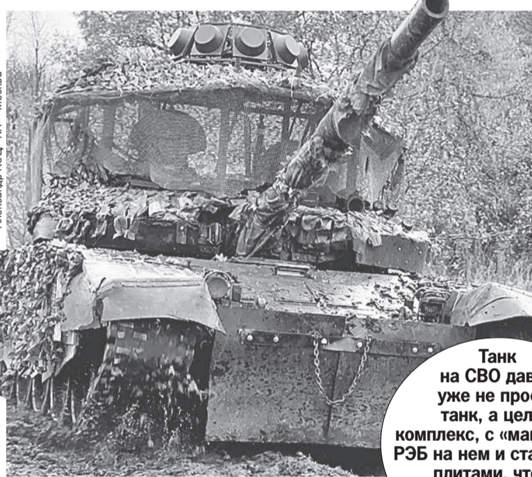
Александр КОЦ, «КП» - Москва

Несколько минут - и парни уже готовы открывать огонь. Ждут только