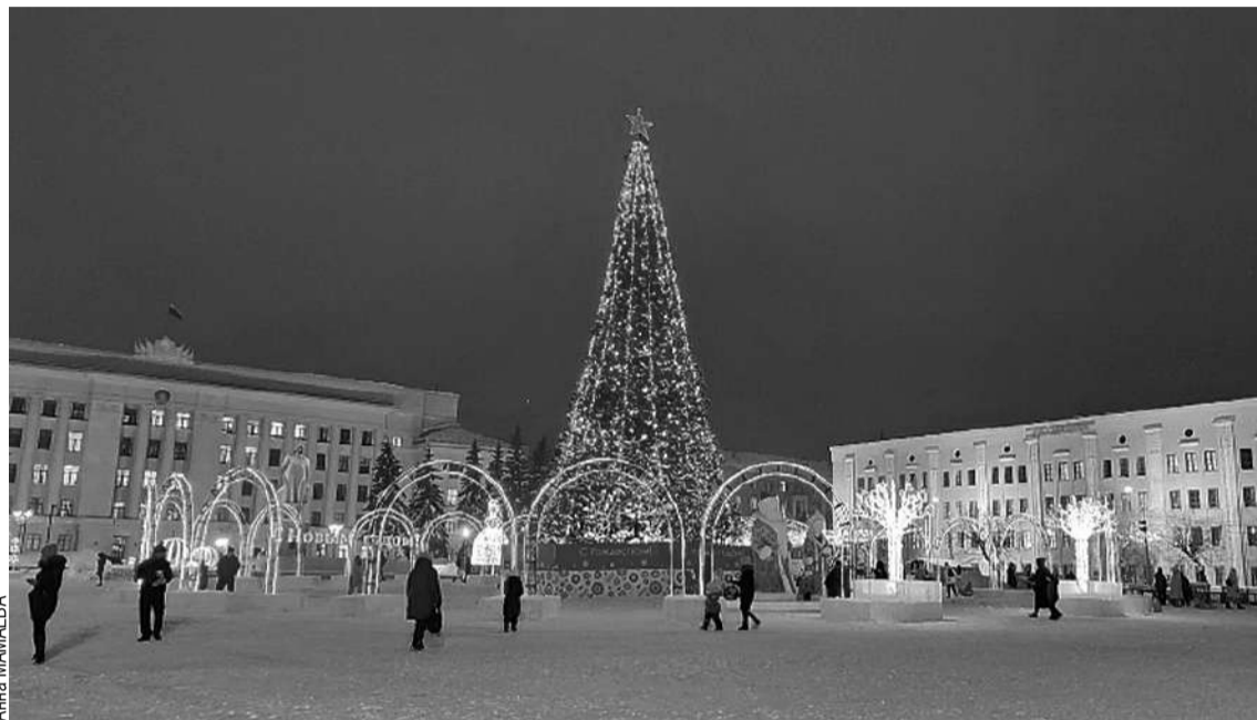
Основные гуляния пройдут в новогоднюю ночь на Театральной площади.

Множество мероприятий пройдет на пешеходной Спасской, которая станет главной улицей Новогодней столицы России. В частности, 7 декабря там стартует фестиваль елок. В нем примут участие послы гостеприимства - представители всех регионов страны. После они поучаствуют в торжествен-