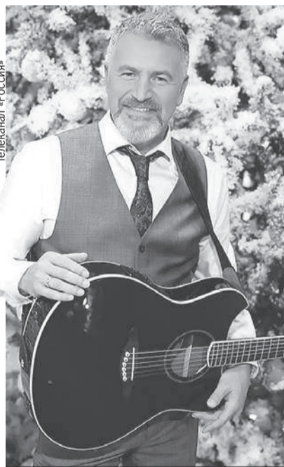
Выступление Агутин на корпоративе - отличный подарок сотрудникам.

В самолете или поезде - чем меньше свободных мест, тем выше цены. И у звезд динамическое ценообразование. Чем выше загруженность артиста, тем выше гонорар. Средний гонорар топового артиста: от 3 млн руб. до 10 млн руб. Плюс налоги. Две последние недели декабря гонорары первой десятки топовых артистов могут вырасти до 12 млн руб. Стандартное выступление эстрадного артиста 45 или 60 минут. По отдельной договоренности - можно дольше.