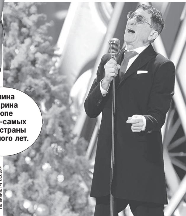
Григорий Лепс в Новый год напомнит о рюмке водке на столе.

Полина Гагарина в топе самых-самых звезд страны уже много лет.