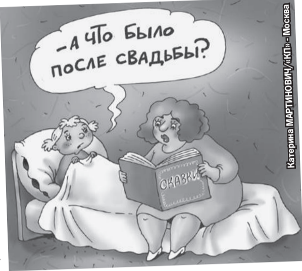
Катерина МАРТИНОВИЧУ/«КП» - Москва

Павел : «Мало кто, вступая в брак, даже теоретически допускает, что