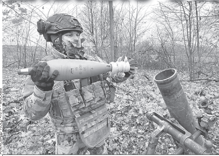
Каждый из пучков, накрученных на хвостовик мины, дает километр дальности.

В составе этой огневой группы есть и FPV-расчеты, и операторы ПТРК, и экипажи танков, и приданные «Грады», и гаубицы, огонь