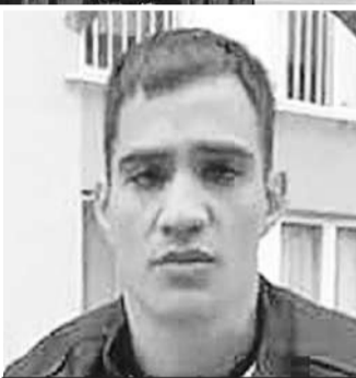
А это владелец красной фуры.