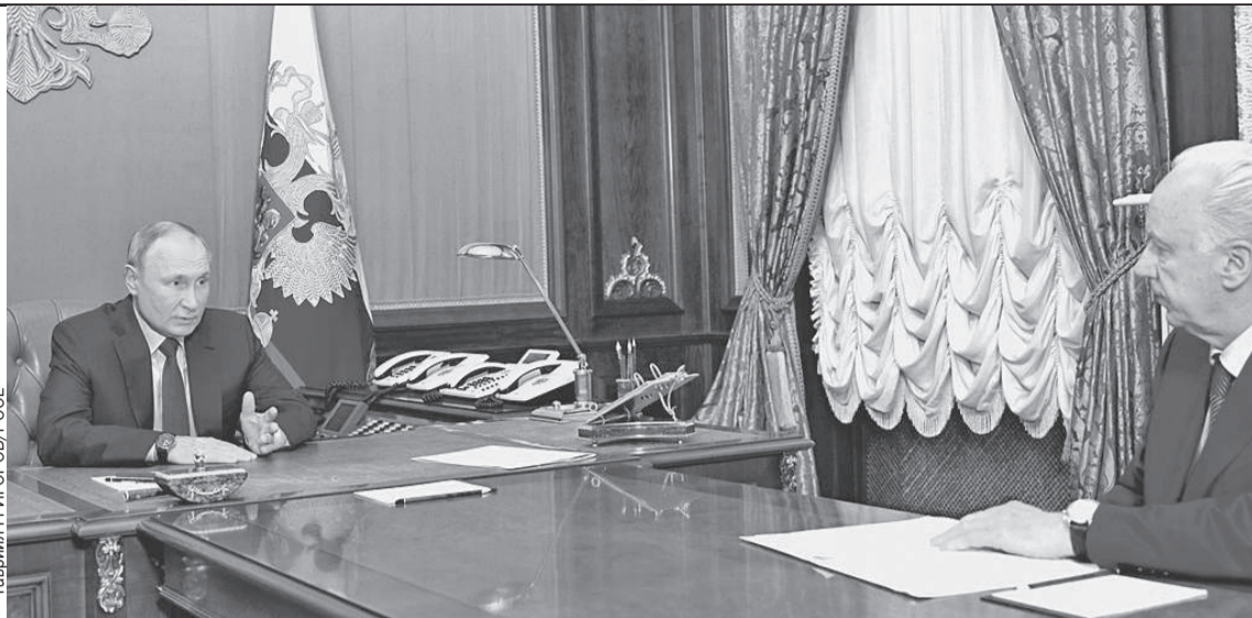
Перед тем как на Украину обрушился удар возмездия, Владимир Путин заслушал доклад главы СК Александра Бастрыкина о расследовании теракта на Крымском мосту.

- Сегодня утром нанесен массированный удар высокоточным оружием большой дальности воздушного, морского и наземного базирования по объектам энергетики, военного управления и связи Украины... В случае продолжения попыток проведения на нашей территории терактов ответы со стороны России будут жесткими и по своим масштабам будут соответствовать уровню угроз, создаваемых Россией. Ни у кого не должно быть никаких в этом сомнений, - пообещал Путин.