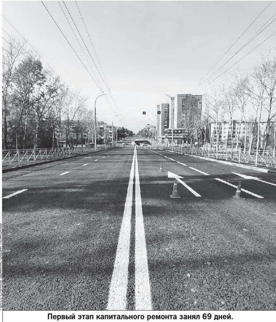
Первый этап капитального ремонта занял 69 дней.

Демонтаж был объемным: по сути, строители оставили у моста только несущие конструкции, которые во время ремонта укрепили арматурой и бетоном. Был проведен и еще ряд работ, часть из которых кемеровчане даже смогут оценить своими глазами. Например, новое дорожное полотно, чугунное ограждение, опоры освещения.