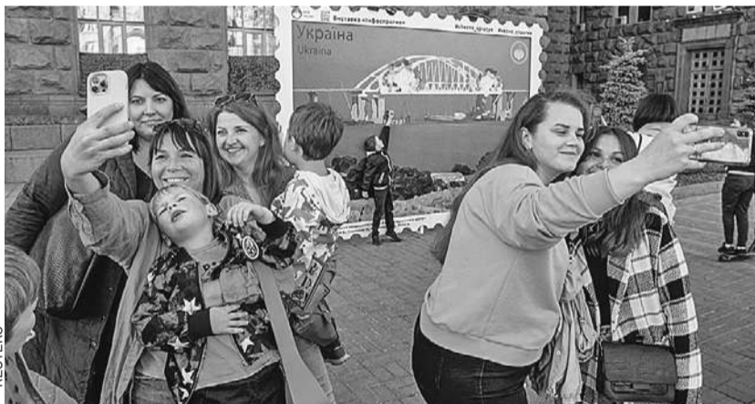
В центре Киева после субботнего взрыва на Крымском мосту жители столицы Украины с улыбками делали селфи на фоне трагической «картинки». Еще не догадываясь, что скоро будет не до смеха... (О том, как отреагировала Россия < стр. 2.)

Водитель первой фуры уже дает показания. Скорее всего, как и шофер второй фуры, он был использован вслепую и не знал о том, что везет.