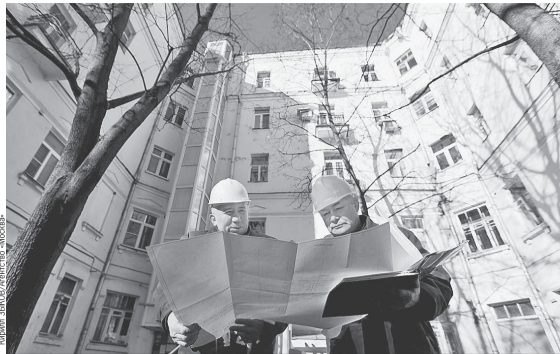
Специалисты жилищной инспекции будут тщательнее следить за качеством ремонта домов. Будем надеяться, что крыши и трубы станут протекать реже.

А теперь подробности (будет сложно, но мы разберемся). Правила расчета пени в этом году меняют уже не первый раз. Предыстория такая. По общему правилу, которое действовало до февраля