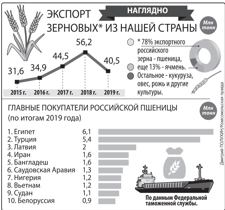
Дмитрий ПОЛУХИН/Комсомольская правда

За последние сутки наш сайт посетили 5 миллионов 938 тысяч человек