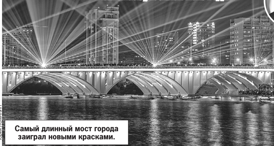
Самый длинный мост города заиграл новыми красками.

В Екатеринбурге готовятся к главному юбилею 2023 года.