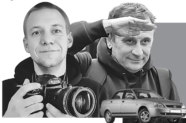
Владимир ВОРСОБИН (текст)

Продолжение. Начало в предыдущих номерах «КП» и на сайте KP.RU.