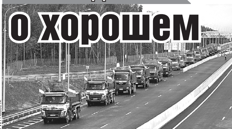
Названия у новой скоростной автомагистрали М-12 пока нет. Озвучивались различные варианты, например «Евразия», «Восток», «Казань».