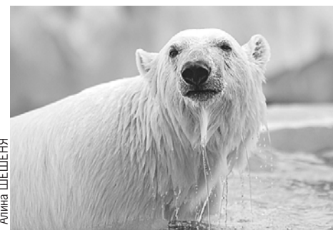
Медведицу Хатангу нашли на Северной Земле истощенным медвежонком. Теперь она живет в новом вольере в Екатеринбургском зоопарке.

будут проходить масштабные фестивали, выставочные проекты и театральные премьеры. А вот программу самого Дня города пока держат в секрете. Но без концертов, спектаклей и мультимедийных инсталляций точно не обойдется.