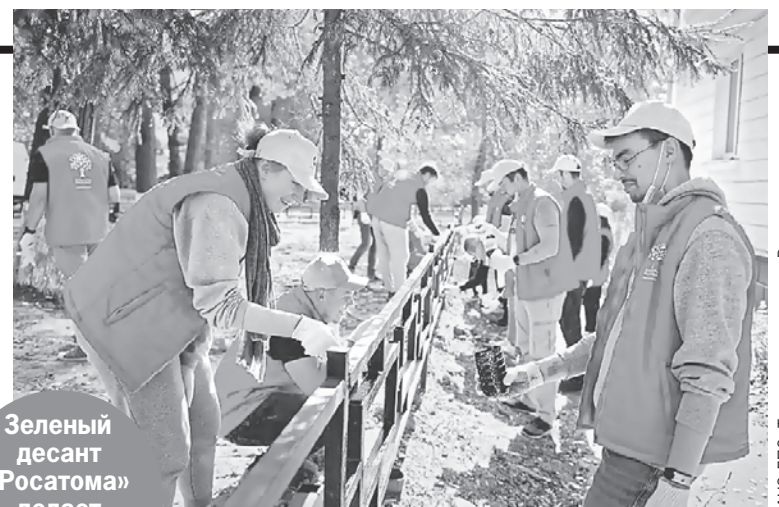
Зеленый десант «Росатома» делает природу чище.

«Росатом» реализует проекты в городах присутствия. В этом году к ним присоединился Энергодар, в котором располагается самая крупная в Европе атомная электростанция - Запорожская АЭС. Жители Энергодара переживают непростые времена, и семья «Росатом» решила их поддержать проведением марафона «Росатом вместе с Энергодаром». Так сотрудники Госкорпорации оказывают поддержку жителям