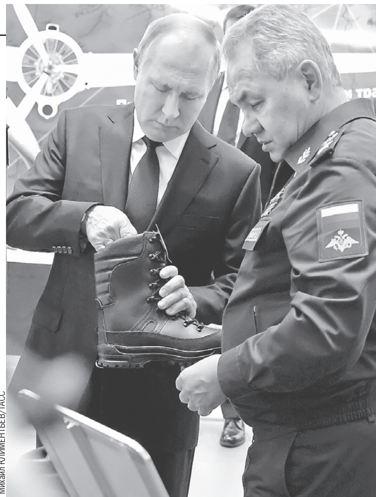
Уже после коллегии Владимир Путин и Сергей Шойгу осмотрели последние разработки для наших бойцов на специальной выставке.

- Проведенная частичная мобилизация выявила опре-