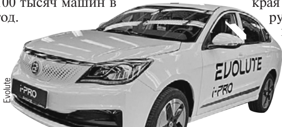
Седан Evolute i-PRO. Владельцы электрокаров в РФ получают право не платить за платные городские паркинги.

В Липецкой области начали сборку российских электрокаров Evolute. Первая модель - седан - называется i-PRO. В ней 163-сильный мотор и аккумулятор с запасом хода на 420 км. Запланирована сборка кроссоверов i-JOY и минивэнов i-VAN. Расчетная мощность завода свыше 100 тысяч машин в год.