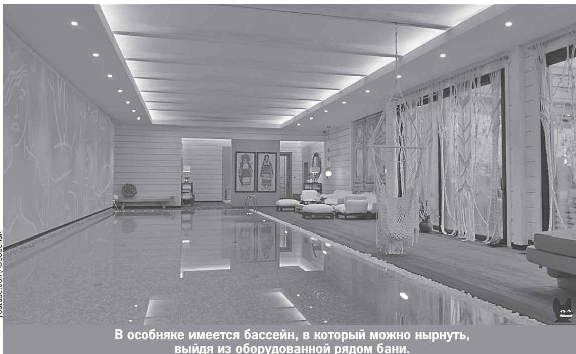
В особняке имеется бассейн, в который можно нырнуть, выйдя из оборудованной рядом бани.

А еще есть просторная баня с выходом к бассейну: «Бассейн всегда был моей мечтой, потому что я человек брезгливый, в общественных бассейнах плавать не могу».