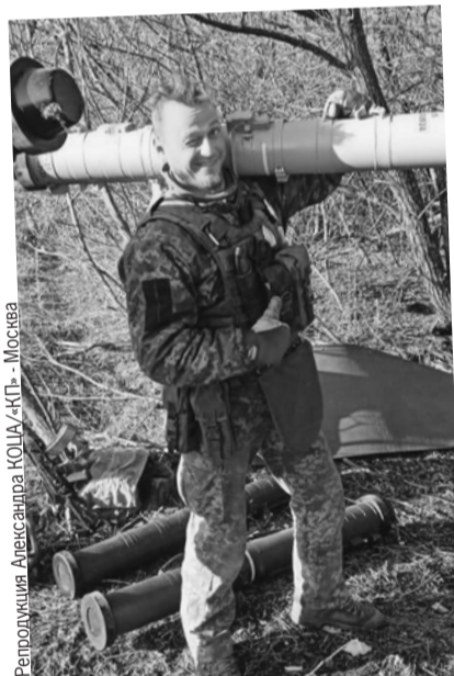
Военные Украины любят позировать перед камерой с оружием (снимок найден в телефоне одного из пленных)...

В ходе завязавшегося боя украинские десантники успели уничтожить одну свою пусковую установку, чтобы не досталась противнику. Четверо бойцов ВСУ были уничтожены. Еще четверо предпочли сдаться.