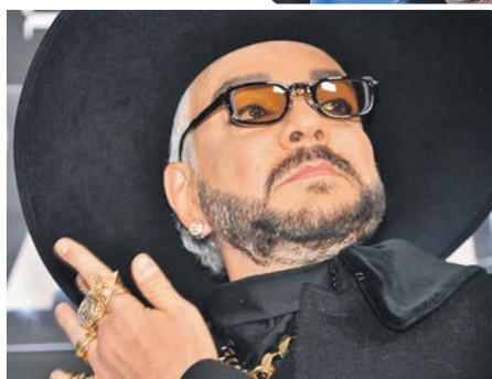
Москва

не раз расходились во мнениях. В этот раз артист не простил коллеге интервью, в котором Успенская нелестно о нем отозвалась. «Хватит на мне хайповать!» - вдарил по столу Филипп Киркоров и подал на Успенскую в суд.