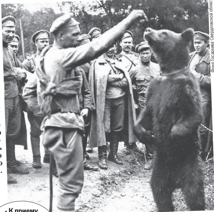
Фонд Государства Свердловской области

От русского медведя на дереве не спрячешься.