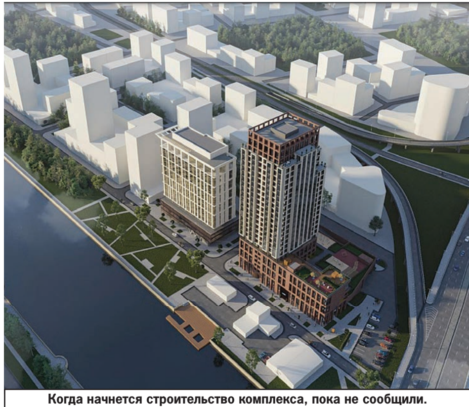
Когда начнется строительство комплекса, пока не сообщили.