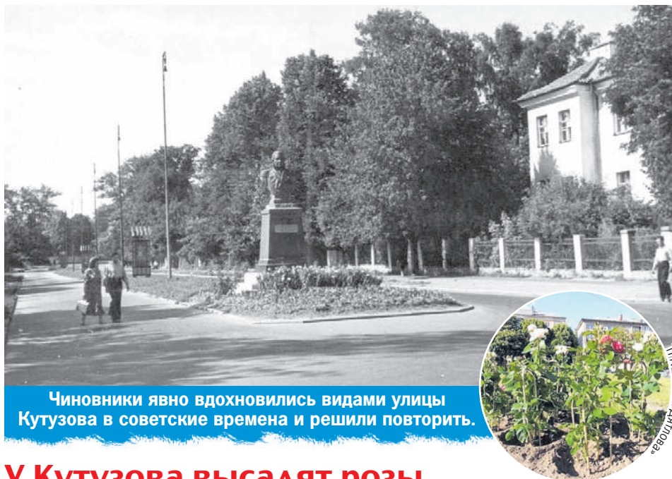
Чиновники явно вдохновились видами улицы Кутузова в советские времена и решили повторить.