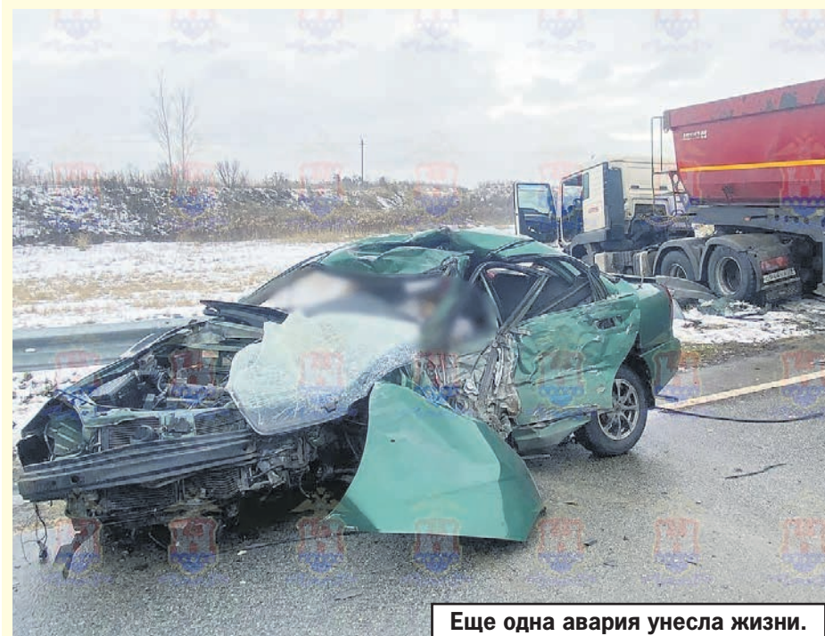
Еще одна авария унесла жизни.