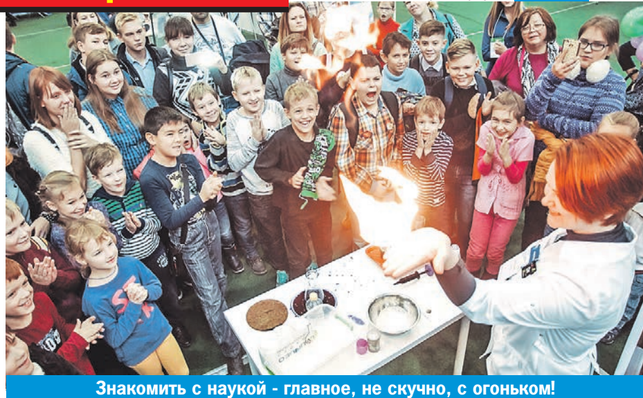
Знакомить с наукой - главное, не скучно, с огоньком!

Именно увлеченный человек способен зажечь другого. Пройдите по окрестным кружкам. Главное - смо-