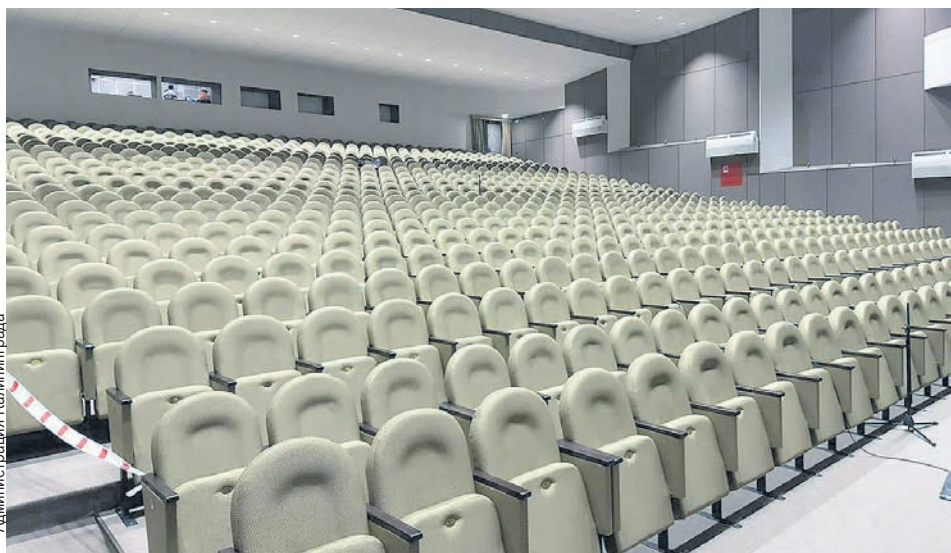
Зал - готов, а вот сквер перед Домом искусств еще преобразается.