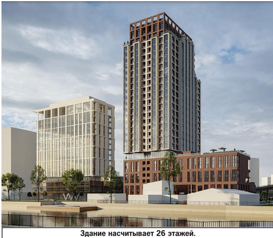
Здание насчитывает 26 этажей.