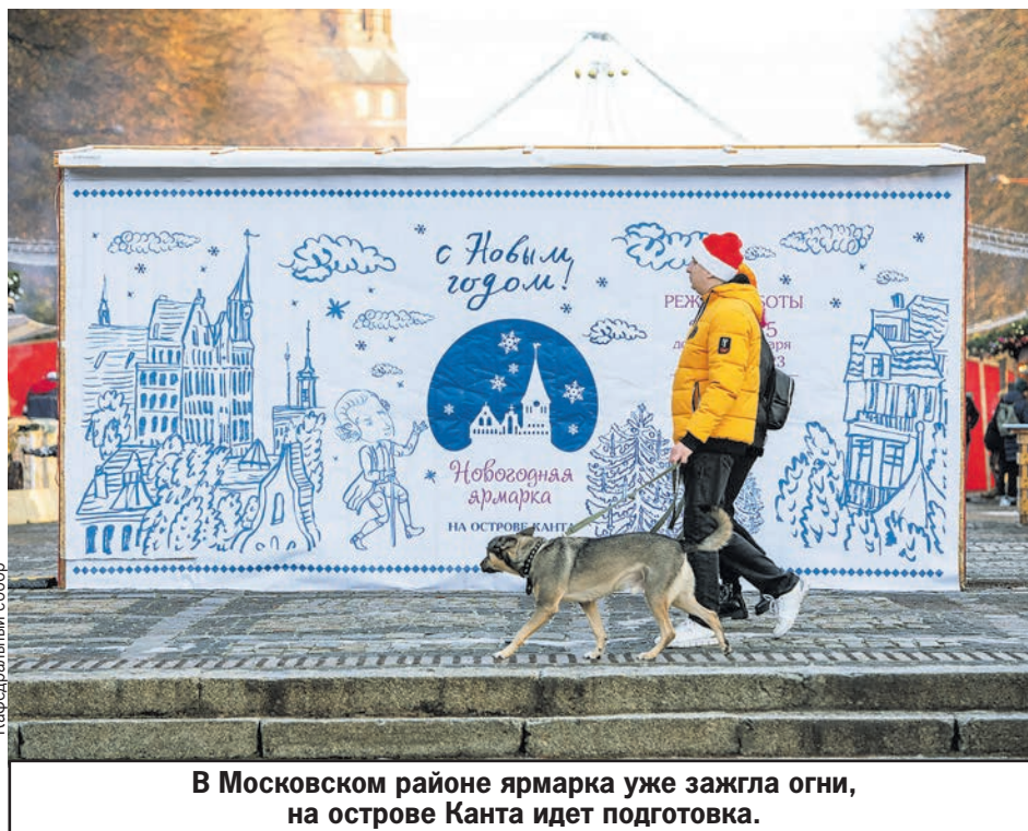
В Московском районе ярмарка уже зажгла огни, на острове Канта идет подготовка.

дет длиться больше трех недель. Она украсит себя тремя километрами световых гирлянд, угостит гостей оливье и бутербродами с икрой и 31 декабря останется далеко за полночь.