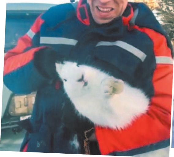
Оказавшись в руках человека, заяц сопротивлялся отчаянно.

- Всех с Новым годом зайца! - рассмеялись мужчины. - Беги к своим!