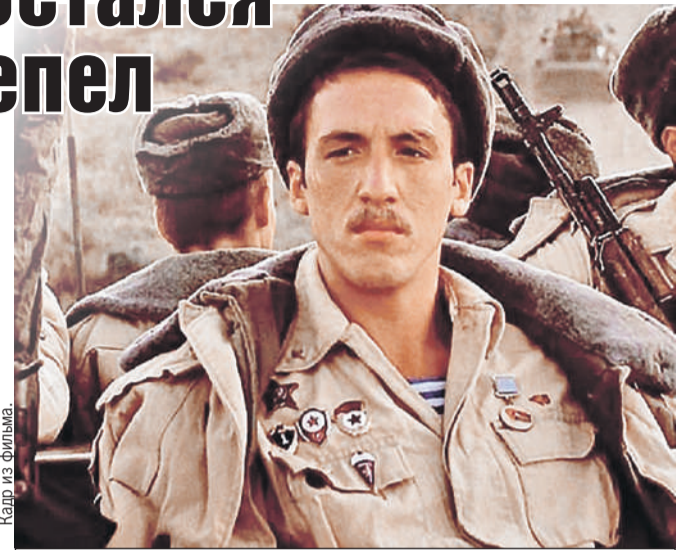
Герой Смольянинова стоял за Родину в «9 роте», а сам Артур Родину предал.

Тем временем актер Иван Охлобыстин, который часто бывает в Донбассе, высказался: