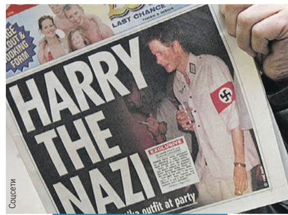
Появление принца в нацистском мундире вызвало шок в британском обществе.

«В 2005 году был приглашен на костюмированную вечеринку по случаю Хеллоуина. У меня была дилемма: надеть костюм пилота или нацистский мундир. Сам я склонялся к одежде летчика, но когда Уильям и Кейт