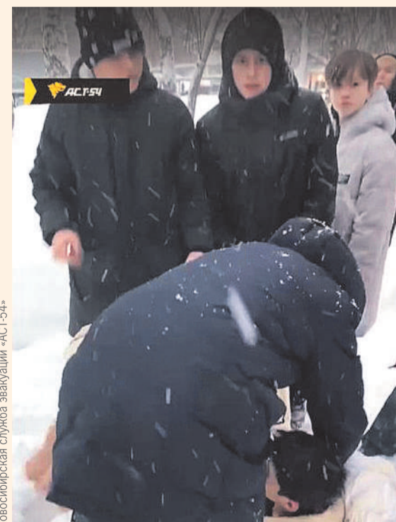
Новосибирская служба эвакуации «АСТ-54»

- По предварительным данным, ребенок отравился угарным газом, - пояснили в ГУ МЧС по Новосибирской области. - Но он уже идет на поправку, все будет хорошо. Спасибо ребятам, которые помогли. Они большие молодцы!