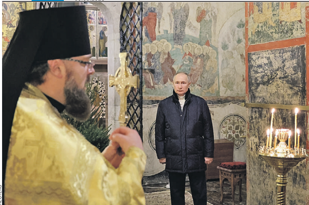
Это Рождество Владимир Путин встречал в Москве. Он отстоял службу в Благовещенском соборе Кремля. Обычно глава государства отмечал этот праздник в регионах, лишь в прошлом году его планы нарушил коронавирус - тогда президент посетил домовую церковь в резиденции «Ново-Огарево».