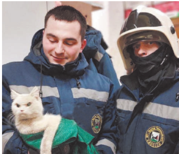
Кот оказался старым знакомым, часто гулял рядом с детсадом.

- Мы пробрили бетонную стену кувалдой и добрались до котика, - рассказывает старший смены №2 аварийно-спасательной службы «Безопасный город» Евгений Тутолмин. - Первое, что мы увидели, - серый, грязный и пыльный комок грусти. Бедное животное даже боялось выходить на свет. Видимо,