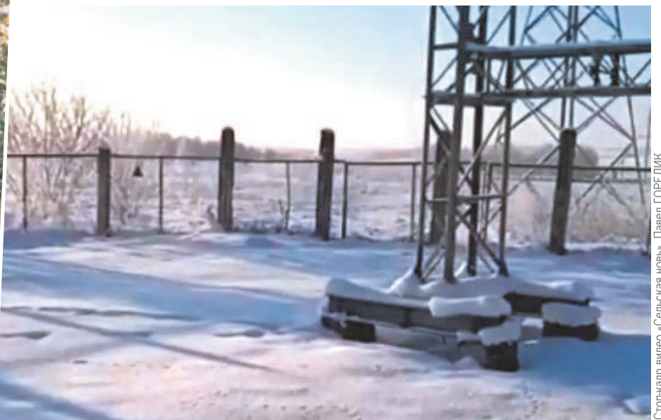
Зверек случайно заскочил на территорию подстанции, а выбраться обратно уже не смог.