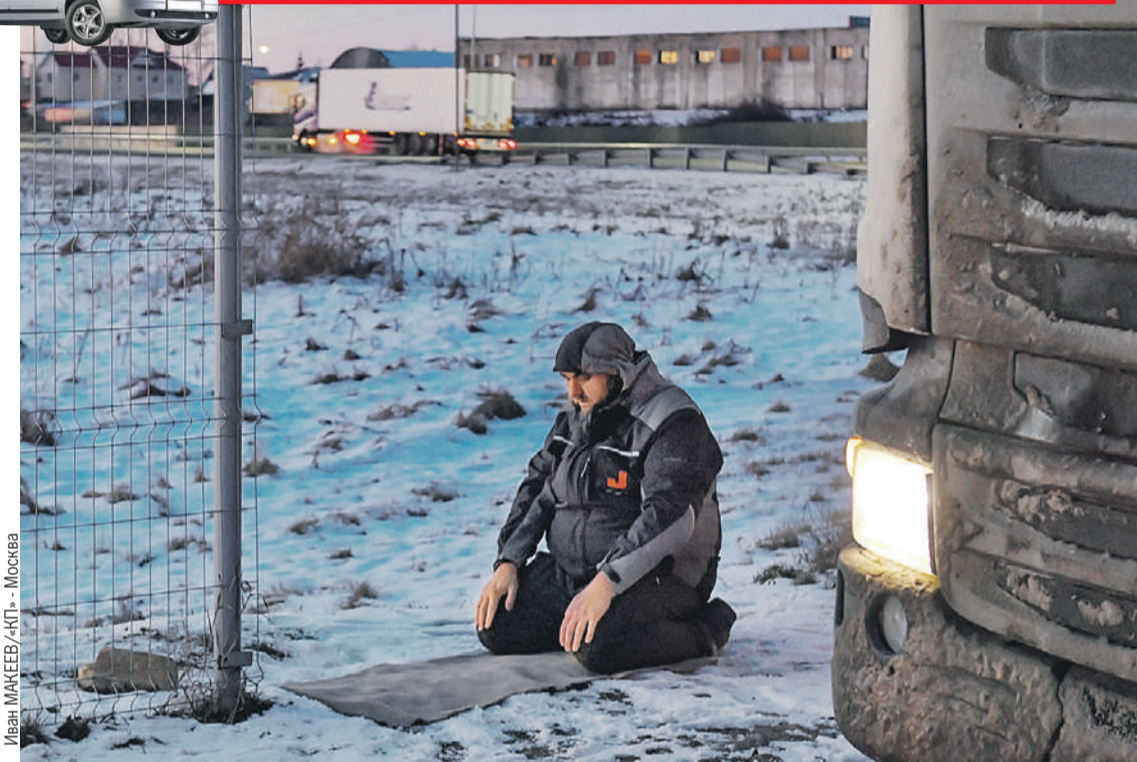
Иван МАКЕЕВ / «КП» - Москва

- Потому что вы заработали, а молодежь - нет, - понимаю ход Александровых мыслей.