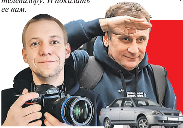
Владимир ВОРСОБИН (текст)

Читайте на сайте KP.RU все путевые заметки нашей экспедиции (там же - видео, которое мы снимали в пути).