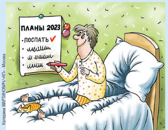
Катерина МАРТИНОВИЧ/«КП» - Москва

Завершились январские выходные, и мы спросили: