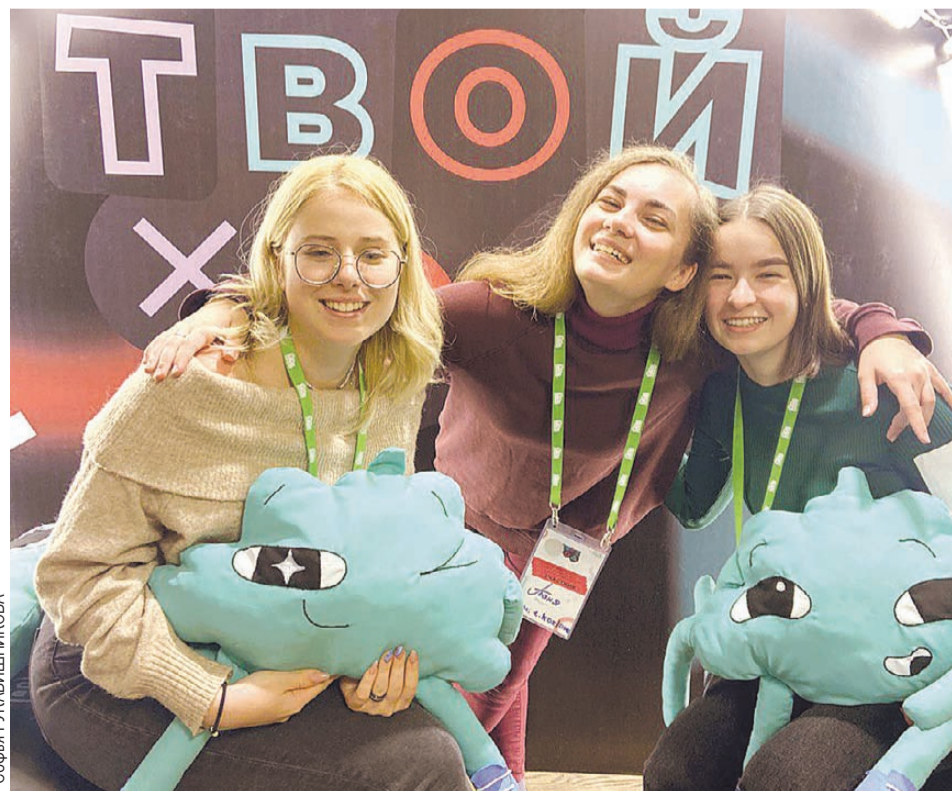
А это счастливые участницы из ИГУ. Девушки получили массу положительных эмоций!