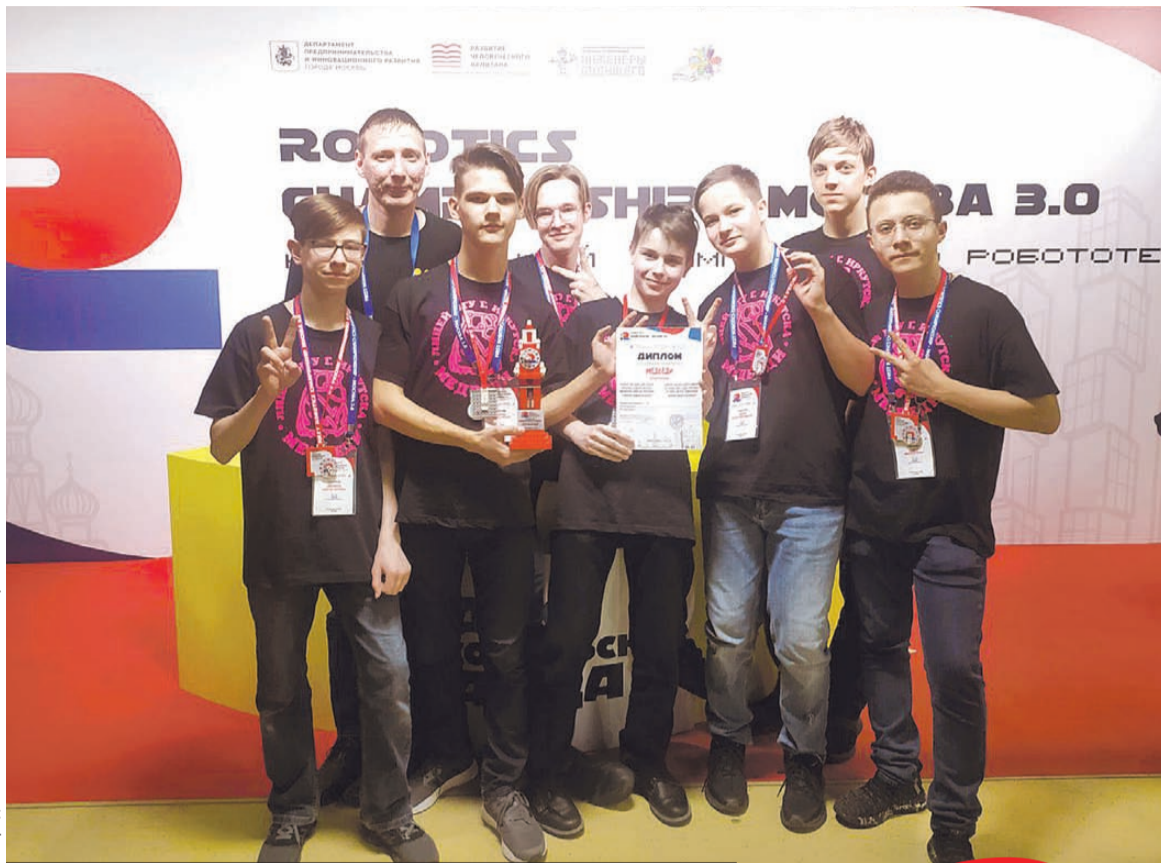
«Медведи» - одна из самых сильных команд Приангарья.

робототехнический турнир «Кубок юных техников». До пандемии в Иркутской области (начиная с 2013 года) проводился, пожалуй, один из самых известных на берегах Ангары фестиваль «РобоСиб». На него ежегодно приезжали сотни дошкольников (от 5 лет), школьников и студентов со всей страны и даже из соседних государств. Общее число собранных ими роботов к 2020 году превысило тысячу.