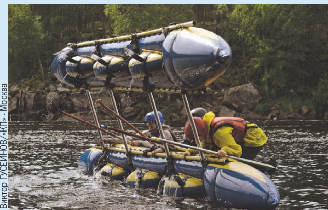
Виктор Гусев/ИНОУ/«КП» - Москва

Кстати. Детски кешбэк тоже работает. Государство готово вернуть родителям до 50% трат на летний отдых. Но не более 20 тысяч рублей. Акция стартует 31 марта. Отправить ребенка в детский лагерь с кешбэком можно будет с 1 мая и на протяжении всего лета. Важно помнить, что оплатить путевку нужно только банковской картой «Мир». На нее же придет возврат. При этом карта «Мир» необязательно должна принадлежать маме или папе, подойдет любого родственника. На одного ребенка можно получить кешбэк и дважды, и трижды, если он поедет отдыхать на две или три смены.