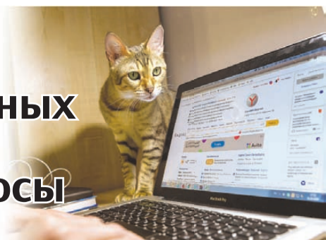
Олег ЗОЛОТОВ/«КП» - Санкт-Петербург

РАДИО КОМСОМОЛЬСКАЯ ПРАВДА FM.KP.RU Иркутск 91,5 FM | Братск 99,5 FM