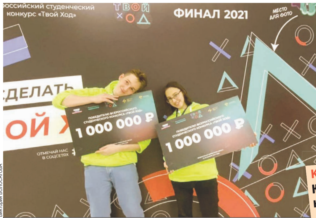
Довольные победители из ИРНТУ.

Первыми участниками стало более полумиллиона человек. Начальные этапы проходили дистанционно. Ребята выполняли тесты, конкурсные задания, проявляли активность в рамках проведения проекта и работали над решением кейсов. При этом студенты в чате конкурса по своему направлению - всего их 11 - находили единомышленников (зачастую из других городов) и вместе решали задачу, поставленную «заказчиком».