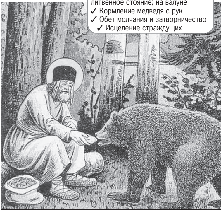
То, что Серафим Саровский кормил медведя в лесу, видели паломники к преподобному в разное время.