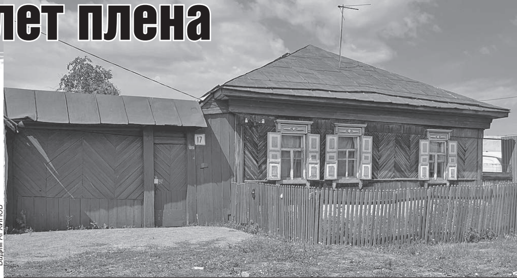
За этими бело-голубыми ставнями творился кошмар.

30 июля в поселок Смолино под Челябинском вечером въехали с мигалками полиция, прокуратура, Следственный комитет, машина судмедэкспертизы. Вошли с обыском в обыкновенный частный дом за ярко-синим забором. В этом доме держали пленницу, похищенную 14 лет назад 19-летнюю (тогда) девушку. Ей, уже 33-летней, чудом удалось сбежать.