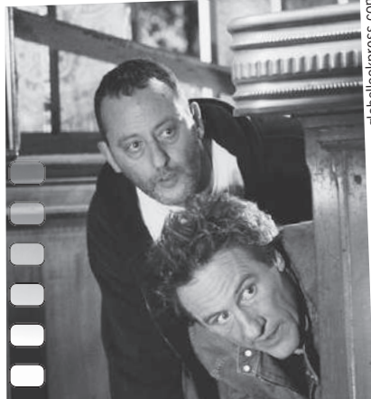
С Жераром Депардьё в фильме «Невезучие» (2003).