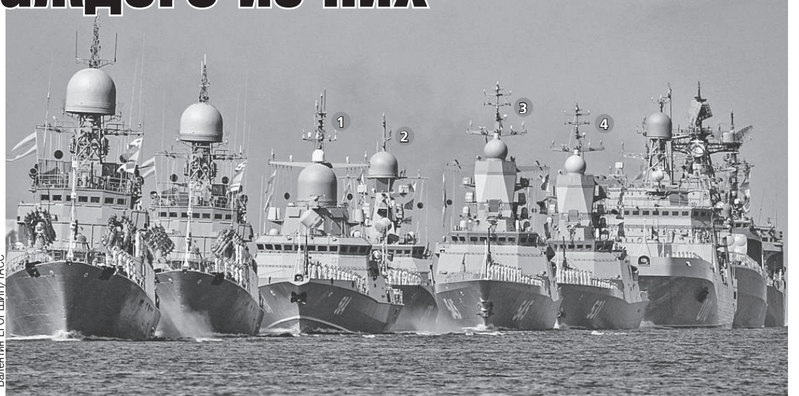
На снимке - малый ракетный корабль «Одинцово» (1), корвет «Стойкий» (2), корвет «Сообразительный» (3), большой десантный корабль «Иван Грен» (4) во время Главного Военно-морского парада в честь Дня Военно-морского флота России.

Любопытная деталь: среди участников парада есть «свеженький новичок», который лишь готовится встать в строй ВМФ. Это малый ракетный корабль «Буря». Он еще на госиспытаниях, но уже известно, что его скоро передадут Балтийскому флоту. Рядом с ним шел в кильватерном строю малый ракетный корабль «Зеленый Дол» - фронтовик, ветеран борьбы с террористами. Он выполнял задачи в составе группировки ВМФ России в Средиземном море. Его ракеты «Калибр» снайперски по-