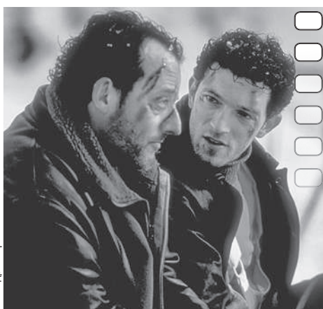
С Венсаном Касселем в триллере «Багровые реки» (2000).