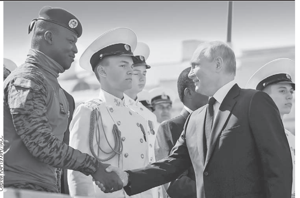
Перед началом Военно-морского парада Владимир Путин приветствовал гостей, в том числе президента переходного периода Республики Буркина-Фасо Ибрагима Траоре.

В числе заступивших на боевое дежурство - ракетный корвет «Меркурий». Он назван в память о бессмертном подвиге команды легендарного брига. Почти два века назад он в одиночку одержал победу над двумя линейными кораблями. Отрадно, что возрождена традиция