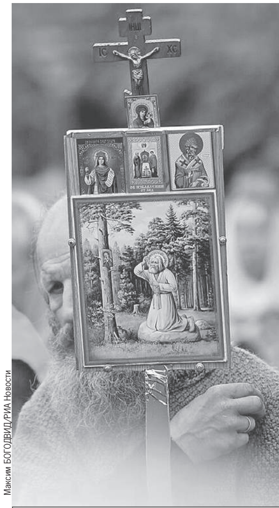
Максим БОГОДВИДРИЯ Новости

Серафимо-Дивеевский монастырь в селе Дивеево Нижегородской области, где ныне покоятся мощи Серафима Саровского, считается одним из 4 «земных Уделов Пресвятой Богородицы» - после Афона, Иверии и Киево-Печерской лавры. Тут перед образом Спасителя в Рождественской церкви 32-й год горит неугасимая свеча. И есть Святая Канавка - путь Богородицы, копать которую начал еще преподобный Серафим. Паломники по сей день ходят по ней босыми.