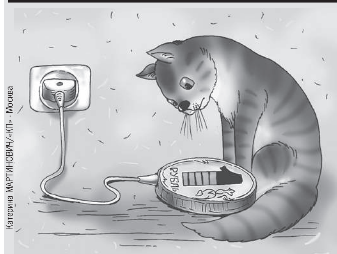
Катерина МАРТИНОВИЧ/«КП» - Москва

В России вводят новую форму денег (подробнее - стр. 6).