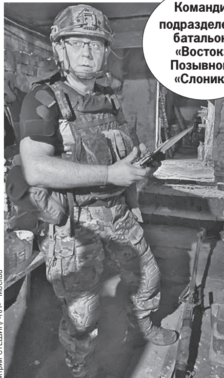
Командир подразделения батальона «Восток». Позывной - «Слоник».

Дроны уходят из нашего сектора, смещаясь в сторону Старомайорского. «Слоник» выключает ружье и мы лопимся через кусты к подвалу.