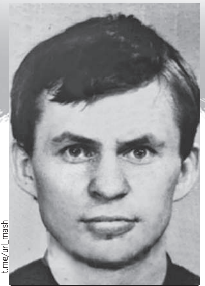
Односельчане Владимира почти не помнят: «Вроде был высокий, вроде симпатичный...»