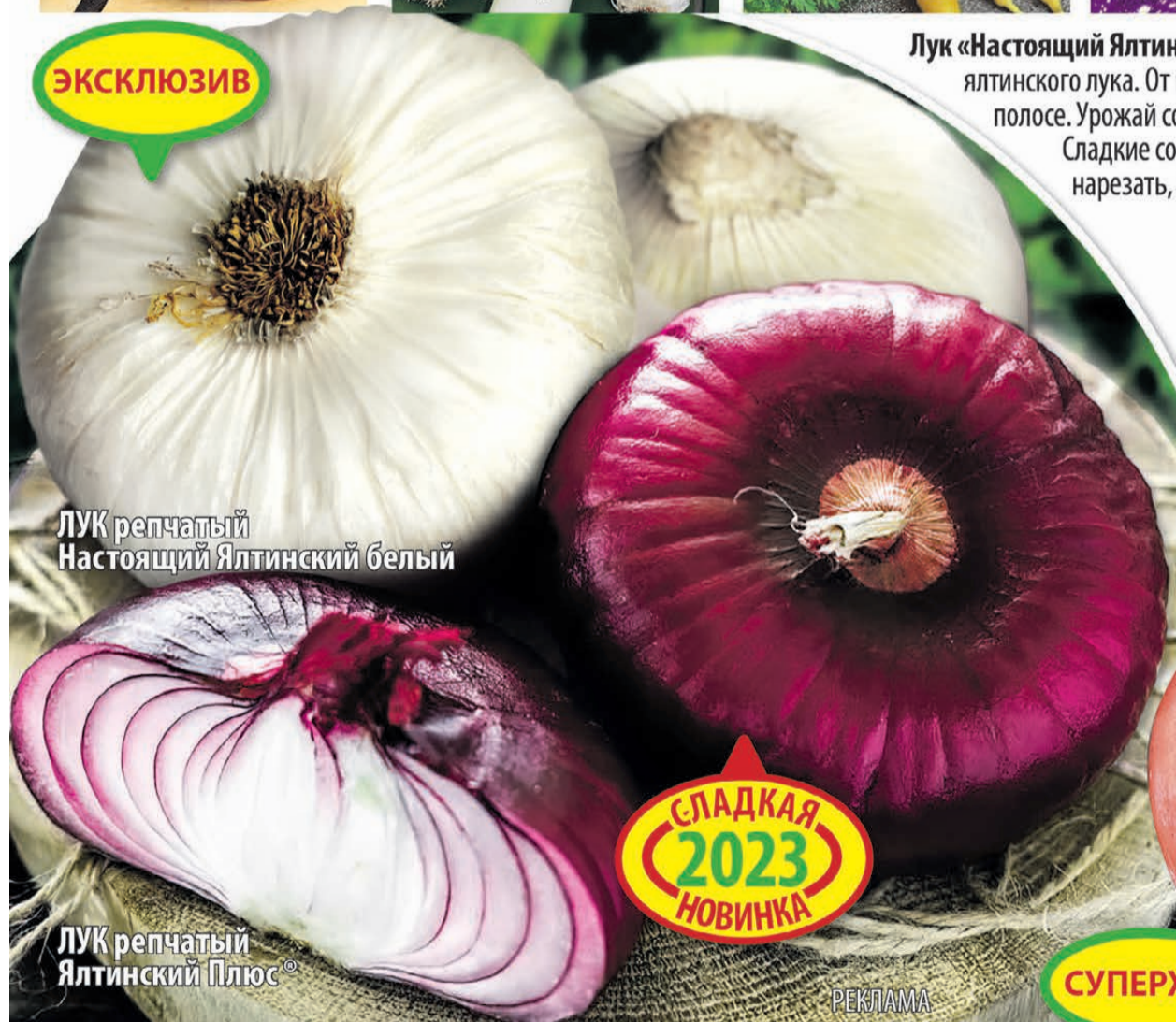
ЛУК репчатый Настоящий Ялтинский белый