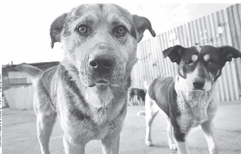
Юлия Пыхалова - КП - Иркутск

Бездомных псов на Дальнем Востоке много, и сейчас идут жаркие споры, что с ними делать.