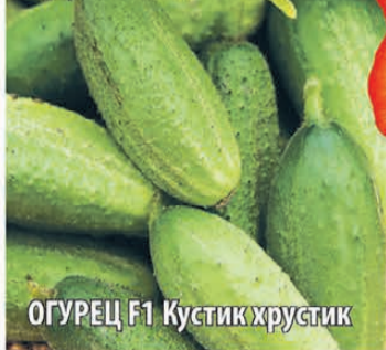
ОГУРЕЦ F1 Кустик хрустик

Суперкомпактный! Длина плети 50 см! Хрустящий!