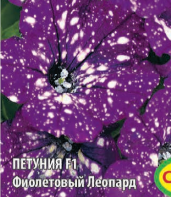
ПЕТУНИЯ F1 Фиолетовый Леопард