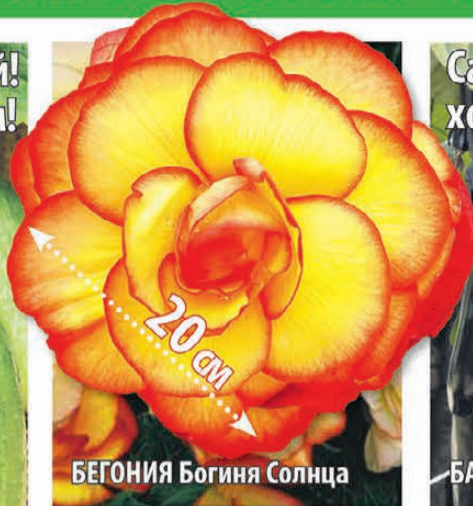
БЕГОНИЯ Богиня Солнца