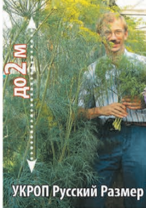
УКРОП Русский Размер®