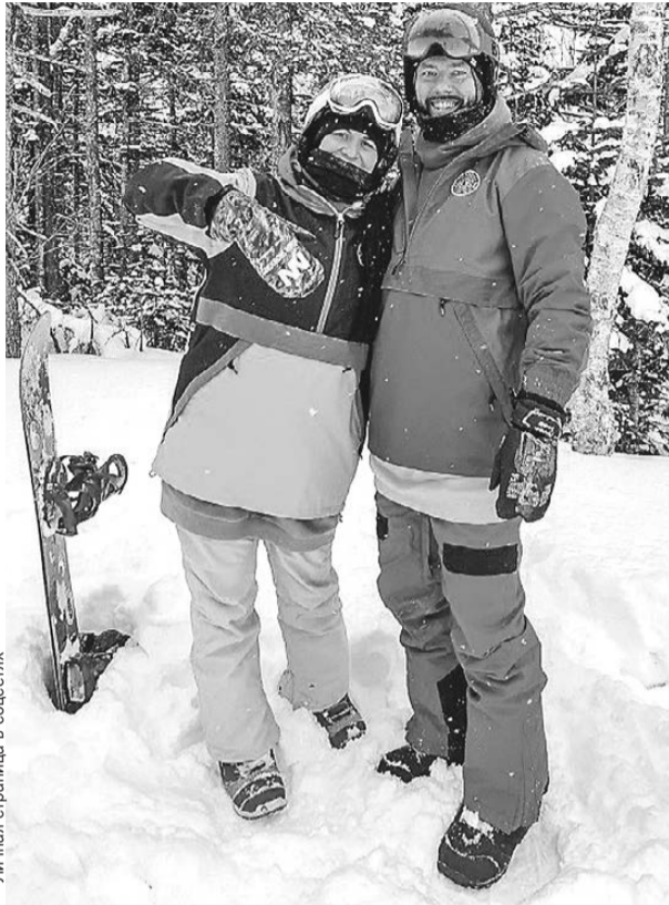
Личная страница в соцсетях