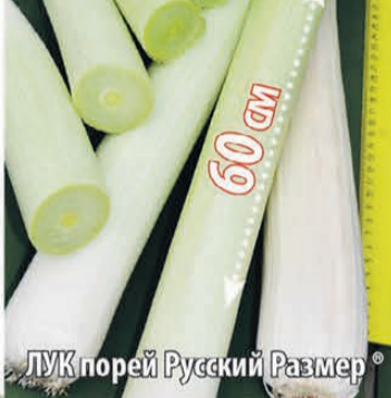
ЛУК порей Русский Размер®