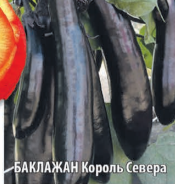
БАКЛАЖАН Король Севера