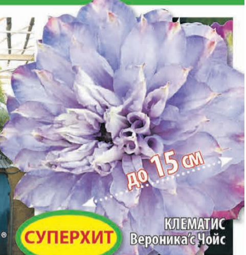
КЛЕМАТИС Вероника® Чойс