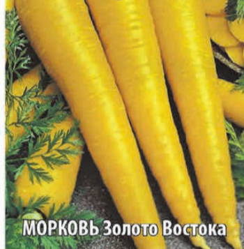
МОРКОВЬ Золото Востока