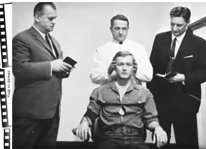
Кадр из знаменитого фильма «Ошибка резидента», где советскому разведчику (его сыграл Михаил Ножкин) на Западе устраивают психологическую проверку.