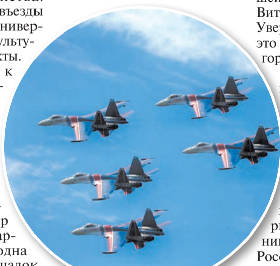
Фигуры высшего пилотажа будут выполнены на Су-30, Су-35, Су-27.

В честь Дня города небо Барнаула украсит праздничный фейерверк. Да не один! Возвращаясь к старой доброй традиции, салюты запустят на площадях Сахарова и во всех районах города.