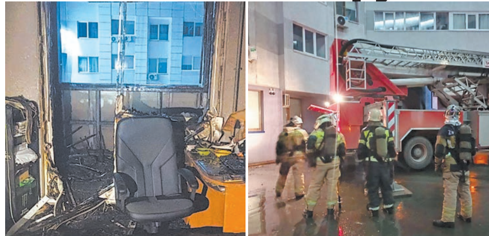
В тушении участвовало больше 50 человек и 17 единиц техники.

Компания не сразу поняла, что балкон загорелся. Когда дым начал проникать в квартиру, хозяева вызвали пожарных.