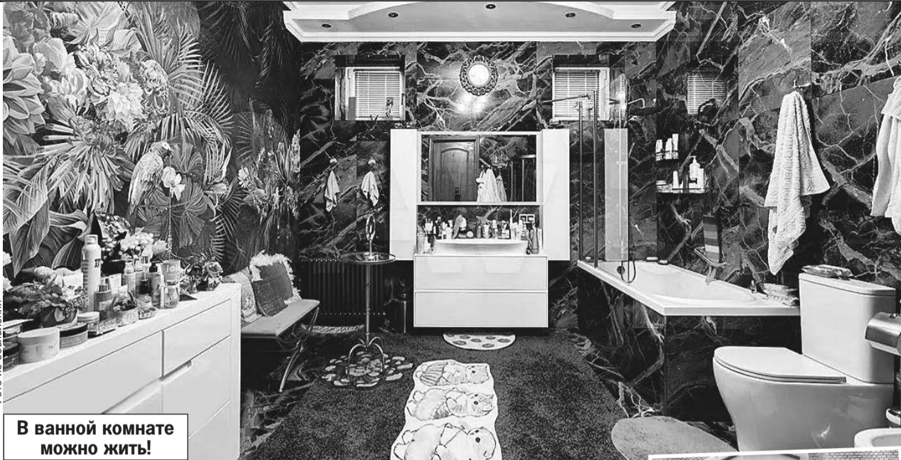
В ванной комнате можно жить!

Дельцы каким-то образом смогли достать старое видео, на котором, предположительно, Лариса Долина показывает паспорт, мол, это она. Вероятно, звезда дистанционно подтверждала свою личность для заказчика выступлений. Именно этот ролик аферисты использовали, когда брали задатки с желающих приобрести квартиру певицы. Дело в том, что по закону соб-