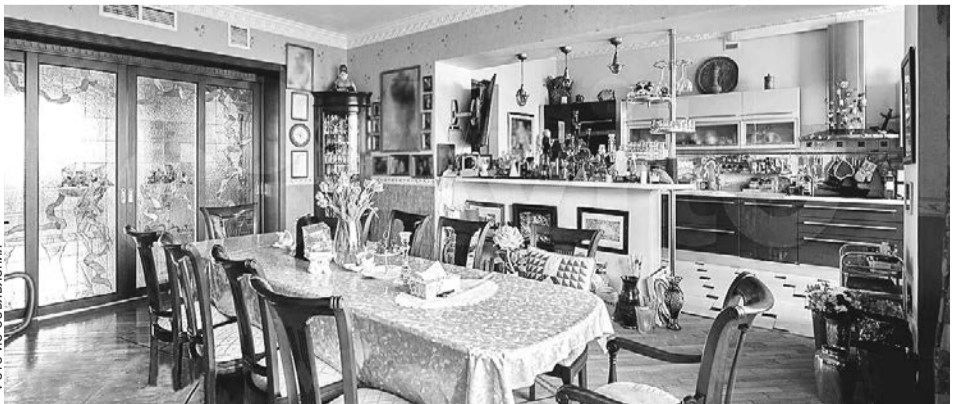
Недвижимость была выставлена на продажу в мае за 130 млн руб.