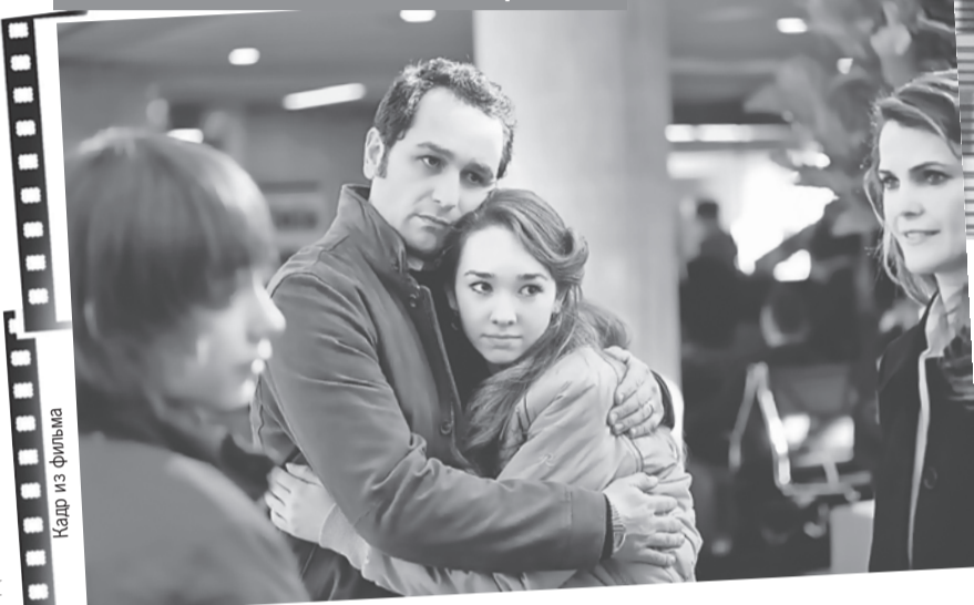
Кадр из фильма