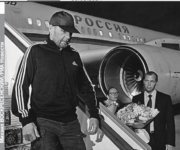
Вадима Красикова, вызволенного из ФРГ, называют ключевой фигурой обмена.

А еще известно, что Красиков молчал. Он не признал вину, не сотрудничал с немецким следствием, не просил о помиловании или снисхождении. А ведь его наверняка «кололи». Даже ломали, добиваясь признания в связях с российскими спецслуж-