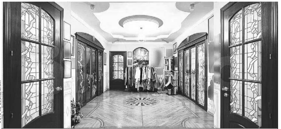
Общая площадь - 236 квадратных метров.