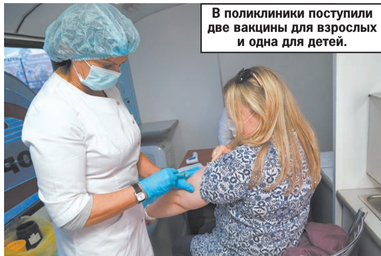
В поликлиники поступили две вакцины для взрослых и одна для детей.