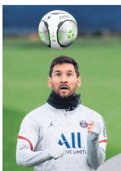
В этом сезоне ПСЖ одних только фирменных футболок реализовал 1 млн штук — из них 60% с фамилией Месси