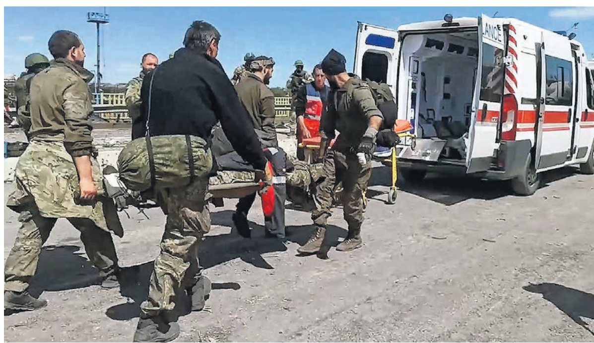
Решать судьбу сдавшихся на «Азовстали» украинских военных (на фото) российские власти хотят без участия Госдумы

Вопреки заявленным накануне планам Госдуме в среду не стала рассматривать проект постановления о запрете обмена «нацистских преступников». Таким образом депутаты хотели воспрепятствовать возможному участию в обмене пленными на Украине сдавшихся в Мариуполе бойцов батальона «Азов», но в повестку заседания этот вопрос так и не включили. Как поясняют источники „Ъ“, в ближайшее время эту инициативу рассматривать не будут, хотя концептуально она соответствует позиции властей: пленных с «Азовстали» хотят судить, а не обменивать. Эксперты считают, что принятие такого постановления поставило бы российскому руководству слишком жесткие рамки в переговорах и иных действиях в ходе спецоперации на Украине.