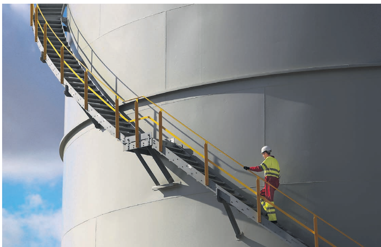
Евросоюз намерен шаг за шагом снижать зависимость от российской нефти и газа

Для реализации этих мер, по оценкам Брюсселя, потребуются дополнительные инвестиции в размере €210 млрд к 2027 году и €300 млрд к 2030 году — это сверх тех объемов средств, которые уже были запланированы по программе сокращения выбросов парниковых газов на 55% к концу десятилетия в сравнении с выбросами 1990 года. Но эти инвестиции окупятся, позволив сэкономить до €80 млрд на импорте газа, до €12 млрд — нефти и €1,7 млрд — угля к 2030 году.