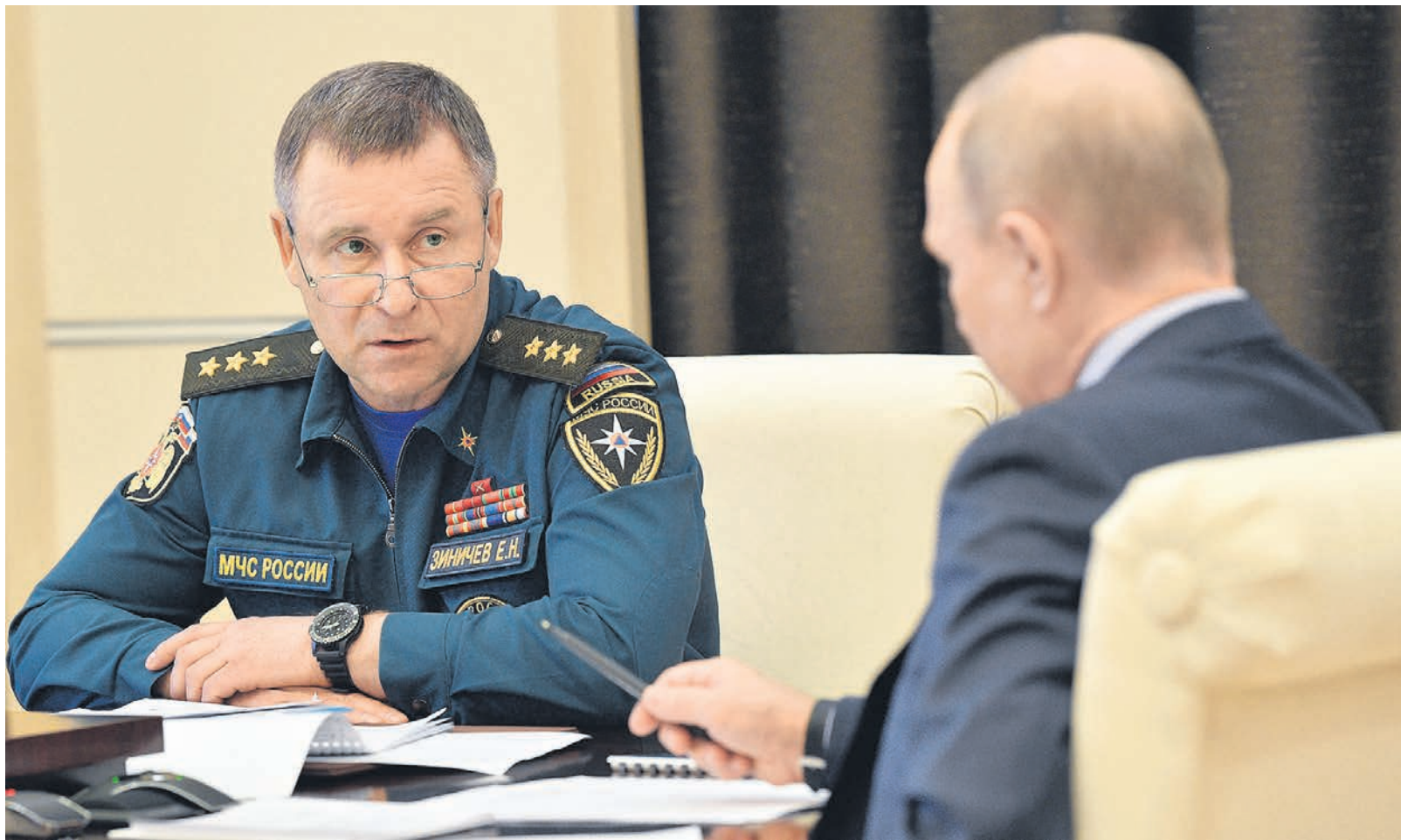
Глава МЧС оказался в опасной близости от президента

Да, они сидели на расстоянии где-то как раз полтора метра друг от друга. Но тем не менее было видно, как во время чьих-то докладов склонялись друг к другу с какими-то замечаниями.