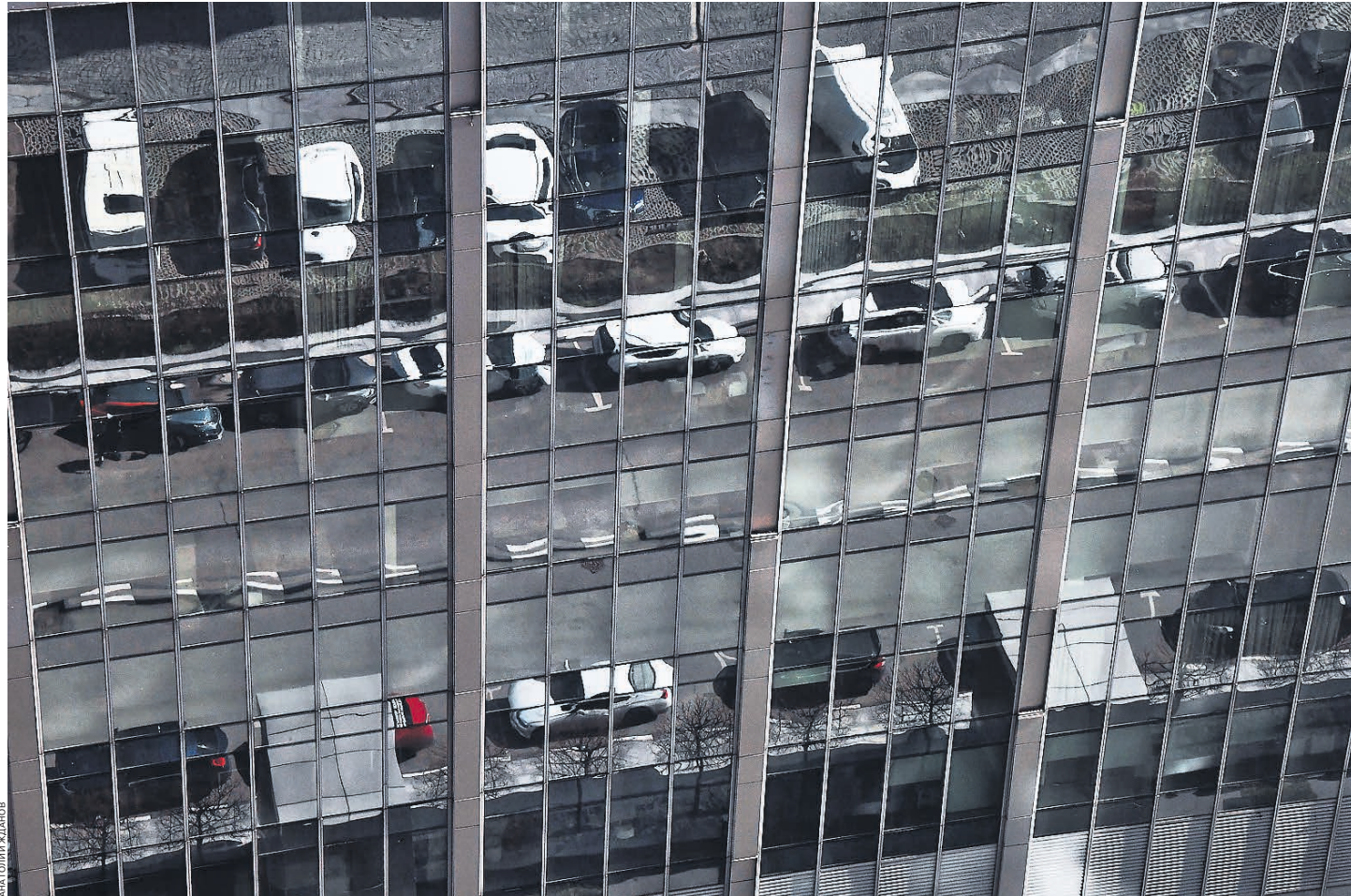
В новой версии КоАП не нашли отражения приложения для фиксации нарушений с помощью смартфонов

ле смены, дальше устройство самостоятельно «засыпает» и «просыпается» в зависимости от положения в пространстве, — пояснил «Б» го-