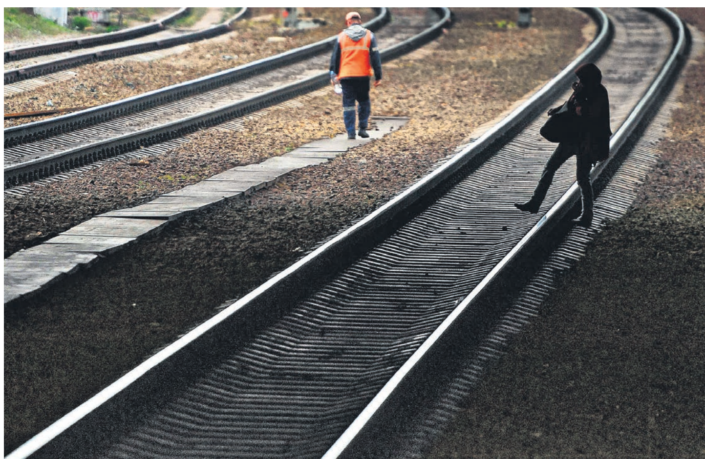
Железные дороги нашли путь в бюджет, но субсидии получат только через несколько лет и в том числе через ВЭБ.РФ

Впрочем, обещание субсидий, даже подкрепленное документами высокого уровня, не гарантирует их выделения. Так, в 2019 году с проблемой столкнулся НОВАТЭК: несмотря на поручение правительства еще в июле о выделении государством 103,6 млрд руб. на строительство федеральной части терминала «Утренний» для проекта «Арктик СПП-