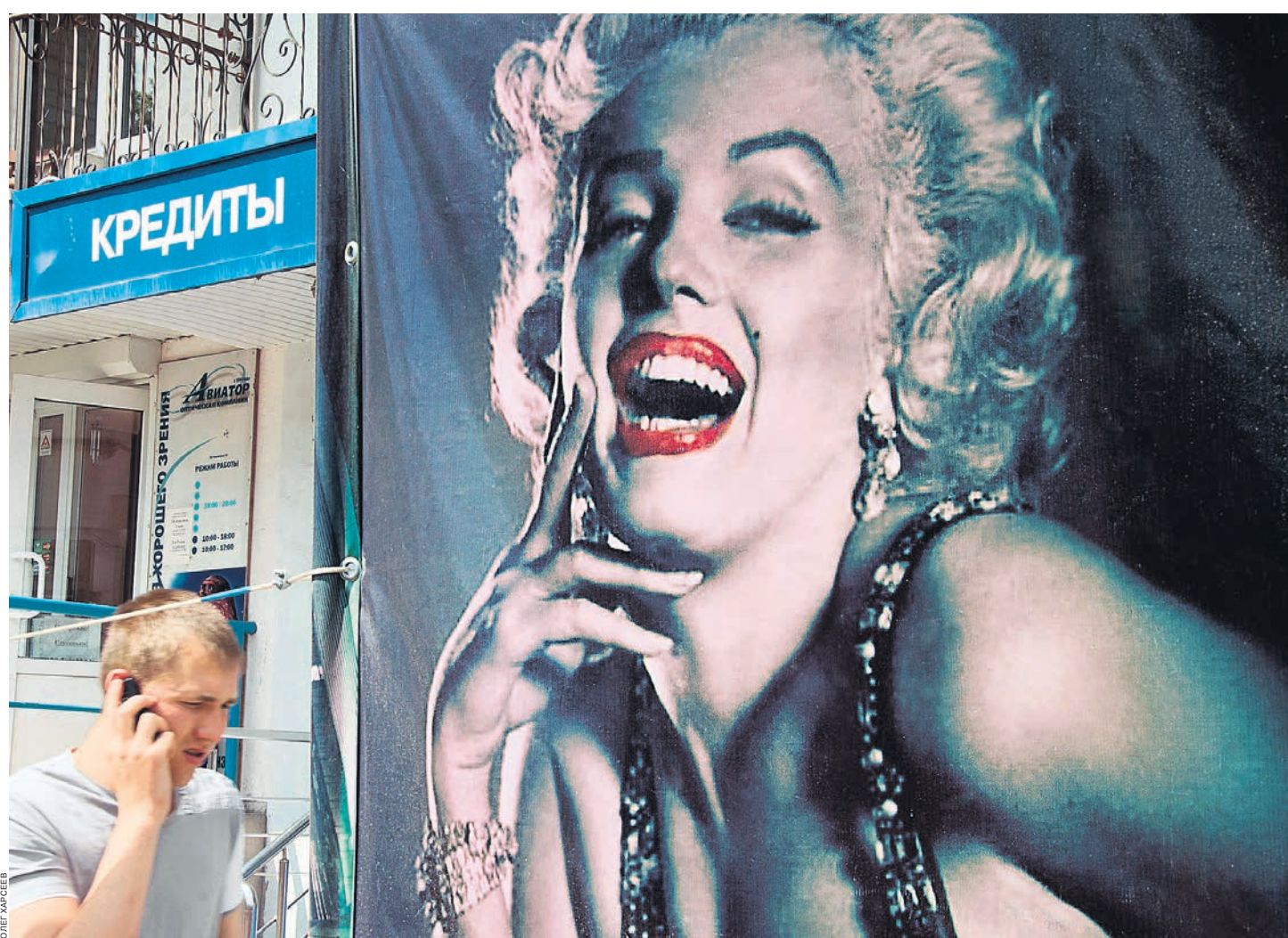
Новая законодательная инициатива может сделать кредиты лучшими друзьями российских граждан

По мнению авторов законопроекта, «говоря о добросовестном должнике, представляется необоснованным предполагать со-