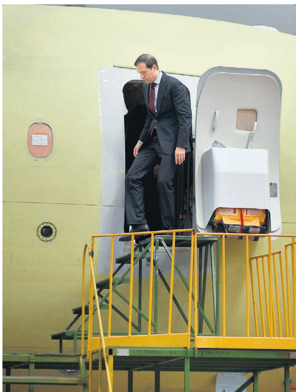
Идея главы Минпромторга Дениса Мантурова передать в «Ростех» Объединенную авиастроительную корпорацию споткнулась о многоступенчатое согласование.

Но при обсуждении проекта указа возникли разногласия, рассказали „Ъ“ источники, близкие к аппарату правительства и администрации президента. По словам одного из них, препятствием стал первый пункт документа, где речь шла об объединении ОАК с «Вертолетами России» в единую компанию, имея в виду их последующую производст-