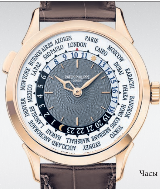
Часы World Time мод. 5230R

Москва: Столешников пер., 15, бутик Patek Philippe ЦУМ; Третьяковский проезд, 7; Кутузовский пр-т, 31 Барвиха Luxury Village; С.-Петербург: ДЛТ