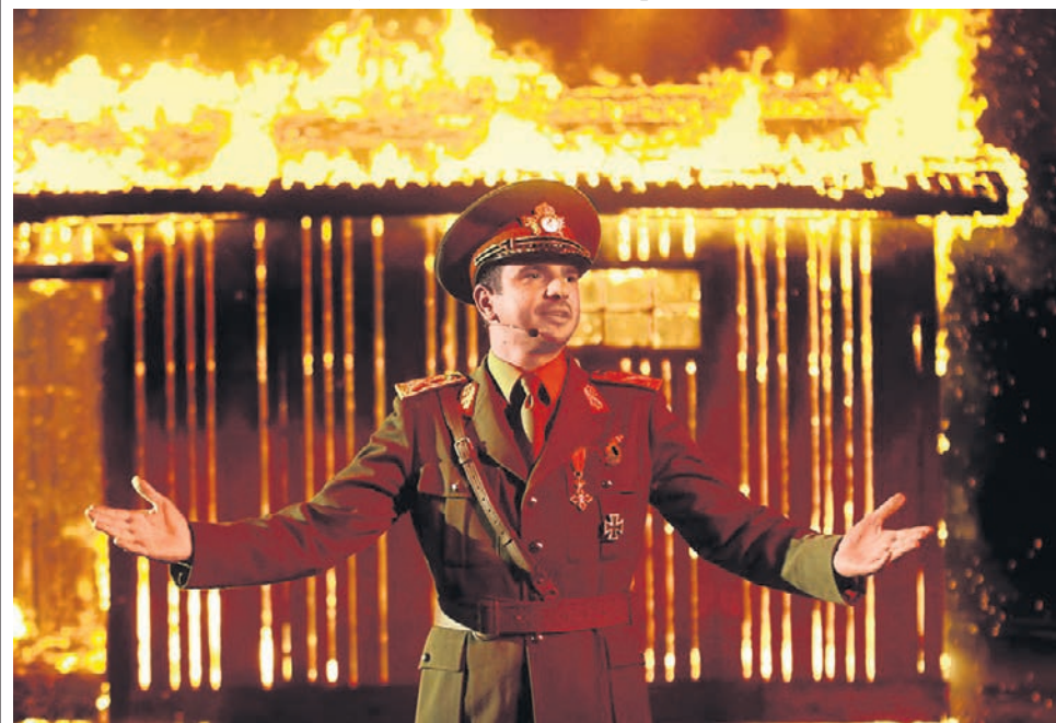
В фильме Радужде уличное представление по мотивам событий Второй мировой разжигает в массах непредвиденную агрессию

И, однако, фильм Бондарчука не похож ни на гротеск, ни на чернуху. Его суть выражает мать дяди Вовы, старуха, прожившая всю жизнь на одном месте и не давшая убежать отсюда сыну. Она говорит Лукасу: это у вас там в Киеве есть президент, депутаты, милиция, а у нас нет ничего, есть только земля, которая держит нас и дает нам силу. «Вулкан» с его мощной изобразительной фактурой и талантливой символикой самым неожиданным образом возрождает традиции поэтического кино Украины, которое, как выясняется, не умерло и не опошлело. Это также свидетельство появления зрелого кинематографа — одновременно патристического и критического.