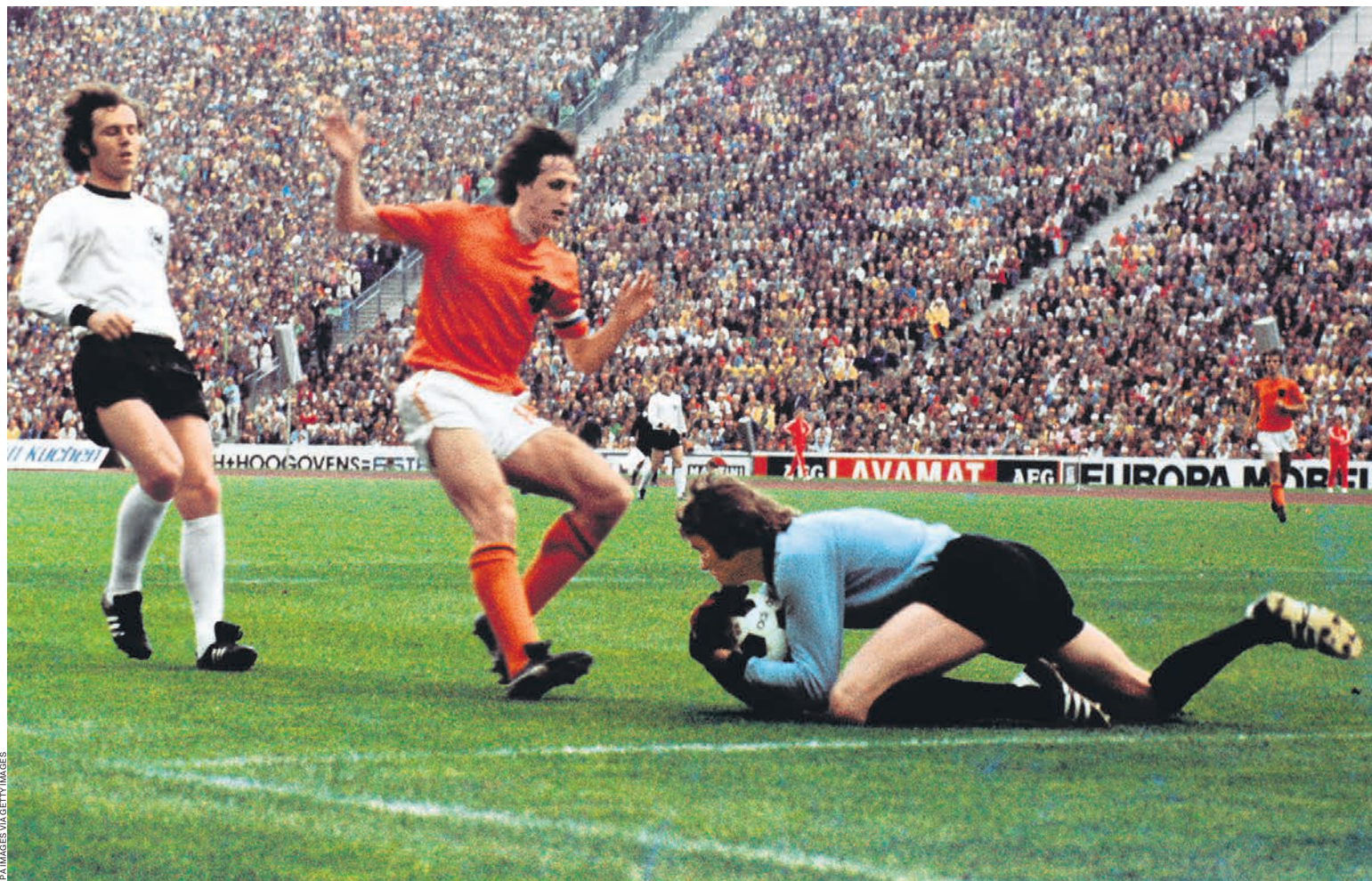
В финале чемпионата мира 1974 года сборную Голландии, ведомую Йоханом Кройфом (в центре), остановила сборная ФРГ (слева — Франц Беккенбауэр, справа — Зепп Майер)

Легендарный голландский форвард Йохан Кройф за свою карьеру набрал столько титулов, что мог бы безболезненно подарить кому-