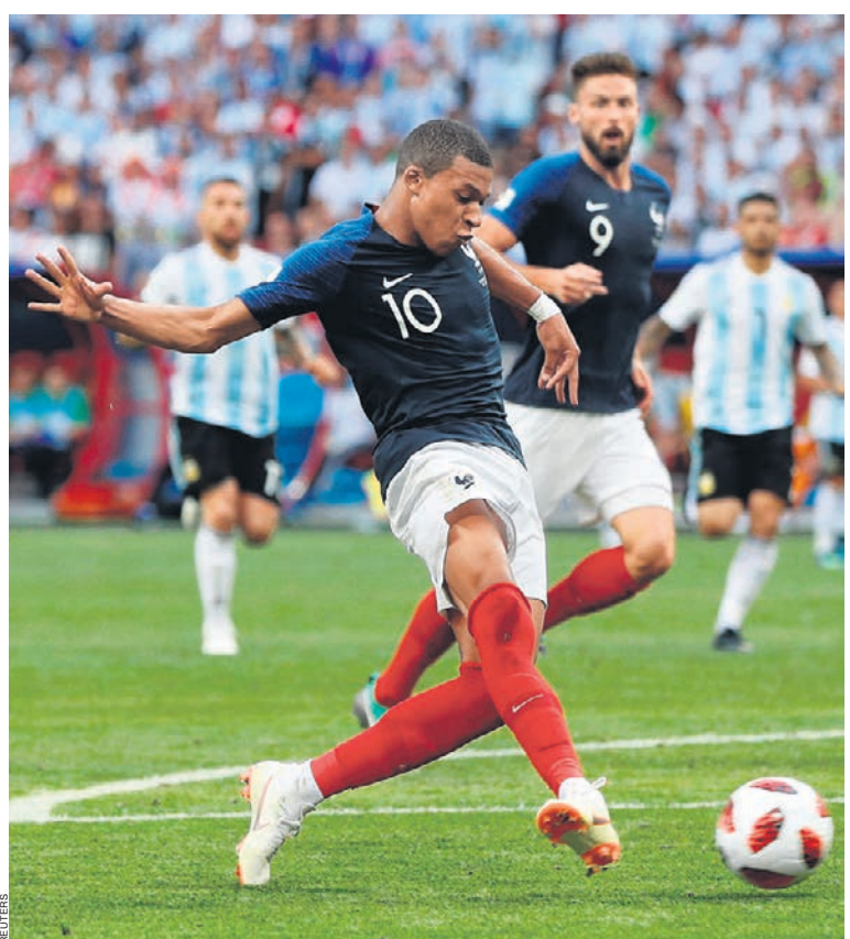
Француз Килиан Мбаппе — самый похожий на будущего футбольного фронтмена участник чемпионата мира

Соблазн поискать претендента на «Золотой мяч» по итогам 2018 года именно среди участников российского чемпионата может показаться преждевременным — впереди еще много матчей в еврокубках и разных национальных чемпионатах. Как и соблазн вычеркнуть из списка претендентов на него Криштиану Роналду и Лионеля Месси, провалившихся со своими сборными, и предсказать окончание одной из самых удивительных серий в футбольной истории: вот уже десять лет, с 2008 года, звание лучшего игрока мира они делают исключительно между