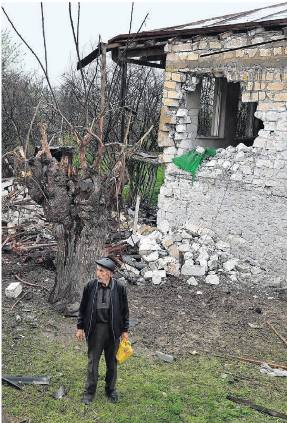
Ситуация вокруг Нагорного Карабаха все больше напоминает 1990-е годы — жертвами обстрелов становятся не только военные, но и мирные жители

Впоследствии, по сведениям «Ъ», господин Путин поручил главам Минобороны