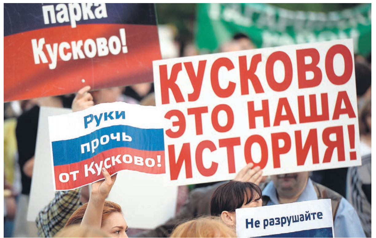
Противники вырубки «Кусково» требуют от московских властей не перечеркивать историю автотрассой

Несмотря на протесты, Мосгорнаследие в августе 2015 года выпустило приказ № 134 об утверждении новых границ парка, уменьшив его площадь (чтобы можно было приступить к реализации проекта). 22 июня 2016 года в парке вырубали около 2,5 га зеленых насаждений (противники строительства утверждают, что для строительства необходимо вырубать около 20 га). По словам защитников парка, возраст отдельных спиленных деревьев со-