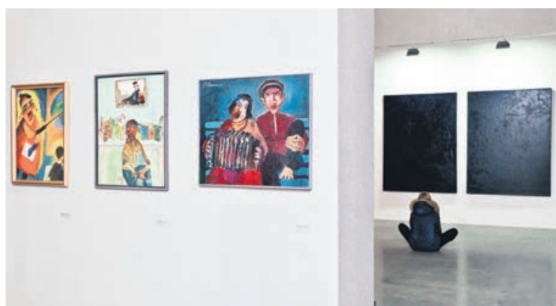
В работах владивостокских художников чувствуется влияние Китая, но скорее как дышание огромного зверя, а не его полоски