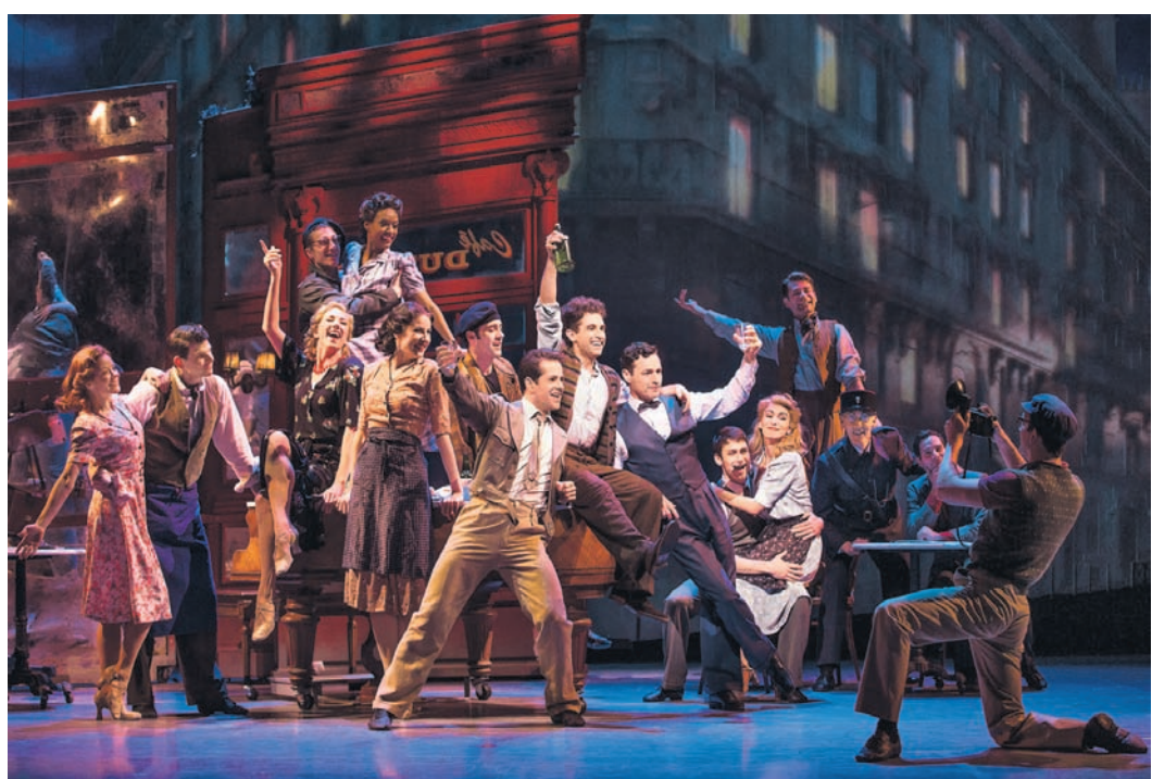
«Американец в Париже» — ремейк одноименного культового фильма 1951 года на музыку Гершвина

По сравнению с фильмом мюзикл стал заметно длиннее: дополнен новой музыкой, об-