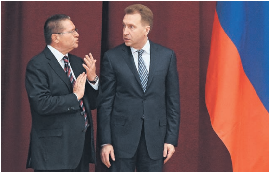
Глава Минэкономки Алексей Улюкаев (слева) предлагает правительству переждать инвестиционную паузу за счет государственных средств (справа — первый вице-премьер РФ Игорь Шувалов)

Помимо ФНБ, источниками инвестиций должны стать «отвоеванные» у соцблока правительства пенсионные накопления (1,1 трлн руб. за три года), а также механизм проектного финансирования. Говоря о последнем, министр сообщил, что хотя общий объем заявок на эти деньги составляет 2,8 трлн руб., пока фондирование получил лишь один проект. «Меха-