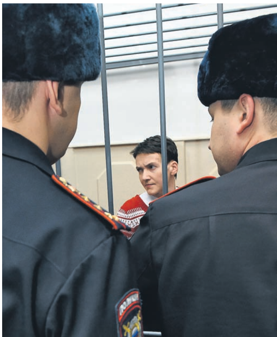
Надежда Савченко надеется убедить в своей невиновности присяжных