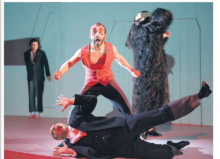
Режиссер Максим Диденко превратил «Идиота» в серию почти цирковых этюдов, при этом довольно точно передающих суть многостраничного романа