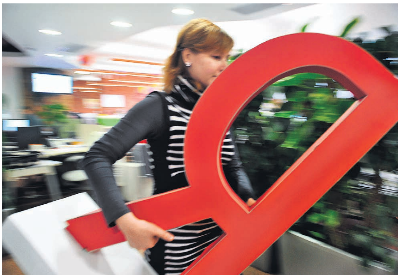
Собственные сотрудники едва не лишили «Яндекс» самого главного — исходного кода интернет-поисковика