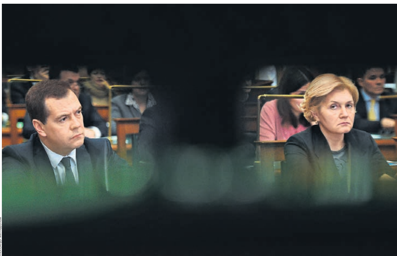
В сложившихся обстоятельствах председатель правительства Дмитрий Медведев не может гарантировать защиту от инфляции даже подопечным вице-премьера Ольги Голодец

Напомним основной сюжет в обсуждении бюджета на 2016–2018 годы: Минфином подготовлены два варианта бюджетных проектировок (см. «Ъ» от 24 июня). Один из них предполагает индексацию ряда защищенных соцрасходов федерального бюджета по действующему законодательству (в случае пенсионных расходов — на 11,9% в 2016 году, на 7% в 2017 году и на 8,4% в 2018 году), другой — индексацию по прогнозной инфляции действующего закона о бюджете на 2015–2017 годы и фактической инфляции 2016 года (пенсии в 2016 году растут на 5,5%, в 2017 году — на 4,5%, в 2018 году — на 4%). Цена вопроса — 510 млрд руб. в 2016 году, 879 млрд руб. в 2017 году и 1174 млрд руб. в 2018 году, более половины этих сумм — трансфер-