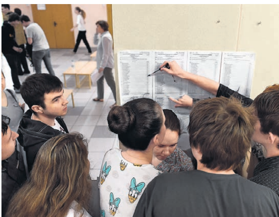
По данным Рособрнадзора, верно раскрыли проблематику контрольных текстов около 95% выпускников. Так что проблемы возникли у оставшихся 5%