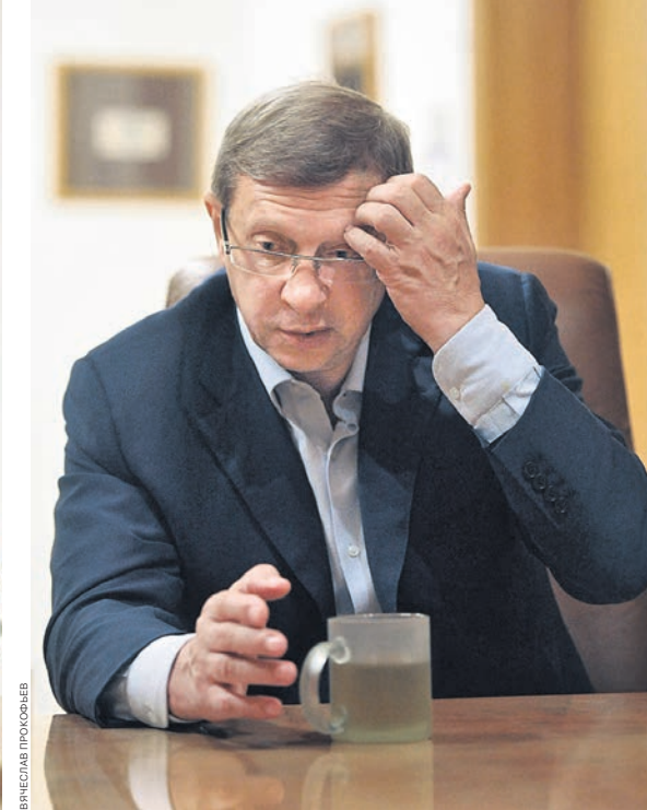
Телекоммуникационный рынок стал не таким привлекательным. У компаний стало меньше денег, на пятки наступают новые игроки типа Google, Skype

— О параметрах сделки вы с господином Гучериевым с самого начала, «на берегу» договорились? — Да. В тот момент «Руснефть» не стоила ничего. Она была разрозненная, состояла из каких-то непонятных офшоров, и самое главное, она была нагружена более $6 млрд долгов. Тогда она не стоила даже ноль. Сейчас мы возвращаем каждый год в район $1 млрд, и я думаю, что к концу следующего года долг уже будет нормальным. Сегодня «Руснефть» уже стоит достаточно больших денег. К концу года мы вернем еще, я думаю, $1 млрд или около, и компания будет летящая. — Вы участвуете в управлении «Руснефти» или вы там как портифельный инвестор? — Мы участвуем в управлении, участвуем в совете директоров, все стратегические решения Михаил Гучериев со мной согласовывает. Но вы знаете, ученого учить — только портить. Гучериев управляет четко, очень экономично. Недаром и даже там «Руснефть», которая при нем была создана из клочков, из остатков, была компанией по всем оценкам очень неплохой на тот период времени. Поэтому вмешиваться в оперативное управление было бы глупо. — Есть ли смысл в объединении «Руснефти» и «Башнефти», произойдет ли оно в будущем? — Есть такой вариант. Раз уж выдалась такая возможность — вырасти в большую компанию, которая может добывать и 60, и 70 млн тонн и которая должна быть международной, конечно, на каком-то этапе один из вопросов — это объединение с «Руснефтью». Но это надо делать не просто ради объединения, а на