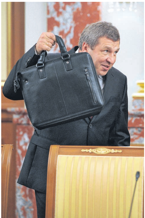
Глава Минрегиона Игорь Слюняев выиграл борьбу за полномочия и ответственность в строительстве и ЖКХ.

По данным «Ъ», агентство останется без формального руководства до середины января 2013 года: источники в Госстрое утверждают, что исполняющие обязанности главы агентства и его заместителей не назначены. Позднее это подтвердил и собеседник «Ъ» в Минрегионе — по его данным, остающиеся сотрудники агентства «в курсе ситуации, в