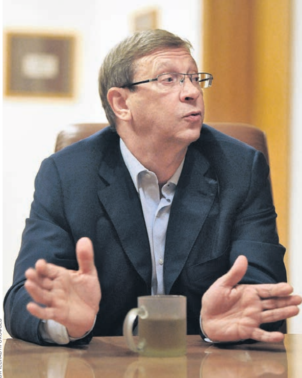
Ни один человек меня не просил отозвать иск к РЖД. Более того, на переговорах в правительстве сказали — чувствуйте правоту, пожалуйста, подавай