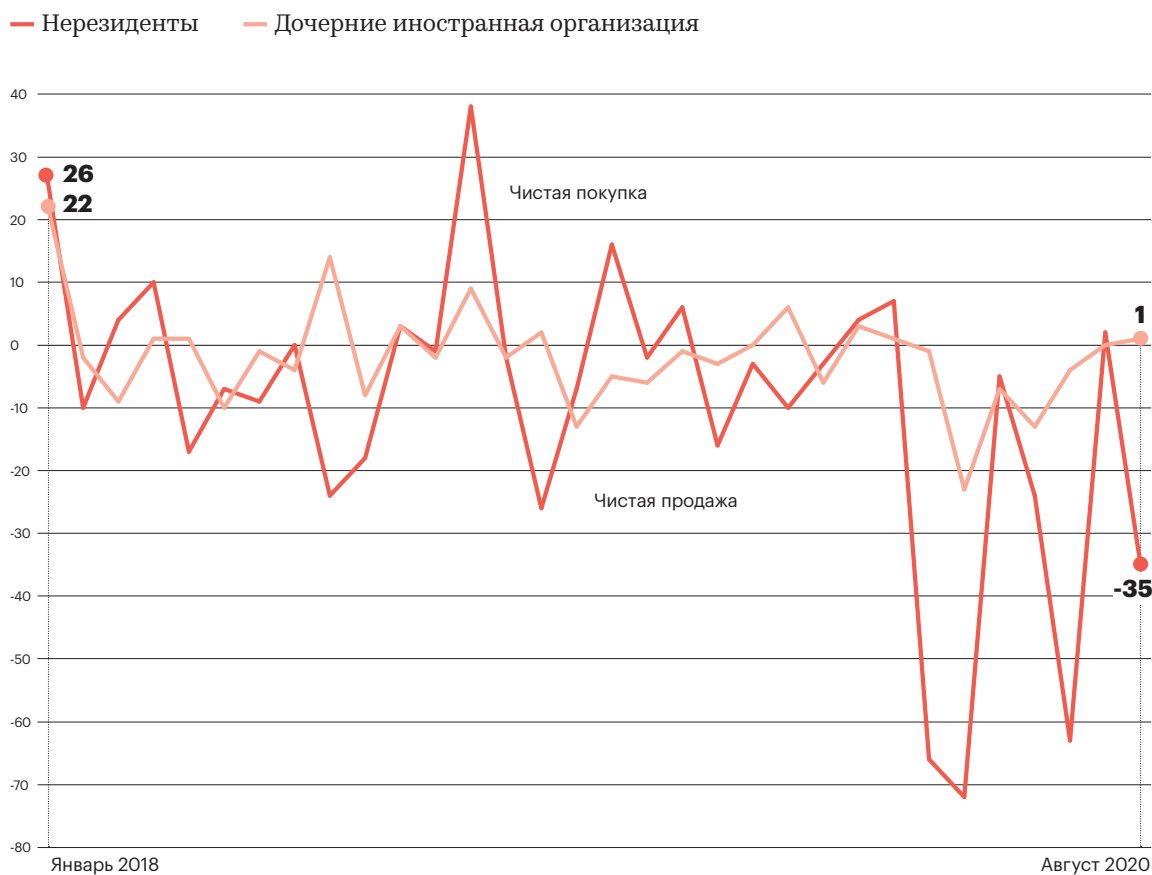
Динамика покупки/продажи акций на вторичном биржевом рынке, млрд руб.