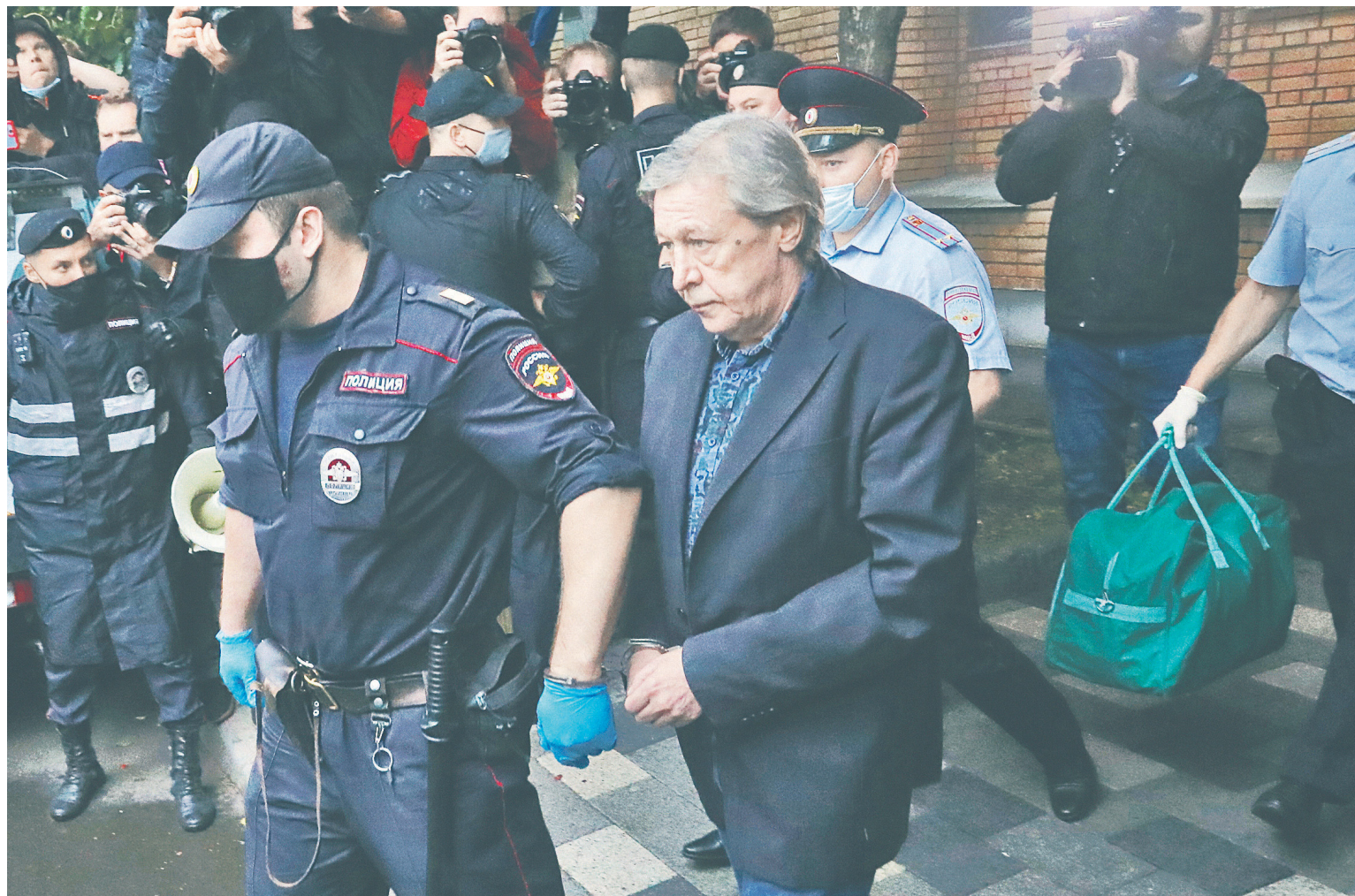
Запрошенный обвинением 11-летний срок Михаил Ефремов назвал «кровожадным», а свое поведение — «нормальным», пояснив, что отказывался от признания вины, поскольку «действительно ничего» не помнит

Популярный актер Михаил Ефремов получил восемь лет колонии по ДЕЛУ ОБ АВАРИИ, в которой погиб человек. Суд не согласился с утверждениями защиты, что джипом СИЛЬНО ПЬЯНОГО ЕФРЕМОВА управлял другой водитель.