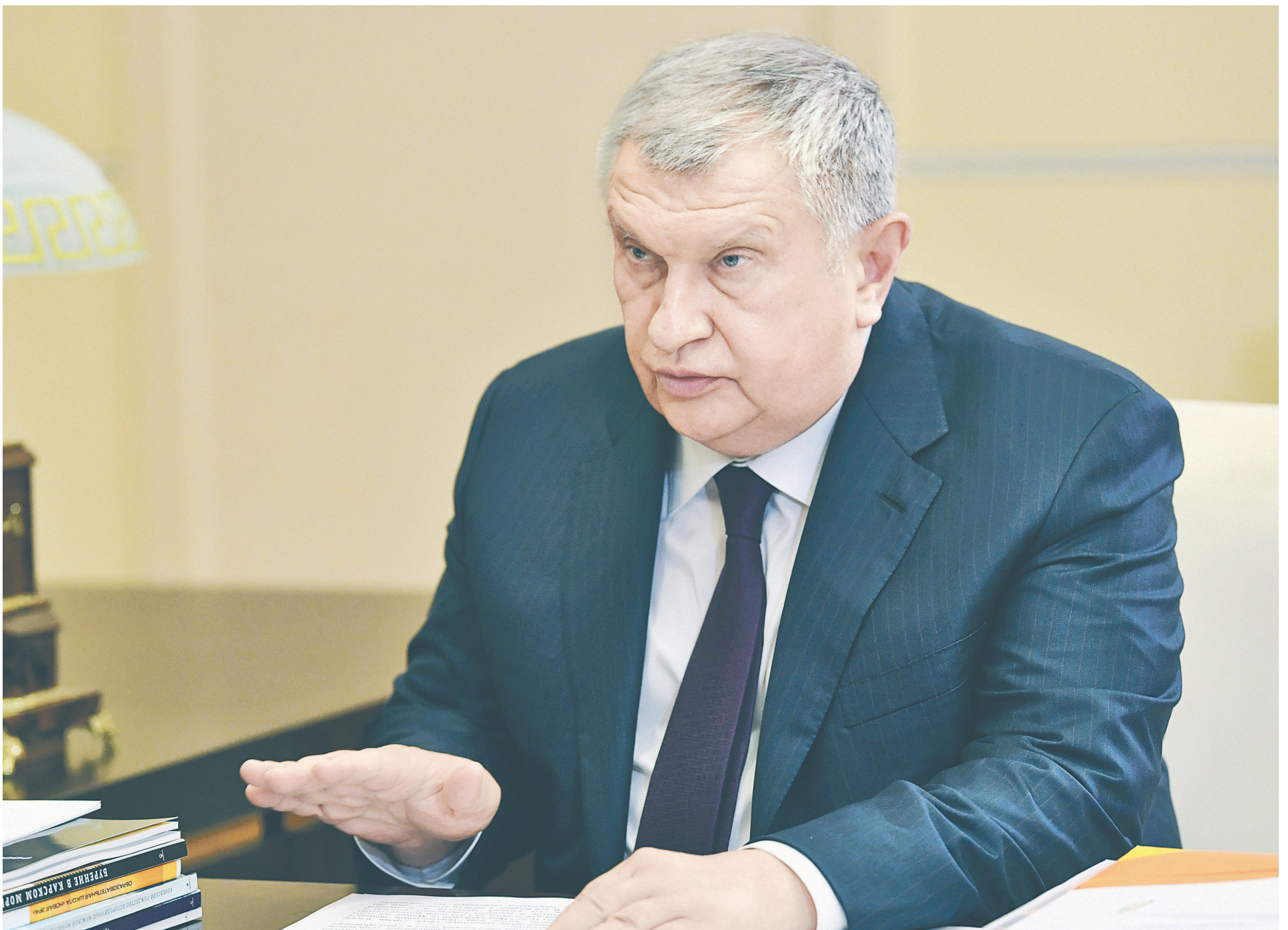
Глава «Роснефти» Игорь Сечин официально заявил, что компания готова возобновить проект Восточного нефтехимического комплекса в случае улучшения налоговых условий