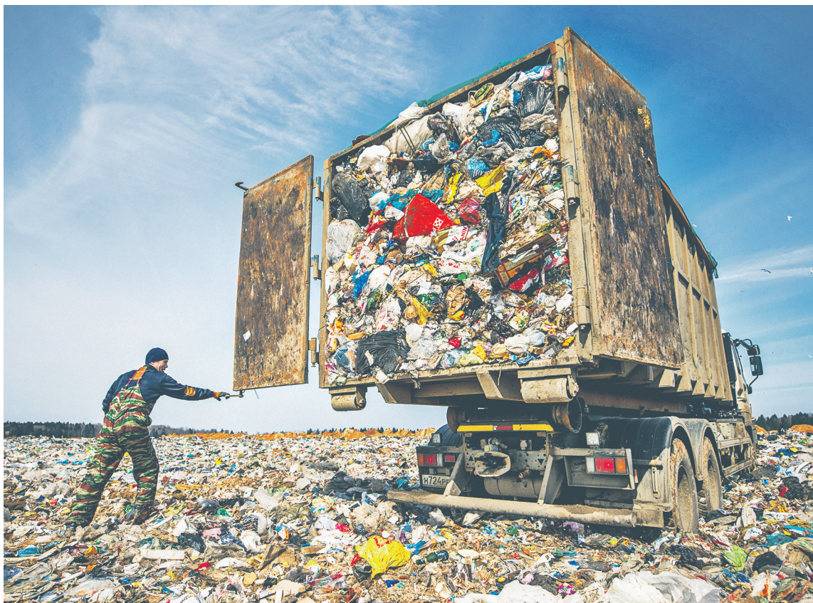
Согласно действующей схеме обращения с отходами Московской области, полигон «Ядрово» может принимать до 600 тыс. т мусора в год