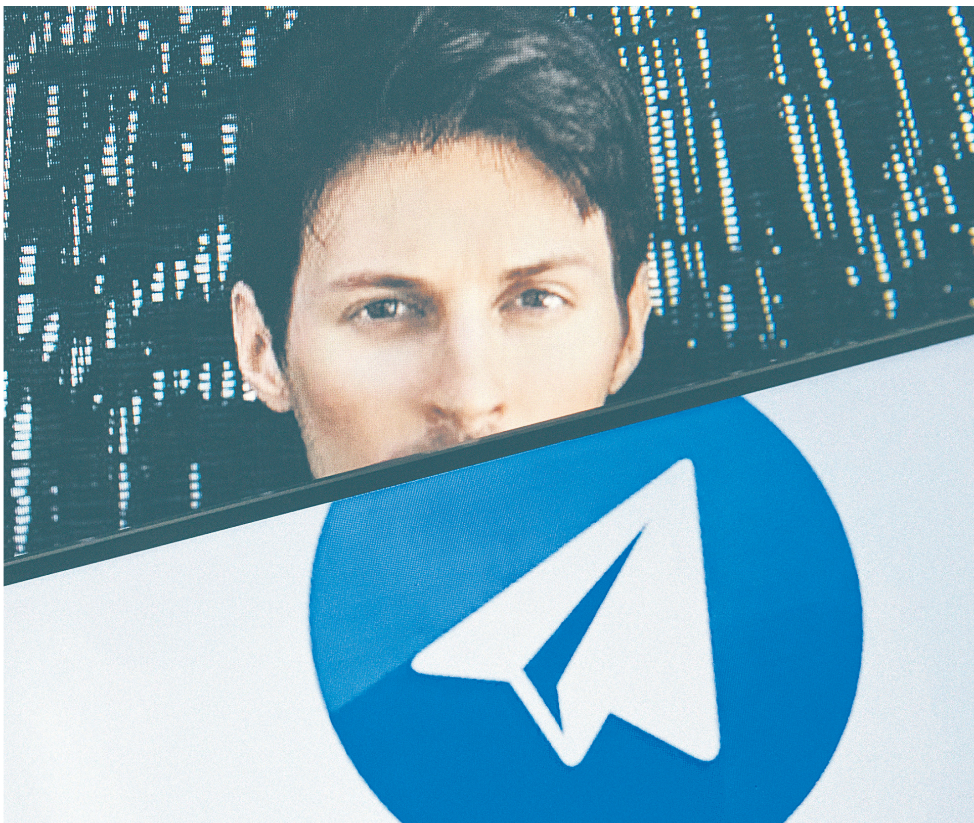
По сути, Telegram Павла Дурова (на фото) уже провел частное размещение среди ограниченного круга инвесторов, и теперь продавать токены будут они, а не сам Telegram, сказал эксперт