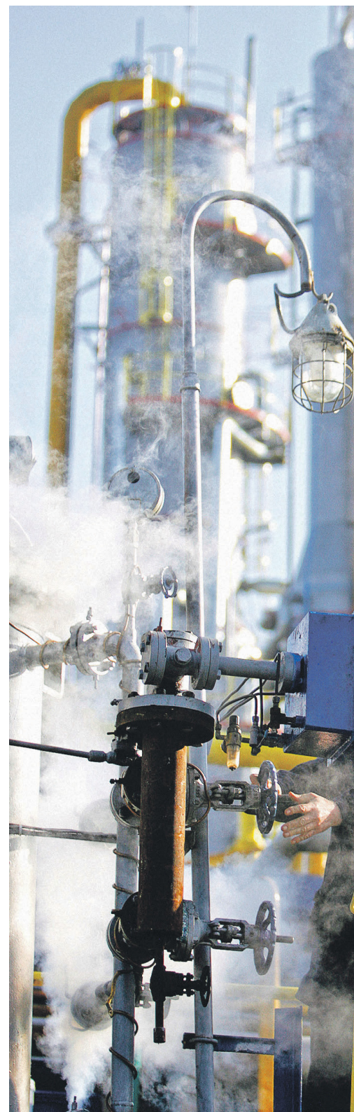
По данным Минфина, сейчас в налоговом мониторинге участвуют 44 компании, половина из которых — нефтегазовые

«Зарубежнефть» на 100% принадлежит государству и разрабатывает месторождения нефти и газа в России и за рубежом — во Вьетнаме, Сирии, Афганистане, Алжире, Анголе, Болгарии, Египте, Индии, Ираке, Иране, Кувейте, Ливии, Нигерии.