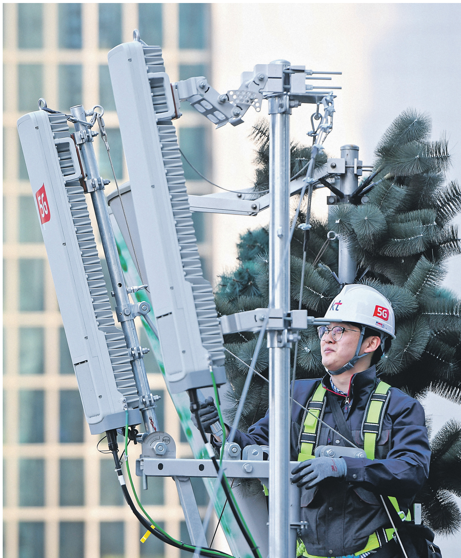
Лидерами в производстве оборудования для сетей 5G остаются зарубежные компании. Первой в мире страной, запустившей национальную сеть 5G, стала Южная Корея

Готовы ли операторы внедрять отечественные серверы в сети 5G и как это отразится на абонентах, разбирался РБК.