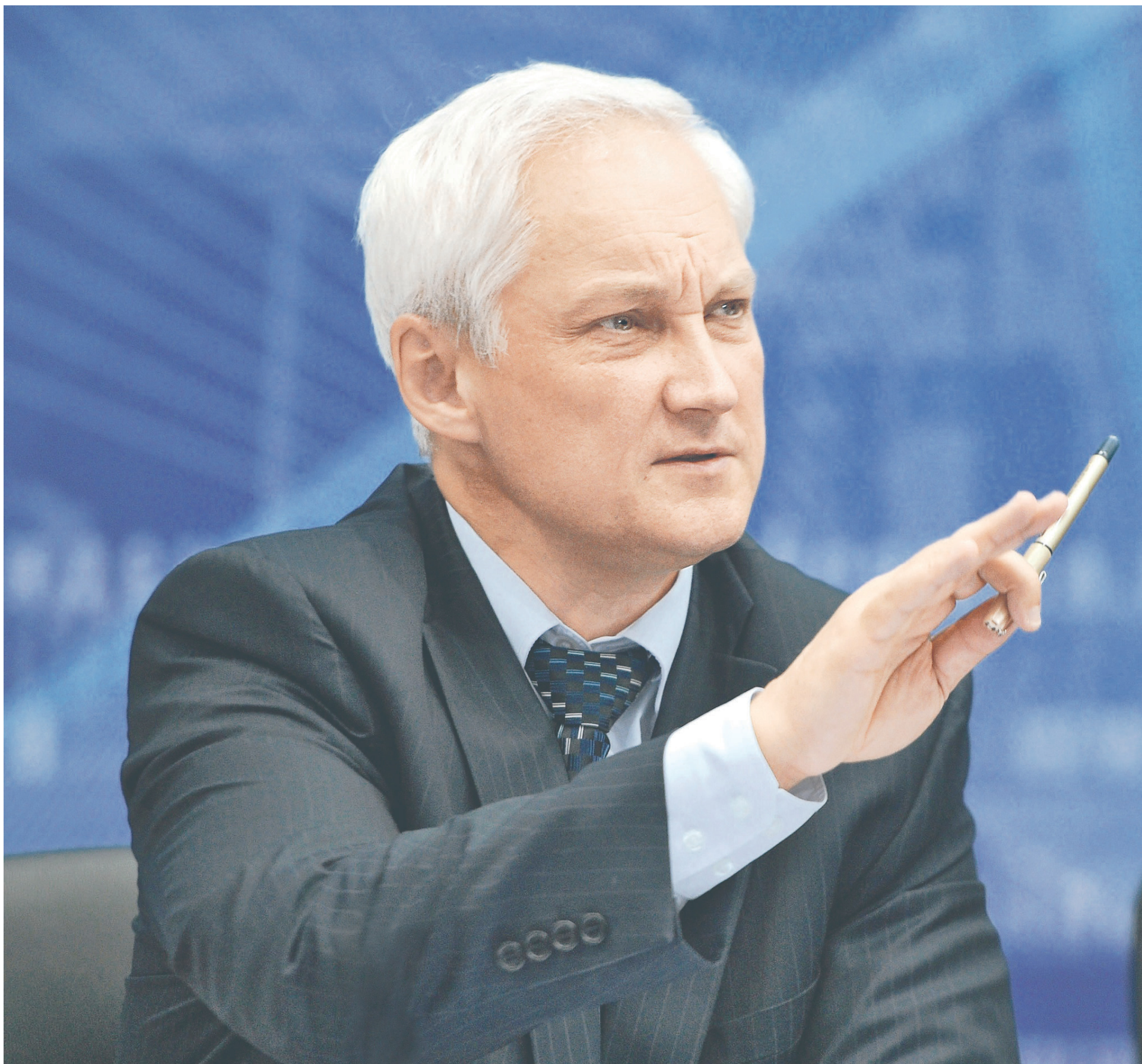
Помощник президента Андрей Белоусов считает, что текущее предложение Минкомсвязи по финансированию проекта «Цифровые технологии» может привести к неэффективному расходованию бюджетных средств