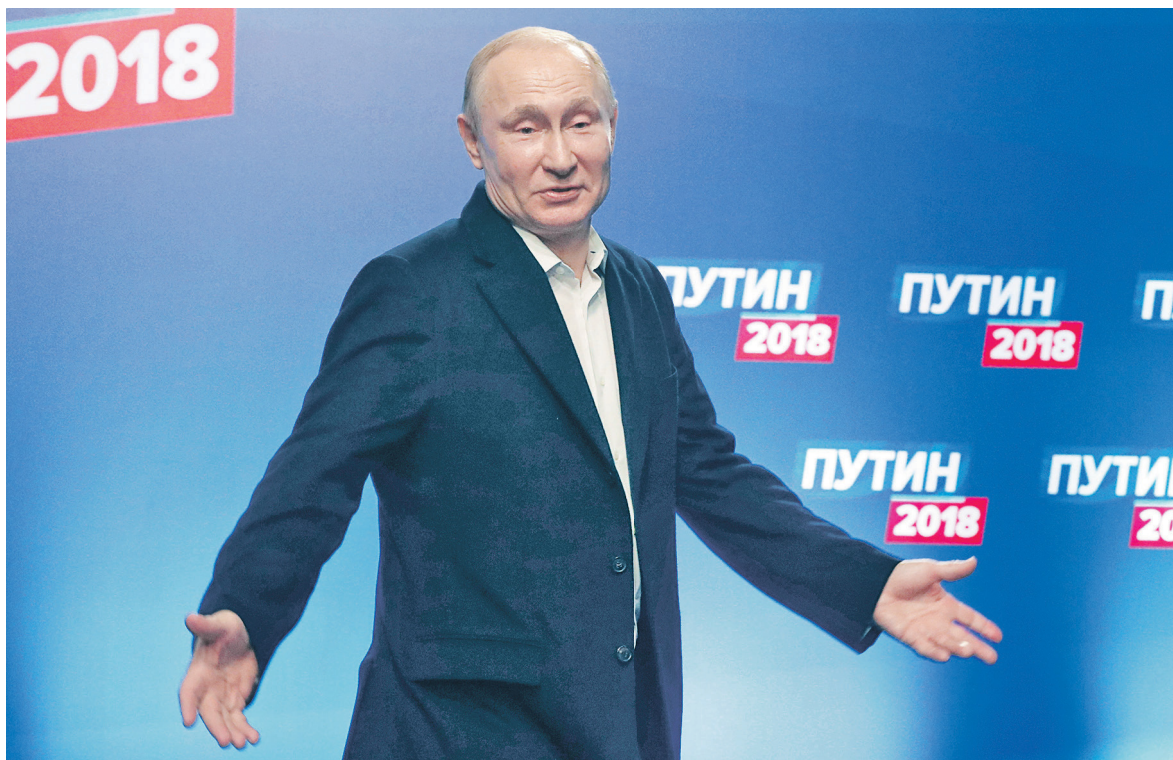
Главной неожиданностью выборов для экспертов стали данные о поддержке Владимира Путина в регионах, которые прежде отличались большей оппозиционностью