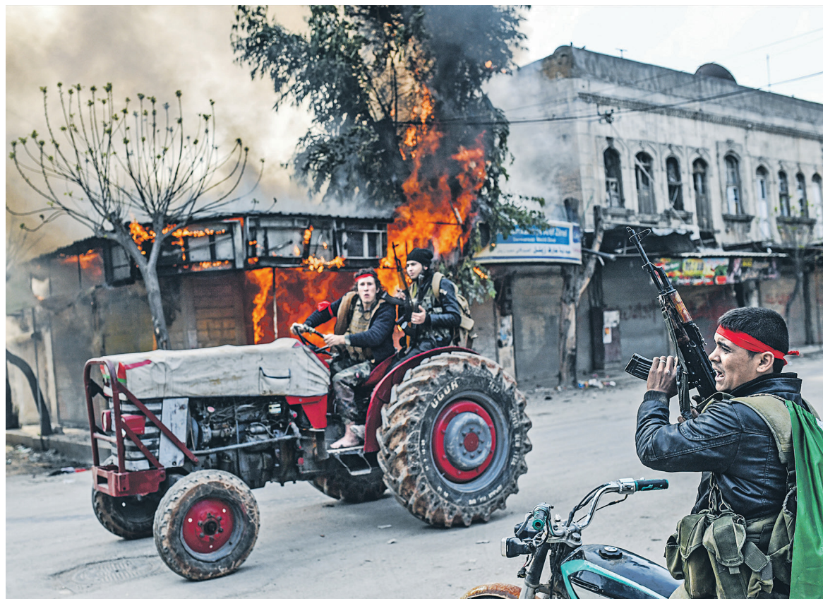
Анкара не планирует аннексировать подконтрольные ей территории на севере Сирии, считают эксперты. На фото: боевики «Сирийской свободной армии» (ССА) в занятом Турцией Африне

По данным базирующейся в Лондоне Сирийской обсерватории по правам человека (SOHR), за два месяца операции более 1500 курдских бойцов были убиты в Африне. Большинство погибли в результате авиаударов и артиллерийских обстрелов, отмечает The Guardian. Правозащитники сообщают также, что с 20 января