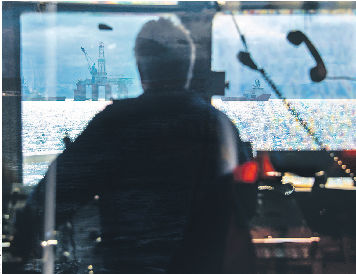
Отрасль добычи полезных ископаемых обеспечила 29% налоговых доходов консолидированного бюджета в 2017 году. На фото: буровая установка на Аяшском лицензионном участке в Охотском море

Согласно данным ФНС, поступления по статье «Добыча полезных ископаемых» выросли в 2017 году на 32%, до 5 трлн руб. «Доминируют в этом приросте сборы по НДПИ, вызванные ро-