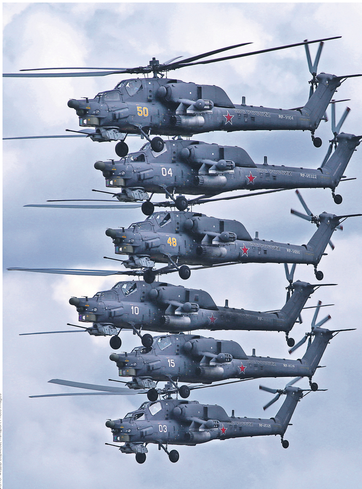
После доработки вертолета Ми-28Н, произведенной с учетом его эксплуатации в Сирии и Ираке, машина получила положительные оценки как со стороны российских военных, так и иностранных заказчиков

РБК направил запрос в пресс-службу Виктора Бондарева с просьбой прокомментировать информацию об устраненных недостатках.