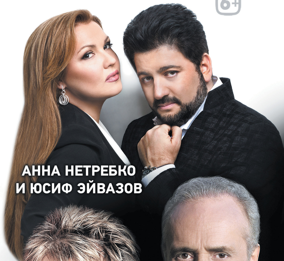
АННА НЕТРЕБКО И ЮСИФ ЭЙВАЗОВ