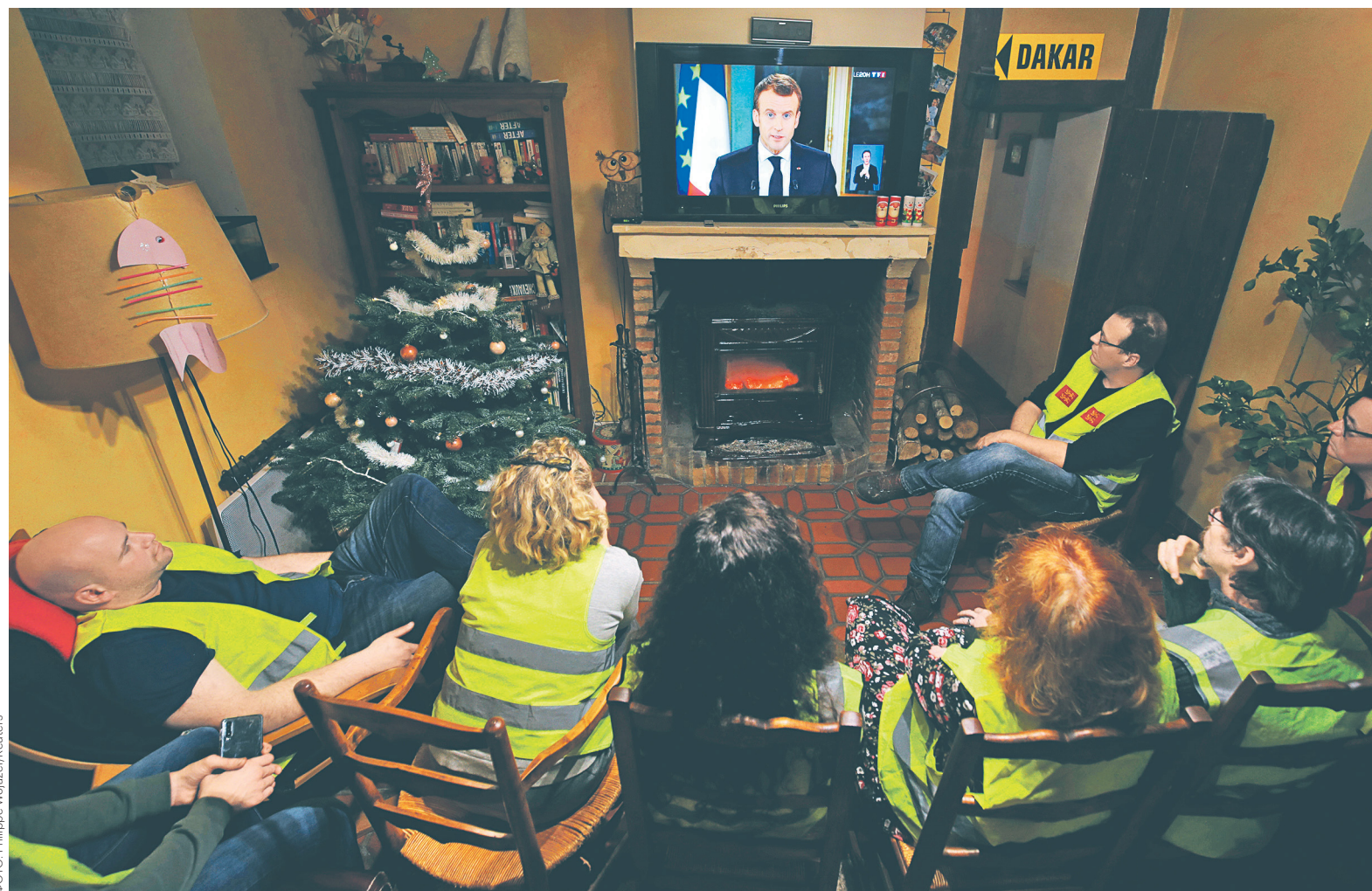
Президент Франции Эмманюэль Макрон в ходе обращения к гражданам анонсировал новые экономические меры. Затраты из бюджета на них составят €8–10 млрд

С 2019 года оплата всех сверхурочных работ не будет облагаться налогами. Изначально власти планировали вернуть налогообложение сверхурочных с сентября 2019 года. Впервые этот налог был введен во время президентства Николя Саркози и действовал на протяжении пяти лет, до