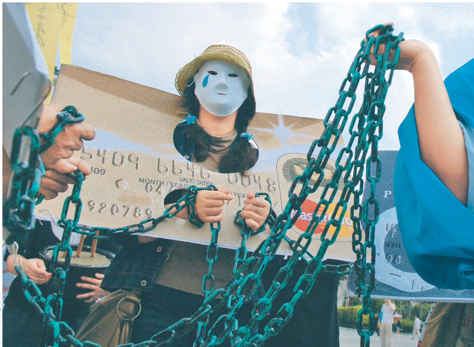
Согласно законопроекту, российские платежные агрегаторы, обеспечивающие платежи по пластиковым картам в интернете, будут контролироваться банками и небанковскими кредитными организациями

ных средств, а также открыть специальный банковский счет для работы со средствами плательщиков.