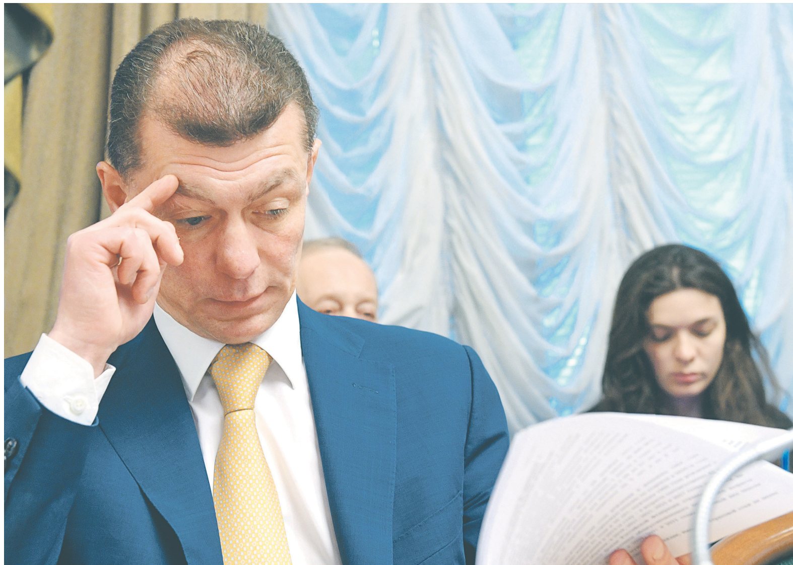
Ускоренный переход с бумажных трудовых на электронные, который предлагает Минтруд (на фото: глава ведомства Максим Топилин), поможет работодателям сократить издержки, считают представители бизнеса

— освободить работодателя от обязанности вести бумажную трудовую книжку, если работник с 2021 года меняет работу (даже если в 2020 году такой работник попросил продолжить ведение