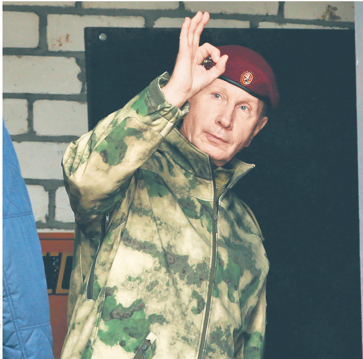
Глава Росгвардии Виктор Золотов в сентябре вызвал Алексея Навального на дуэль, а теперь подал к нему иск о защите чести и достоинства на 1 млн руб.

В конце августа 2018 года Навальный опубликовал расследование, в котором утверждал, что