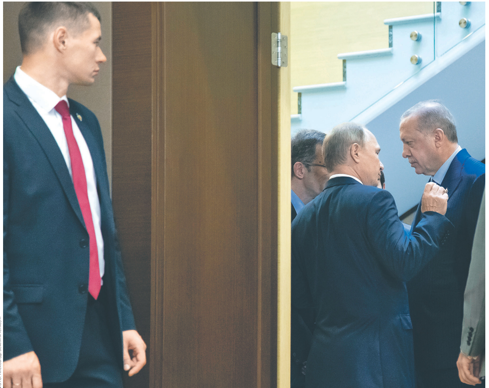
В Сочи Владимир Путин и Реджеп Эрдоган нашли решение по последнему контролируемому оппозицией и террористами району Сирии

В конце сентября прошлого года Иран, Россия и Турция договорились о создании четырех зон деэскалации в Сирии. Однако год спустя зона деэскалации сохранилась только одна — в Идлибе и на части территорий соседних провинций. Остальные зоны перешли под контроль