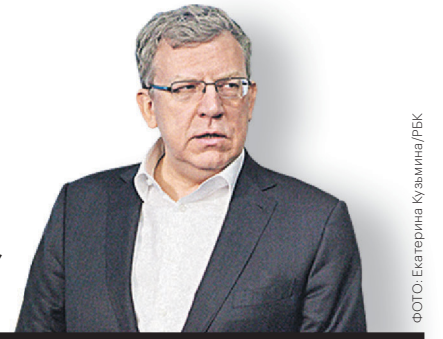
Алексей Кудрин, председатель Счетной палаты, министр финансов России в 2000–2011 годах

Точка зрения авторов, статьи которых публикуются в разделе «Мнения», может не совпадать с мнением редакции.