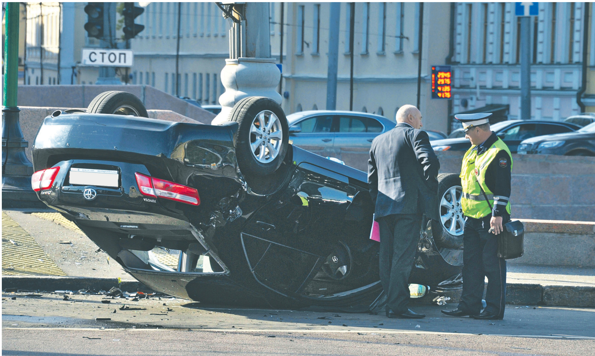
В 2017 году убыток страховщиков от ОСАГО составил 15 млрд руб.