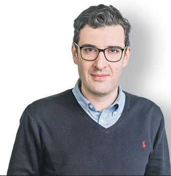
Константин Гаазе, журналист, политический обозреватель